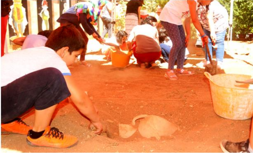
Fotoğraf 5: Arkeopark Alanı Erişim: https://www.arkeolojikhaber.com/haber-mardin-muzesi-arkeolojik-kazi-egitimi-veriyor-14709/ (04.05. 2021).