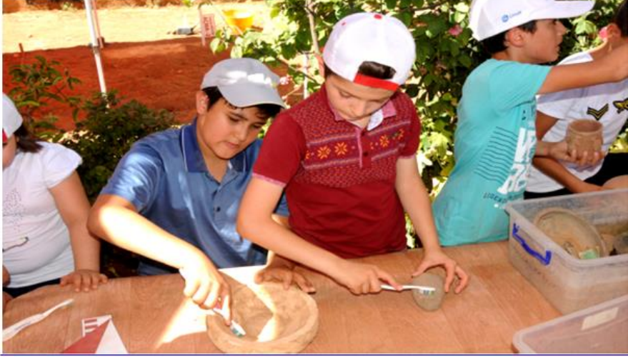
Fotoğraf 6: Arkeopark Alanı Erişim: https://www.arkeolojikhaber.com/haber-mardin-muzesi-arkeolojik-kazi-egitimi-veriyor-14709/ (04.05. 2021).