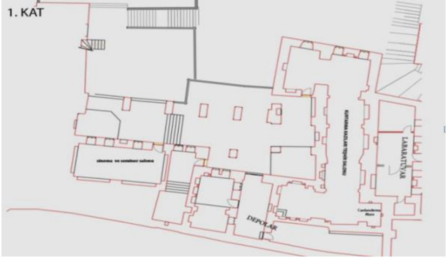
Plan 1: Mardin Müzesi Planı