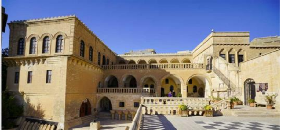
Fotoğraf 1: Mardin Müzesi Genel Görünümü