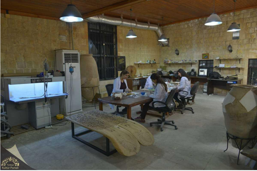
Fotoğraf 10: Müze Sanat Galerisi