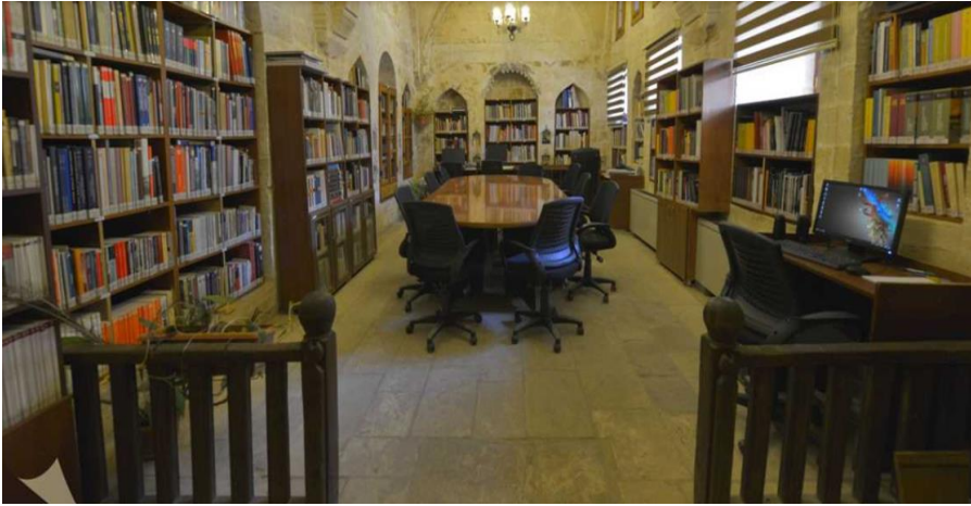
Fotoğraf 11: Müze İhtisas Kütüphanesi Erişim: https://www.kulturportali.gov.tr/portal/mardinmuzesi (14.05.2021)