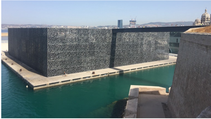
Fotoğraf 2: J4 binası ve onu Saint Jean Kalesine bağlayan köprü