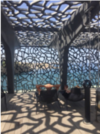
Fotoğraf 7: Ziyaretçilerin popüler mekanlarından J4 binasının terası

Öncelikle, bir kamusal alan olarak tasarlanan müze kompleksine giriş ücretsizdir. Herkes Saint Jean Kalesi’ni ziyaret edebilir, bahçeyi kullanabilir ve açık alanlarda dolaşabilir, kahve dükkanlarına, restoranlara, kütüphaneye, çocuk ve medya merkezine bilet almadan erişebilir. J4 binasının çevresinde ya da içinde gezilebilir, denize nazır teras katında vakit geçirebilir (bkz. foto. 7 ve 8). MuCEM ayrıca birçok konser, gösteri, çocuklar ve aileler için etkinlik, konferans ve diğer akademik etkinliği ücretsiz olarak sunmaktadır. Saint Jean Kalesi’ndeki iki sergi salonu ücretsiz olarak ziyaret edilebilir. Aslında MuCEM’in 30 bin metrekaresi ücretsiz gezilebilir; yalnızca 5 bin metrekaleden daha az bir alan için bilet almak gerekmektedir. Buna J4 binası Akdeniz Galerisi’ndeki yarı-kalıcı sergi ve ikinci kattaki geçici sergilere ev sahipliği yapan iki salon dahildir. 2019 yılı itibarıyla giriş bileti 9.5 Avro, indirimli bilet 5 Avro, iki yetişkin ve beş çocuğu kapsayan aile kartı ise 14 Avrodur.