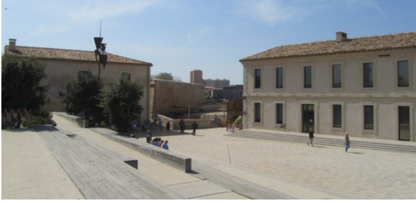
Fotoğraf 3: Saint Jean Kalesi'nin açık alanları