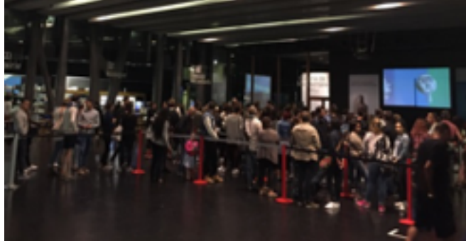
Fotoğraf 10: Ücretsiz günde Akdeniz Galerisini ziyaret etmek için bekleyenler,