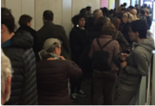
Fotoğraf 9: Ücretsiz günde “Cezayir’de Üretilmiştir” sergisini ziyaret etmek için bekleyenler,

“Benim için kaç kişinin sergimi gezeceğinden çok ziyaretçilerin çeşitliliği önemli. Popüler olup olmadığı çok da umurumda değil. Amacım beyaz, zengin, orta sınıfa dışına çıkmak. Bence küratör olarak benim görevim budur” (Florent Molle, 25.01.2017)