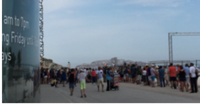
Fotoğraf 11: Ücretsiz günde MuCEM'in açılmasını bekleyen ziyaretçiler