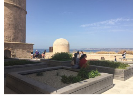
Fotoğraf 4: Saint Jean Kalesi'nin açık alanları