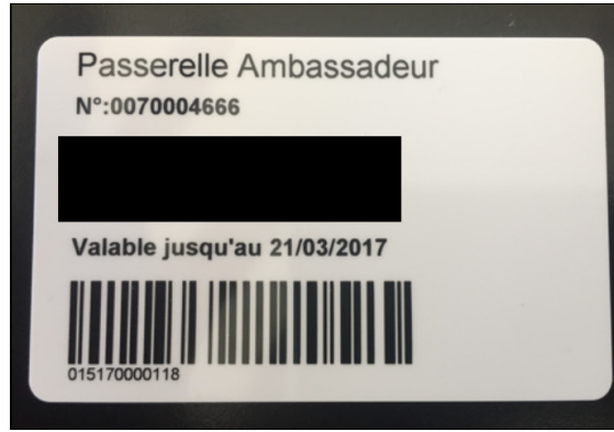
Fotoğraf 13: MIX projesi kapsamında dağıtılan elçi kartı