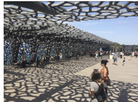
Fotoğraf 6: J4 binasının giriş katı ve terası