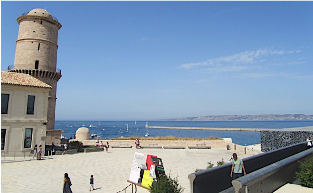
Fotoğraf: 1 Saint Jean Kalesi ve J4 binasının uzaktan görünümü