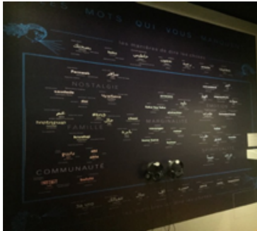
Fotoğraf 12: BABELMIX projesi kapsamında hazırlanan enstalasyon

2016 yılındaki proje ise “Babil’den Sonra: Tercüme Et” geçici sergisinin parçası olarak hayata geçirildi. Akdeniz ve Avrupa’daki dil çeşitliliğine odaklanan bu sergi, kültürlerarası etkileşimde çevirinin, çevirmenin ve çok dilliliğin önemini vurgulamayı amaçlıyordu. Bu sergi kapsamında oluşturulan “BABELMIX: Gündelik Hayatın Çevirmenleri” projesi ise çeviriyi bir bilgi birikimi olarak ele alarak Marsilya’nın göçmen nüfusunun dil ve çeviri becerilerine odaklandı. Bu sefer MuCEM, Baumettes hapisanesini de kapsayan yedi farklı mahallede yaşayan yeni göçmenlere ücretsiz Fransızca dersleri veren dernekler ile çalıştı. Bu projeye katılan doksan beş kişi Fransızca profesörleriyle anadillerinden Fransızcaya çeviremeyen, “çeviride kaybolan,” kelimeleri listeledi. Otuz beş dilde toplanan bu kelimeler enstalasyon sanatçıların desteğiyle bir stüdyoda kaydedilerek “Gündelik Hayatın Çevirmenleri” isimli sesli bir enstalasyon oluşturuldu ve “Babil’den sonra: Tercüme Et” kapsamında sergilendi (Fotoğraf 12).