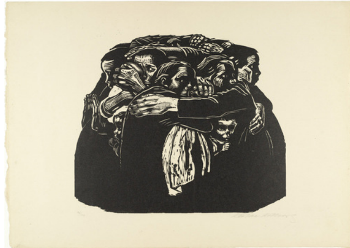
Resim 15: Käthe Kollwitz, “Anneler” savaş serisinden, gravür, 1921-1922, basım 1923.

Kollwitz ölen çocuk temasını çalışmalarında sıkça yineler. Oğlunun ölümünden önce de sonra da savaşın bu en korkunç, en acınası, en trajik yönü ve masumların ölümü konusu sanatçının ana temalarından biri haline gelir. Bu tema çerçevesinde betimlediği ve yaşadıkları tarifsiz acıyı anıtsallaştırdığı işlerinden biri de 1923 basımı “Anneler” resmidir. Kollwitz’in 1919 yılında başladığı “Anneler” yedi resimlik “Savaş” sersinden bir parçadır. (bkz resim: 7-8) 1924’te Berlin’de yeni kurulan Uluslararası Savaş Karşıtı Müze’de sergilenen bu baskılar, geride kalanların üzüntülerine odaklanırken, dayanışma ve ortak bir kederi paylaşma duygusuna da gönderme yapar. Serinin her bir parçası gibi siyah beyaz olan bu resimde de, sade geniş siyah bir leke bloğu içinde beliren baş ve eller birbirine sarılmış annelerden oluşan kayaya benzer yapı, izleyicide ağır bir hüznün ve güçlü bir görsel etki bırakır. (Resim 15)