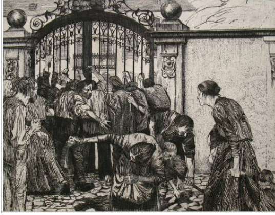
Resim 3: (Sol) “İsyân”, Dokumacıların Yürüyüşü Serisinden, gravür, 1897.