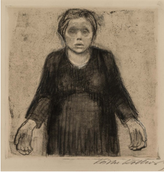
Resim 9: (Sol) Käthe Kollwitz, “Dul”, gravür, 1918.

“1914’den 1916’ya kadar Käthe çok az üretir. Yine de çalışmaları tanınmaya devam eder. 1916’da, grup sekreteri seçildikten üç yıl sonra, Berlin merkezli New Secession sanatçılarının grubunun jüri üyesi olarak seçilen ilk kadın olur. 1917’de Berlin’deki Cassirer Gallery çalışmalarını coşkuyla kabul eder. Savaşın bitmesinden sonra, 1919’da, Prusya Sanat Akademisi’ne üye ve profesör olarak seçilir. 1928’den 1933’de iktidara yükselmesi üzerine Adolf Hitler tarafından Akademi’den istifaya zorlanana kadar grafik sanatlar bölümüne başkanlık eder” (Benson, 2000, s.6).