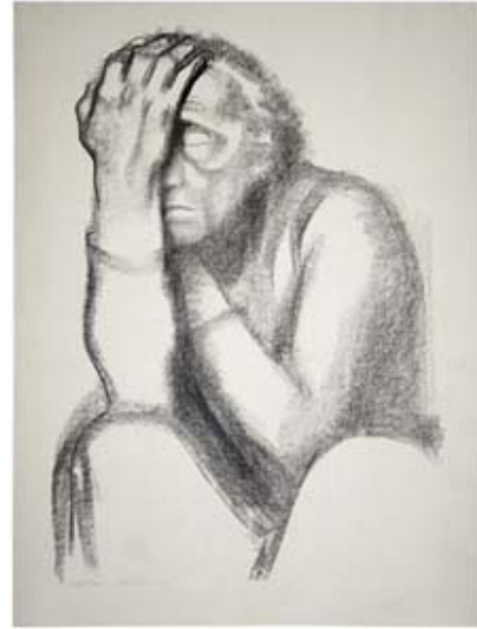
Resim 10: (Sağ) Käthe Kollwitz, “Dalgın Kadın”, gravür, 1920.

Kollwitz’in savaşın şiddetine karşı odağına aldığı konulardan biri de, ruhsal acı halinin ve donukluğun resimlerindeki göstergelerinden olan yalın kadın figürleridir. Kadının tekil olarak yaşadığı ıssız an üzerine odaklan bu resim, dul bir kadının portresini konu alır. Sanatçı, ulaşmaya çalıştığı betimsel sadelik ve ifadeselliğe odaklanarak, tinsel boyutu ağır basan bir görsel ortaya koyar. Boşlukta ifadesiz suratıyla uçar gibi duran bu hamile kadın figürü, olabildiğince sade, bir o kadar sağlam desen yapısıyla ellerini açmış, ruhani bir varlık gibidir (Resim 9).