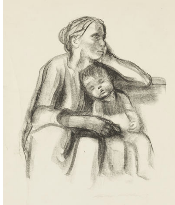
Resim 13: (Sağ) Käthe Kollwitz, Çalışan Kadın Uyuyan Çocuğuyla Birlikte, litografi, 1927.

Sanatçının savaş serisinden on yıl kadar sonra yaptığı, yoksul ve yorgun annenin düşünceli ve umutsuz oturuşu, bebeğinin kollarında masum, umarsız uyuyuşunun resmi olan bu çalışma klasik bir Kathe Kollwitz gerçekliği ile izleyiciyi başbaşa bırakır. Yumuşak bir leke düzeni içinde yapılmış resmin biçimsel yapısı, içeriğini destekleyerek, izleyiciye sakin ama hüzünlü bir duygunun kalıntılarını hissettirir (Resim13).