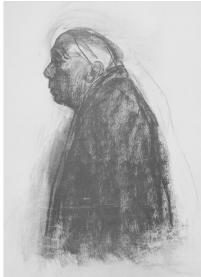
Resim 20: Käthe Kollwitz, "Son Otoportre", Litografi, 1943.

(Kearns, 1976, aktaran; https://spartacuseducational.com/ARTkollwitz.htm ).