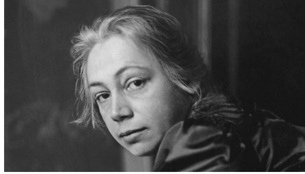
Resim 1: Käthe Kollwitz, Müneh Akademisi 'nde, fotoğraf, "Otopotre", 1889.