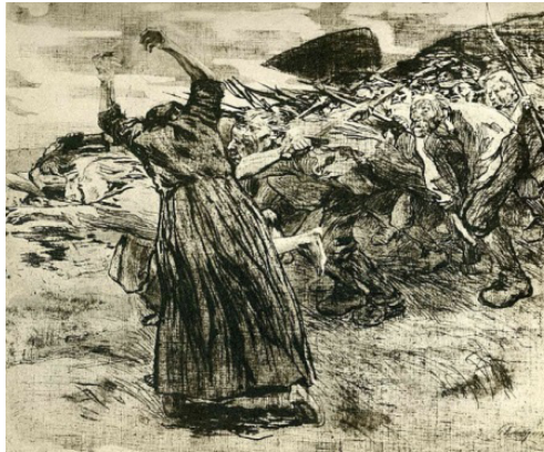
Resim 5: Käthe Kollwitz, “Salgın”, Köylüler Savaşı Serisi, 1908.

“Academé Julian'da heykel okur; ardından birkaç ay boyunca 1907'de İtalya'da Floransa'da Max Klinger'in kurduğu Villa Romana okulu ödülünü kazanarak burada çalışmaya hak kazanır. İkinci büyük baskı serisi olan Köylüler Savaşı'nın 1902 ve 1908 yılları arasında tamamlar” (Benson, 2000, s. 5) (Resim 5).