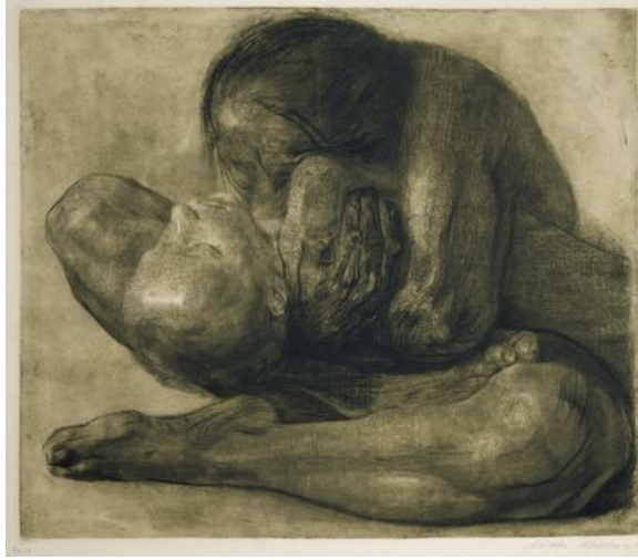
Resim 6: Käthe Kollwitz, "Kadın ve Ölü Çocuk", 39x48 cm, gravür, özel koleksiyon, 1903.

Kollwitz'in hayatında ve sanatında kırılma yaratan olayların başında, iki oğlundan küçük olan Peter'in 1. Dünya Savaşı karşıtı bir protestoda öldürülmesi gelir. 1914'te Belçika'nın Dixmuiden kentinde yaşanan bu olay, Kathe'yi bir anne olarak derinden etkiler ve onda onarılamaz bir hasara neden olur. Daima savaş karşıtı bir dünya görüşüne sahip olan Kollwitz'in yaşamındaki bu trajik olayın yaraladığı duygu dünyası, sonraki yapıtlarının doğasını kaçınılmaz olarak etkiler. Derin bir keder ve ölüm temasına çalışmalarında sıkça yer veren sanatçı, hayatı boyunca içinde yaşadığı bu acı olayı, dönem şartlarında tüm annelerin yaşadığı acılarla birleştirerek derinleştirir ve eserlerinde sıkça kullanır.