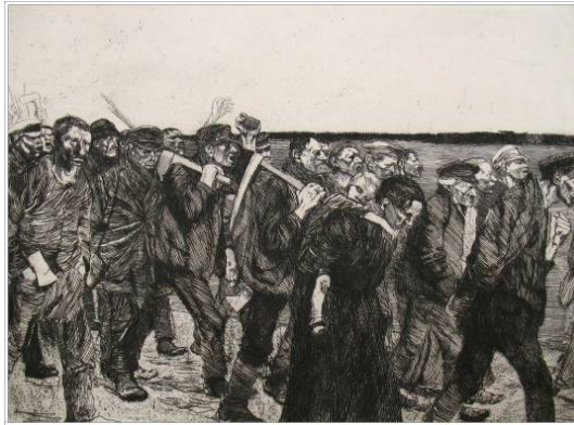
Resim 2: Käthe Kollwitz, “Dokumacıların Yürüyüşü”, gravür, 1897.

Käthe'nin ilk önemli işi olan Dokumacılar Serisi, gerçek bir isyanın hikâyesine dayanan bir tiyatro oyunundan esinlenir. Bu oyunda, 1844 yılında Prusya'nın Silezya kentinde ekonomik sorunlar nedeniyle yaşanan krizle ortaya çıkan, dokuma işçilerinin isyanı konu edinilir. Prusya ordusunun müdahalesi sonucu on bir kişinin öldürülmesiyle sonuçlanan bu olay, Hauptmann'ın oyunundan sonra Kollwitz'in önemli eserlerinden olacak bir baskı serisine kaynaklık eder. İlk büyük baskı serisinin olan “Dokumacıların Yürüyüşü veya Dokumacıların İsyanı” olarak adlandırdığı üç gravür ve üç litografi sonraki beş yıl boyunca Käthe'in ilgi alanı olur (Benson, 2000,s.5) (Resim 2-3-4).