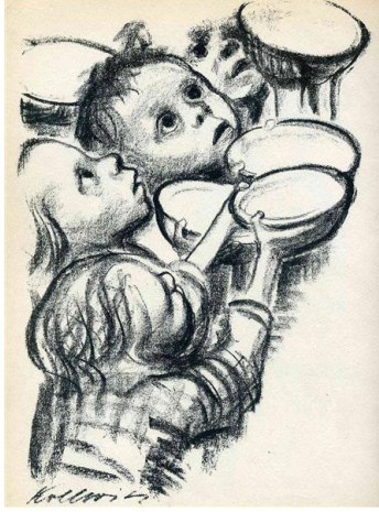
Resim 17: Käthe Kollwitz "Almanya'nın Çocukları Açlıktan Ölüyor" litografisi, 1924.