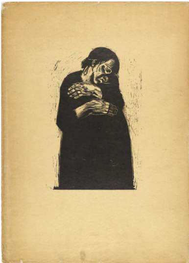
Resim 7: (Sol) Kathe Kollwitz, “Dul” savaş serisinden, gravür 1921-1922, basım 1923.

Dünya Savaşının yıkıcı etkisi Kathe’yi derinden etkiler. 1919’da, Käthe Kollwitz, savaş üzerinde çalışmaya başlar. Trajedilere verdiği bu yanıt, I. Dünya Savaşı ve sonrasında ortaya çıkan “tarif edilemez derecede zor yıllar” olarak adlandırdığı süreç boyunca sürer. İnsanların yaşadığı sefalet ve acıyı, geride kalanların çaresizliğini, “(War) Savaş” adlı yedi resimlik baskı serisinde, toplumsal gerçekçi bir bakış açısıyla yansıtır. Gravür tekniğiyle siyah beyaz olarak çalıştığı bu seride, eşini savaşta kaybetmiş kadınlar, anne babasız çocuklar, açlık ve çaresizliğin insanlık utancına dönüştüğü görüntüler Kollwitz’in resimlerinin konusu olur. Her baskı için dokuz çizimlik bir ön hazırlık yapan Kollwitz, böylece çizimlerini sade ve güçlü bir ifadeselliğe taşıdığından emin olmayı ister. Bu seriden, “(The Widow) Dul” adlı gravür baskı tekniği ile yapılmış resmin renk seçimini, serinin diğer baskılarında olduğu gibi siyah beyazdan yana kullanır. Bu resimde, son derece çarpıcı bir sadeleştirmeyle, resmin ortasında tek bir kadın figürü, karanlık bir leke olarak yer alır. Resimde, bu karaltının içinden çıkan kemikli ve yıpranmış iki el ve yana düşmüş başıyla, acıdan uyuşmuş bir kadın suratı betimlenir (Resim 7). Aynı seriden “(Parents) Ebeveynler”, yine gravür ve siyah beyaz olarak, blok bir leke halinde tasarlanır, baskıda arkada kalanların yaşadığı duygusal yıkım vurgulanır (Resim 8).