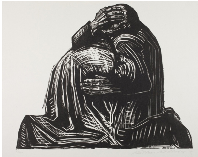
Resim 8: Kathe Kollwitz, “Ebeveynler” savaş serisinden, ağaç baskı, 1921-1922, basım 1923.