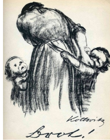
Resim 18: Käthe Kollwitz, "Ekmek" litografisi, 1924.

Bu konuda bir dizi çalışma yapan sanatçının çalışmaları kartpostal olarak dağıtılır. Almanya'nın Çocukları Açlıktan Ölüyor ve Ekmek adlı afişinde bu konuyu tüm çıplaklığı ile gözler önüne seren sanatçı, çocukları ellerinde çorba taslarıyla, açlıktan göz çukurları çökmüş, muhtaç ve yemek bekler halde resimler (Resim 17).