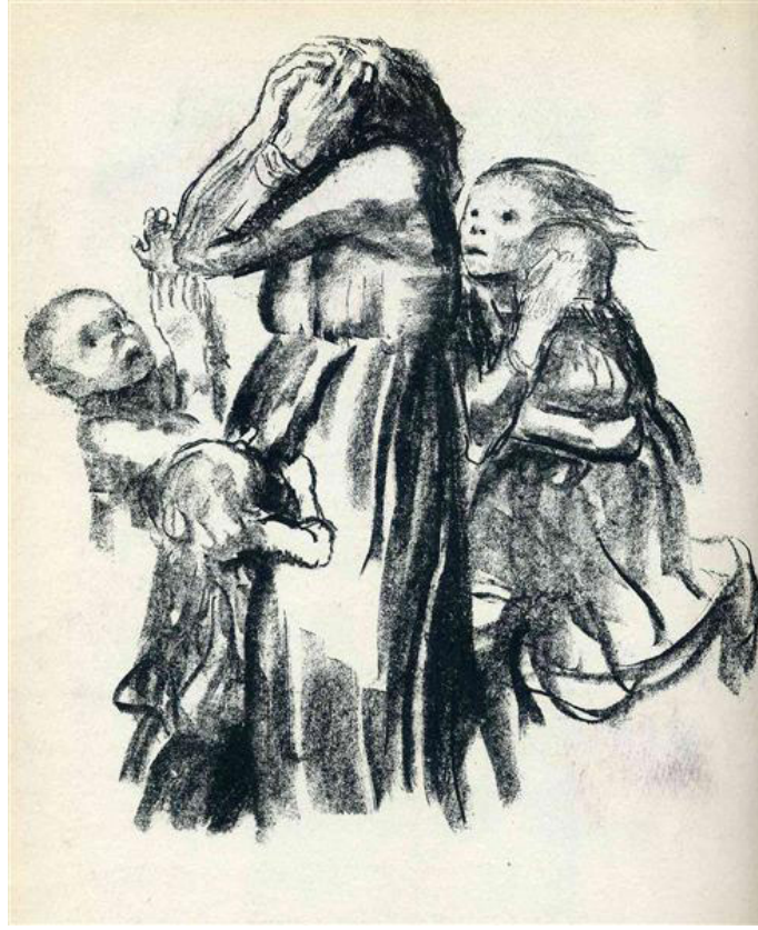
Resim 16: Kathe Kollwitz, Eylemde Öldürüldü, gravür, 1921.

1921’de Kathe, Peter’in ölümünden sonra yaşadığı üzüntü ve acı dolu yaşantının etkisiyle “(Killed in Action) Eylemde Öldürüldü” resmini üretir. Bir eskiz havasındaki bu resimde, annelerinin etrafında korkulu gözlerle koşuşan çocukları ve annenin kötü haberi aldığındaki trajik hali betimlenir. Bu haliyle Kathe Kollwitz’in resmi, zaman ve mekândan bağımsız, evrensel bir duygu durumunu görsel hale getirir (Resim 16). Savaş sonrası yıllarda bir pasifist olan Kollwitz, “ gençlerin fedakarlığının savaş için bir idealizime değil, daha iyi bir yaşam ve toplum inşa etmeye doğru yönlendirilmesi ” gerektiğini söyler (Kearns, 1976 aktaran; John Simkin).