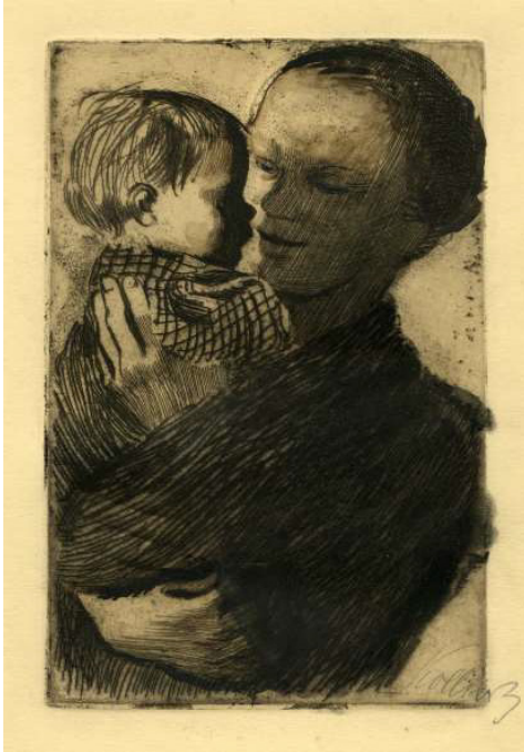
Resim 12: (Sol) Käthe Kollwitz, “Anne ve Kollarında Çocuğu”, gravür, 1910.

“Kathe Kollwitz. Bu isim annelerin güçlü imajını çağrıştırıyor. Çocukarı, insanlar arasındaki sosyal dayanışmayı, sosyal adeletsizliğe karşı protestoyu ve acıyı” (Prelinger, 1992, s.13). İki çocuk sahibi olan ve birini genç yaşta kaybeden Kathe Kollwitz, anneler ve çocuklar üzerine onlarca resim, litografi ve heykel yapmıştır. Yaşadığı evlat ve torun kaybının acısını hayatı boyunca hiç azalmadan yaşayan sanatçı, bu temayı belki de bir katharsis gibi deflarca farklı şekillerde yinelemiştir. Dönemin koşullarının baskın etkisiyle, çoğunlukla acı ve keder içeren bu resimlerden sadece bir kaçı kucağında sağlıklı bebeğiyle mutlu bir anneyi tasvir eder. (Resim 12)