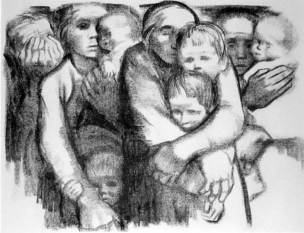
Resim 11: Käthe Kollwitz, "Dul ve Yetimler", litografi, 1919.