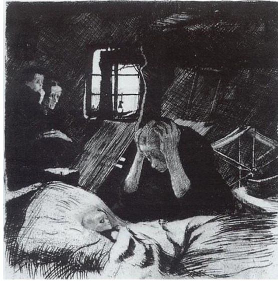
Resim 14: Käthe Kollwitz, Yoksulluk, litografi, 1893-1894.

Kollwitz ölen çocuk temasını çalışmalarında sıkça yineler. Oğlunun ölümünden önce de sonra da savaşın bu en korkunç, en acınası, en trajik yönü ve masumların ölümü konusu sanatçının ana temalarından biri haline gelir. Bu tema çerçevesinde betimlediği ve yaşadıkları tarifsiz acıyı anıtsallaştırdığı işlerinden biri de 1923 basımı “Anneler” resmidir. Kollwitz’in 1919 yılında başladığı “Anneler” yedi resimlik “Savaş” sersinden bir parçadır. (bkz resim: 7-8) 1924’te Berlin’de yeni kurulan Uluslararası Savaş Karşıtı Müze’de sergilenen bu baskılar, geride kalanların üzüntülerine odaklanırken, dayanışma ve ortak bir kederi paylaşma duygusuna da gönderme yapar. Serinin her bir parçası gibi siyah beyaz olan bu resimde de, sade geniş siyah bir leke bloğu içinde beliren baş ve eller birbirine sarılmış annelerden oluşan kayaya benzer yapı, izleyicide ağır bir hüznün ve güçlü bir görsel etki bırakır. (Resim 15)