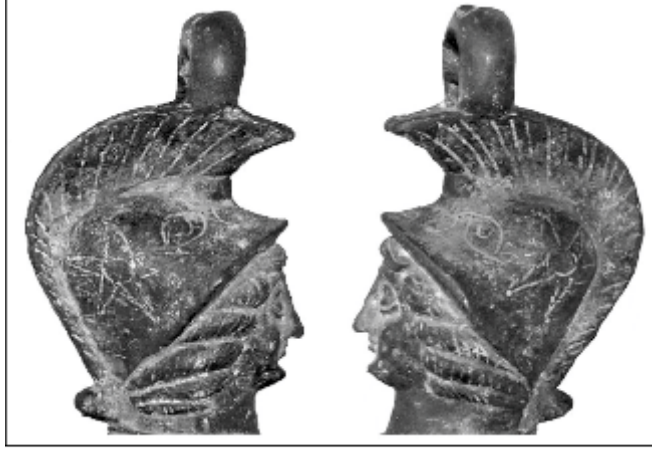
Resim 3: Miğferin iki cephesinde yer alan beş ve altı kollu olmak üzere birer yıldız ve balık betiminden görünüm.