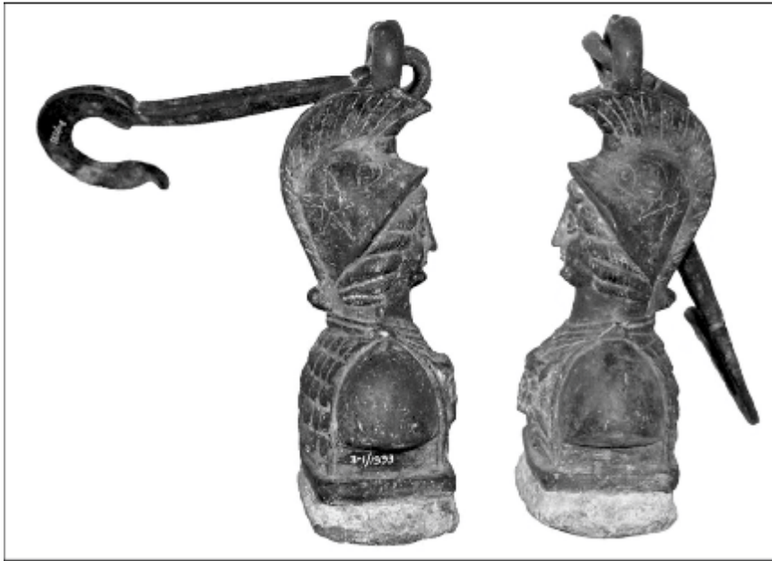
Resim 2: Kantar ağırlığının her iki profilden görünümü.