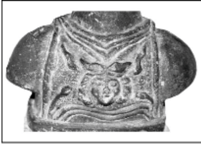
Resim 5: Aegis'ten görünüm.