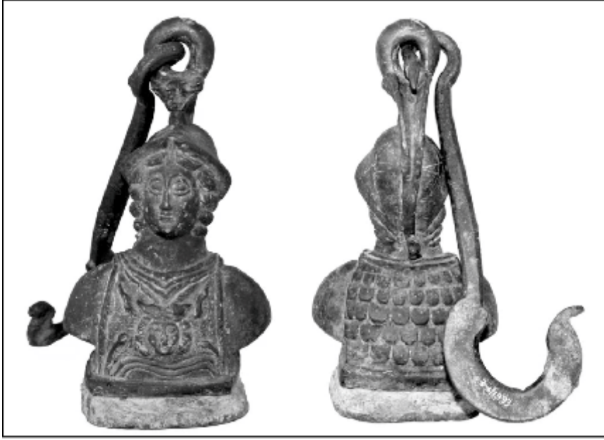
Resim 1: Kantar ağırlığının ön ve arka cephesinden görünümü.