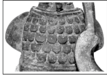
Resim 6: Sırt kısmındaki balık pulu bezemesi.