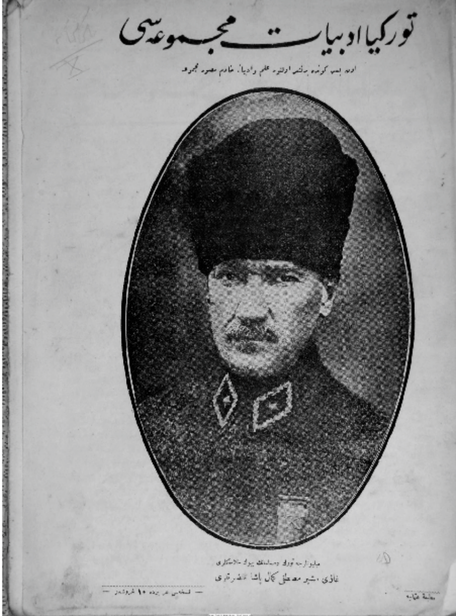
Türkiye Edebiyat Mecmuası Birinci Sayı Ön Kapak Fotoğrafi