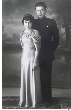
Fotoğraf 15: Mesleği Asker Olan Damadın Nişan Fotoğrafı Örnekleri