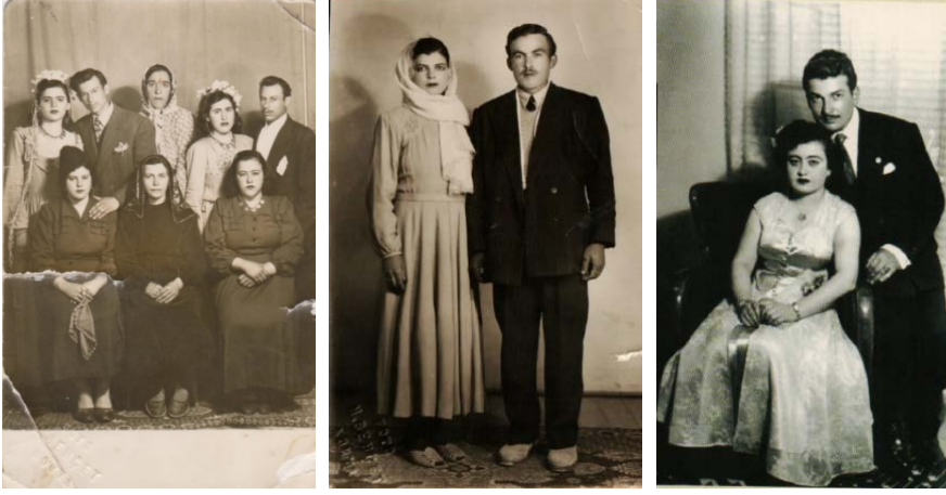
Fotoğraf 33: 1950 Yılına Ait Düğün ve Nişan Fotoğrafı (Sağ ve Solda Oturan Gelinler).