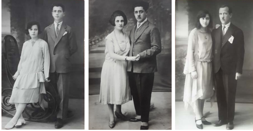
Fotoğraf 20 - 21 - 22: 1923 - 1929'lu Yıllara Ait Nişan Fotoğrafı

20 - 22 numaralı fotoğraflarda yer alan gelinlerin giysilerine genel olarak bakıldığında; giysi çeşidi olarak elbise giydiği görülmektedir. Giysiler renk açısından incelendiğinde; açık renklerin ön planda olduğu dikkat çekmektedir. Giysiler model açısından incelendiğinde; kol altından bele ya da kalçaya düz inen, etek ucu hafif açılımlı, bol modellerin tercih edildiği görülmektedir. Giysilerde oyuntulu yakanın ("V", geniş "U", sıfır) uygulandığı görülmektedir. Giysilerde düşük kol ve takma kol modellerinin uygulandığı; kol boylarının da kısa kol ve uzun kol olarak değiştiği görülmektedir. Bu dönemde giyilen giysilerin en dikkat çeken özelliği ise giysi model boylarının baldır hattında bitmesidir. Elbiselerin genellikle bu dönemde verev kesilen parçalar ile süslendiği dikkat çekmektedir. Giysileri tamamlayan aksesuar açısından bakıldığında; ayakkabı ve ince çorabın yanı sıra farklı aksesuarların da (saç tokası, kolye, saat, bilezik, broş) tercih edildiği görülmektedir. Gelinlerin saç modellerine bakıldığında; genellikle saçların kulağın alt hizasında (küt model) bittiği ve hafif dalgalı modellerin yapıldığı görülmektedir.