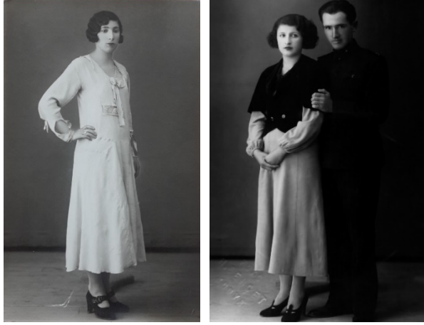
Fotoğraf 25 - 26: 1930 - 1939'lu Yıllara Ait Nişan Fotoğrafı

23 - 26 numaralı fotoğraflarda yer alan gelinlerin giysilerine genel olarak bakıldığında; giysi çeşidi olarak elbise, elbise-kısa kollu ceket giyildiği görülmektedir. Giysiler renk açısından incelendiğinde; açık renklerin ön planda olduğu dikkat çekmektedir. Giysiler model açısından incelendiğinde; bele hafif oturan, belden kesik ve belden aşağıya hafif açılımlı modellerin tercih edildiği görülmektedir. Giysilerde oyuntulu (sıfır, "V") ve takma yaka; kollarda da takma kol modellerinin uygulandığı dikkat çekmektedir. Kol boylarının truvakar kol ya da uzun kol olduğu görülmektedir. Ayrıca kol ağzına dar kalın bant geçirilmesi ya da kol ağzına hafif büzgülü uygulandığı görülmektedir. Bu dönemde giyilen giysilerin en dikkat çeken özelliği ise elbise boylarının baldır ile ayak bileği arasında bitmesidir. Giysileri tamamlayan aksesuar açısından bakıldığında; ayakkabı ve ince çorabın yanı sıra farklı aksesuarların da (saç tokası, kolye, saat, bilezik) tercih edildiği görülmektedir. Gelinlerin saç modellerine bakıldığında; genellikle saçların kulağın alt hizasında bittiği ve vak saç modellerinin yapıldığı görülmektedir.