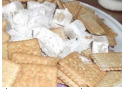
Fotoğraf 9: Konya İlinde Nişanlarda Tepsi İçinde Dağıtılan Lokum - Bisküvi ( http://www.anadolutelgraf.com/haber/Konya-bu-lezzeti-cok-seviyor/155121 , Erişim Tarihi: 21.04.2019).