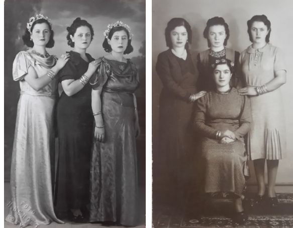
Fotoğraf 31 - 32: 1950 - 1959'lu Yıllara Ait Nişan Fotoğrafı.