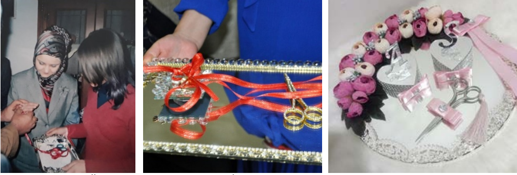
Fotoğraf 1: Dantel Örtülü Nişan Tepsisi. Fotoğraf 2: Muazzez Yiğit'e Ait Nişan Tepsisi. Fotoğraf 3: Pleksi Nişan Tepsisi.