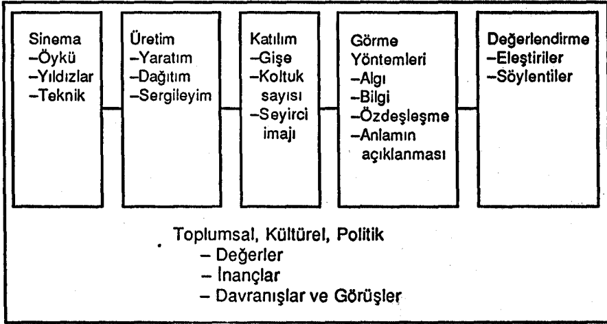
Şekil-2. Sinemanın Bir İletişim Süreci Olarak Modeli*

Sinema olgusu, ekonomik, toplumsal, ideolojik, psikolojik öğeleri ile çok boyutlu bir olgudur. Sinemanın ürünü olan film(ler) bu olgunun yalnızca bir parçasıdır. Yapımla ilgili sorunlar (dağıtım, mali kaynaklar vb.) gösterimle ilgili sorunlar (pazarlama, reklam), film şirketlerinin birbirleri ile sorunları, teknik elemanları ve tüm sinema çalışanlarını ilgilendiren sorunlar, senaryo yazımı, film oyuncularları, stüdyolar, sansür, sinemanın gereksinimi olan teknik malzemeler, film üzerine eleştiri ve söylentiler ve daha pek çok konu, bu geniş olgunun içinde yer almaktadır.