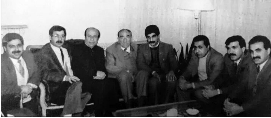
Fotoğraf: Alparslan Türkeş ve Irak Türkleri - Ankara (Türkeş'in sağ tarafında İzzettin Alparslan)

geçmemiştir. Türklüğün milli bekası için temel doktrin olarak inandığı Dokuz Işık'ı temsilen gül yaprağı olarak el işlemesine çizmesi ve evinin baş köşesinde bulundurması bunun en büyük işaretidir. 25