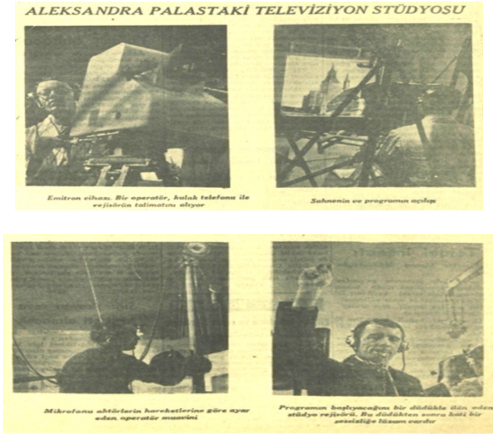
Resim 5. İngiltere'deki TV denemeleri (İngiltere'deki Televizyon, 9 Haziran 1938, s. 9).

Televizyon tekniği ve yayıncılığı alanında yaşanan tüm bu gelişmeler bu yıllarda Türkiye'de televizyona dair ciddi bir algı ve beklentinin oluşmasına yol açmıştır. Bunu 1935'te Bayındırlık Bakanlığı tarafından hazırlanan radyo kanun projesinde televizyona da yer verilmesinde açık bir biçimde görmek mümkündür. Bu, 3222 sayılı Telsiz Kanunu'dur. Kanun taslağına dair ilk haber 17 Ekim 1935'te Ulus gazetesinde karşımıza çıkmaktadır. Bu haberde, radyo kanun projesi ile yapılacak yeni düzenlemelere değinilirken, bunlar arasında televizyona dair ifadelerin olması dikkat çekicidir: "Elektrik dalgalarıyla olan her nevi resim, işaret, ses intişarını yaymağa ve almağa yarayan bila istisna her nevi telsiz tesisatı hükümetin inhisarı altına alınmaktadır. Umuma mahsus telsiz neşriyatı (Radyodifusion) ve televizyon tesisatının imtiyaz veya ruhsat şeklinde yapılması ve işletilmesi ulusal kurumlar veya yurddaşlara verilebilecektir" (s.5). Televizyon konusunda dünyada yaşanan gelişmelerin Türkiye'den yakından takip edilmesi tasarımı aşamasındaki kanunda bu cihaza yer verilmesini beraberinde getirmiştir denebilir. 2 Haziran 1937 tarihli meclis oturumuna gelen Telsiz Kanunu Layihasında televizyonun kuruluşuna dair bir düzenleme olması Ulus gazetesinde yayınlanan bu haberi teyit etmektedir. Tasarımın teklif edilen