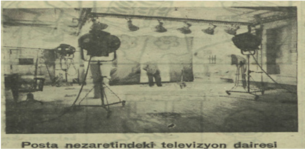
Resim 4. Fransa'daki TV denemeleri (Fransada Televizyon..., 10 Şubat 1936, s. 8).

Bu yıllarda televizyon faaliyetlerine dair fotoğrafların gazetelerde kendisine yer bulmaya başlaması da bu aracın giderek daha iyi bir biçimde anlamlandırılmasına aracılık etmiştir. Televizyon yayınlarının hazırlanışına dair ilk görüntüler Fransa'da gerçekleştirilen denemeler bağlamında yayımlanmıştır. Resim 4'te Akşam gazetesinde yer alan haberde stüdyoda gerçekleştirilen çekimlere dair bir fotoğraf yer almaktadır. Bu konuda fikir verici başka görseller ise 9 Haziran 1938 tarihli Ulus gazetesinde yayımlanmış İngiltere stüdyolarına ait fotoğraflardır. Resim 5'te yer alan bu fotoğraflar televizyon denemelerine dair daha ayrıntılı bilgiler aktarmaktadır.