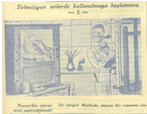
Resim 3. Kurun gazetesindeki TV karikatürleri (Televizyon Evlerde Kullanılmaya Başlanınca 5 Mayıs 1935, s. 1; 22 Mayıs 1935, s. 7).

5 Mayıs 1935 tarihli ilk karikatür televizyondaki frekansların karışma ihtimalini radyo