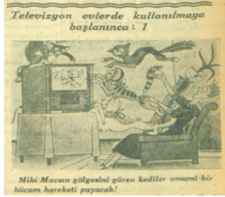
Resim 2. Kurun gazetesindeki televizyon fotoğrafları (Televizyon Evlerde Kullanılmaya Başlanınca, 1 Mayıs 1935, s. 1)

Kurun gazetesinin daha sonraki sayılarında da “televizyon evlerde kullanılmaya başlanınca” başlıklı karikatürler yayınlanmaya devam etmiştir. Resim 3'te yer alan bu karikatürler sırasıyla izlendiğinde televizyon konusunda yukarıda değinilen belirsizliklerin varlığını sürdürdüğü görülmektedir: