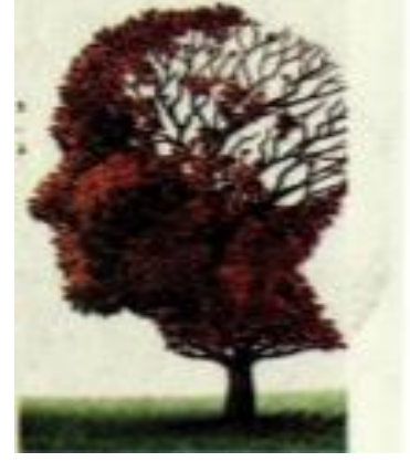
Şekil 4. Hürriyet Pazar/5.06.2016

Şekil 5 ve 6'da başını ellerinin içine almış kişiler ile hastalığın yarattığı olumsuz tabloya, Şekil 7 ve 8'de ise hastanın yakınlarının yanında başka bir yere odaklandığına, yakınlarından uzaklaştığına, onlarla iletişiminin koptuğuna işaret edilmektedir.