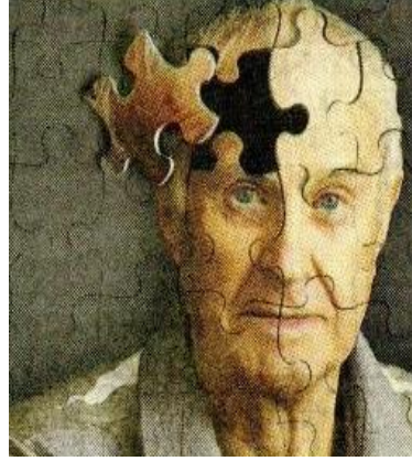
Şekil 3.