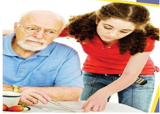
Şekil 8.

Tüm görsellerde dikkati çeken temel özellik yaşlı insanların ya da yaşlılığı simgeleyen baston (Şekil 9) gibi eşyaların kullanılması ve bu yolla yaşlılık ve Alzheimer arasında kurulan ilişkinin güçlendirilmesidir.