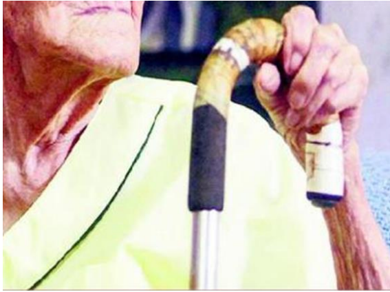
Şekil 9. Sabah/ 2.06.2016

Tüm görsellerde dikkati çeken temel özellik yaşlı insanların ya da yaşlılığı simgeleyen baston (Şekil 9) gibi eşyaların kullanılması ve bu yolla yaşlılık ve Alzheimer arasında kurulan ilişkinin güçlendirilmesidir.