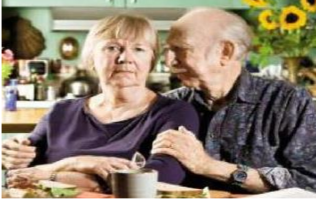
Şekil 7. Habertürk/18.03.2016