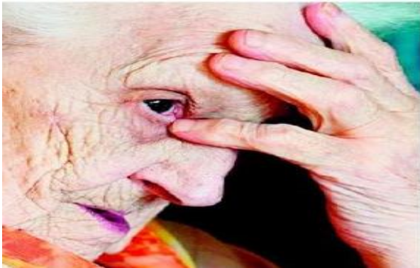
Şekil 5.

Şekil 5 ve 6'da başını ellerinin içine almış kişiler ile hastalığın yarattığı olumsuz tabloya, Şekil 7 ve 8'de ise hastanın yakınlarının yanında başka bir yere odaklandığına, yakınlarından uzaklaştığına, onlarla iletişiminin koptuğuna işaret edilmektedir.