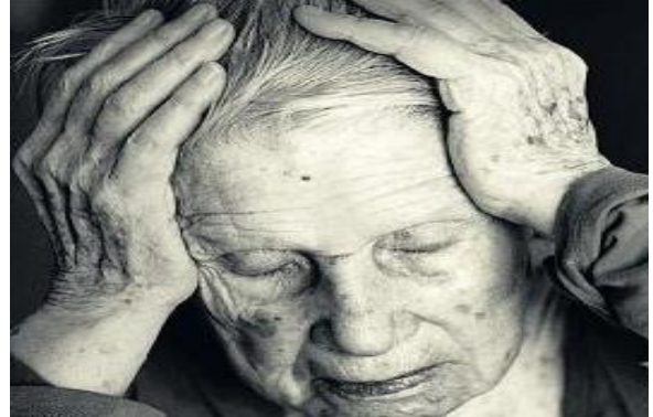
Şekil 6. Milliyet/23.02.2016