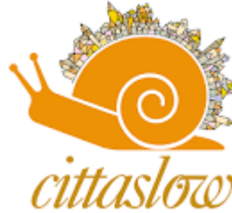
Şekil 1. Cittaslow Logosu