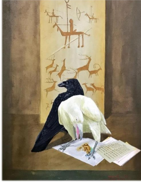
Resim 5: Serkan İlden, Bilgeler , T.Ü.A.B., 100 x 70 cm, 2019 ("Sanal", 2020).

olan ölü karga figürüdür. Bu resimde Anadolu insanının zorluklar altında ve yokluk içerisinde yetiştirmeye çalıştığı az miktardaki ekinine zarar veren karganın yağmacı özelliğine dikkat çekilmektedir.