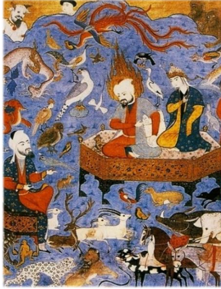
Resim 1: Hz. Süleyman ile Seba Melikesi Belkis ve Çevresi (Falname, TSM H. 1703) (And, 2015: 172).

bilen ve kuşların yöneticisi kutsal ruh olarak nitelendirilen Hz. Süleyman'la ilgili bir efsanenin işlendiği minyatürde karga figürüne de rastlanılmaktadır (Kaya, 2015: 133).