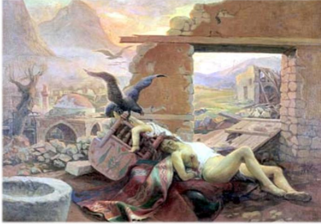
Resim 3: Hüseyin Avni Lifij, Karagün , T.Ü.Y.B., 93 x 118 cm, Ankara Resim ve Heykel Müzesi (Özel, 44).

Hüseyin Avni Lifij, Çağdaş Türk resim sanatının temelini oluşturan Çallı Kuşağı içerisinde izlenimci anlayışının yanı sıra şiire ve edebiyata olan tutkusu sayesinde romantik sezgisi ve içe dönük duygu anlatımlarıyla diğer sanatçılardan ayrılan önemli ressamlarımızdan birisi olarak bilinmektedir. Sanatçının simgeci bir anlayışla yaptığı lirik resimlerinde romantik bir ışık tercih ederek şiirsel bir hava oluşturduğu görülmektedir. Alegorik anlatımlı resimleri içerisinde tarihi bir konunun anlatıldığı Karagün (Resim 3) isimli eserinde karga ve kartal figürlerine de yer verdiği görülmektedir.