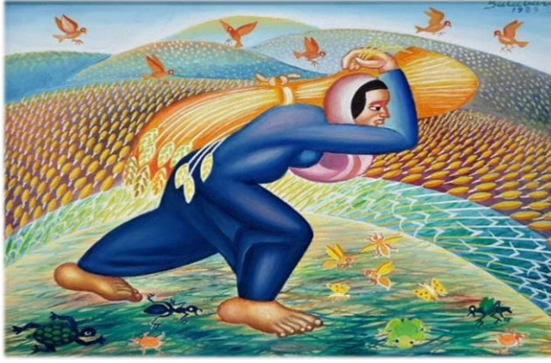
Resim 6: İbrahim Balaban, Bereket Ana , T.Ü.Y.B., 40x50 cm, 1989 ("Sanal", 2020).

İbrahim Balaban tarafından yapılan Bereket Ana (Resim 6) isimli resmin ön planında merkeze yerleştirilmiş, sırtında başak balyası taşıyan köylü bir kadın ile etrafında kaplumbağa, karınca, kurbağa, çekirge, kelebek gibi küçük canlılardan oluşan hayvan figürleri görülmektedir. Arka planda ise Anadolu'nun verimli topraklarıyla kaplı uçsuz bucaksız tepelerinde ekili tarlalar ve üzerlerinde beslenebilmek için oradan oraya uçan kargalar resmedilmiştir. Kompozisyonun merkezine yerleştirilmiş olan kadının diyagonal vücut hareketi, geri plandaki ekili tarlaların ritmik düzeni ve gökyüzündeki kargaların uçuşu esere oldukça hareketli, dinamik bir etki kazandırmaktadır. Ayrıca kıyafette tercih edilen mavi ve taşınan balyanın turuncu rengi ile tarladaki sarı ve mor rengin kontrastlığı eseri çarpıcı bir hale getirmektedir. İbrahim Balaban'ın diğer eserlerinde olduğu gibi burada da sırtında çocuğuyla çalışan anaların, ninelerin, genç kızların kısacası Anadolu kadının üretkenliği, emekçi yönü vurgulanırken, bir o kadar da zorlu yaşam mücadelesine dikkat çekilmektedir. Ayrıca resimde kaplumbağa ile dayanıklılığa, bilgeliğe, karınca ile çalışkanlığa, kelebek ile bir kadının hassasiyetine gönderme yapıldığı düşünülmekte olup, kargaların ise insanların ekip biçtiği tarla ürünlerine ortak çıkararak, zarar verme yönlerine dikkat çekilmektedir.