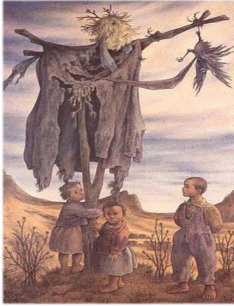
Resim 4: Neşet Günel, Korkuluk II , T.Ü.Y., 184 x 116 cm, 1986. ("Sanal", 2020)

Neşet Günel, eserlerinde Anadolu'nun çorak, bozkır coğrafyasıyla bütünleşmiş, kavruk yüzlü toprak insanlarının dramatik yaşantılarını toplumsal gerçekçi bir anlayışla gözler önüne seren önemli ustalardandır. Resimlerinde en temel unsur Anadolu insanı ve onun zorlu yaşam mücadelesidir. Büyük bir ustalıklarla biçim bozma yöntemiyle ele aldığı insanların abartılı elleri ve ayakları bu dramatik ifadeyi güçlü kılmakta ve izleyiciye tesirli bir şekilde yansıtmaktadır.