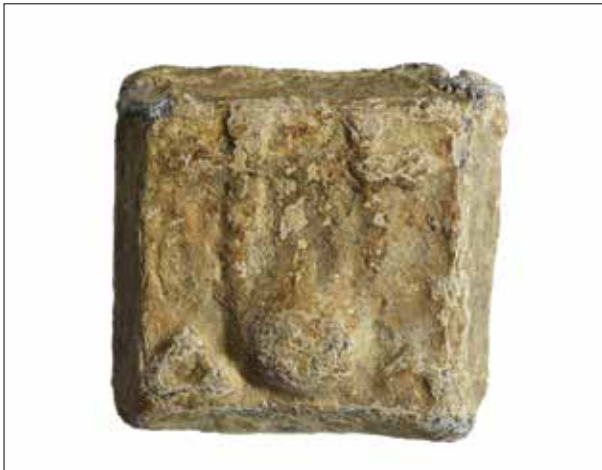
Fotoğraf 6: Kolophon'dan terazi ağırlığı. Selçuk Efes Müzesi / Balance weight from Colophon. Museum of Selçuk Efes

kent kazılarında bulunan ağırlıklara dair şu ifadeleri kullanmıştır: “Benzer buluntular kent akropolisinin çeşitli yerlerinde münferit olarak ele geçmiştir. Bu ağırlıklar daha geç olan binanın taban seviyesinin altından ve olasılıkla daha erken olan bir başka yapının üstünden bulunmuşlardır. Eğer bu buluntular daha erken yapının içinde kalmış olan kentin resmi ağırlık ve ölçülerine işaret ediyorsa, o zaman bu yapı ve onun ardılı, stoanın doğu bölümü, bir prytaneion olabilir ve güney duvarın karşısındaki temel, resmi ölçülerin depolandığı çevrili bölüm için yapılmış olabilir.” 48 Kolophon ağırlıklarının buluntu yerlerine ilişkin elimizdeki tek veri, Amerikan