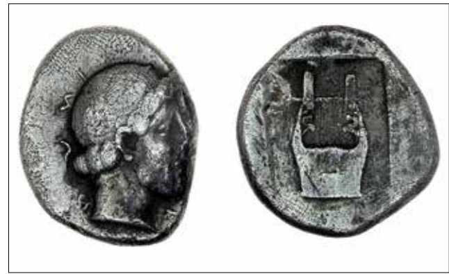
Fotoğraf 9: Kolophon sikkesi. (Milne 1941, no.14 / Coin of Colophon )

Sikke basımı konusunda Kolophon ve Deniz Kıyısındaki Kolophon (Notion) olarak iki topluluk arasında farklılık olduğu görüşü de mevcuttur. Buna göre; MÖ 4. yüzyıl ve MÖ 3. yüzyılın ikinci yarısındaki gümüş tetradrahmelerde iki arka yüz tipi mevcuttur. Biri at diğeri ise daha baskın olarak kitharadır. Dolayısıyla aynı etnik ismi kullanan