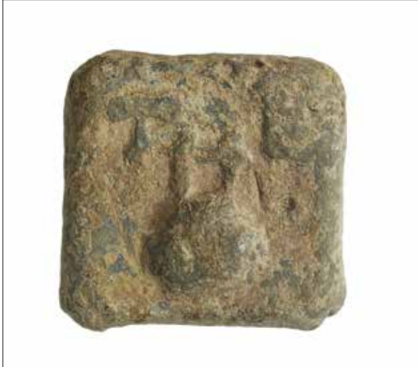
Fotoğraf 5: Kolophon'dan terazi ağırlığı. Selçuk Efes Müzesi / Balance weight from Colophon. Museum of Selçuk Efes