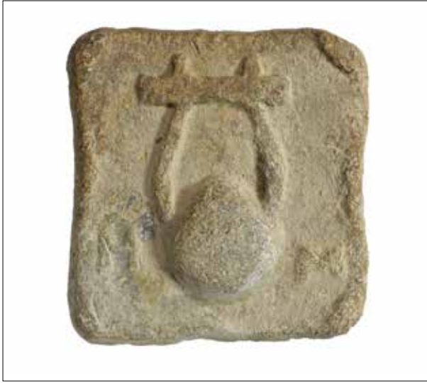
Fotoğraf 4: Kolophon'dan terazi ağırlığı. Selçuk Efes Müzesi / Balance weight from Colophon. Museum of Selçuk Efes