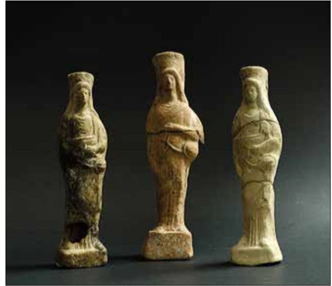
Fotoğraf 10: Klaros'tan lyra taşıyan figürinler. (Doğan Gürbüzler 2016, fig.15) / Terracotta figurines with lyre from Klaros.

Lyralı figürinlerin yanı sıra, Klaros kutsal alanında adak olarak bırakılmış lyraya ait birçok kaplumbağa kabuğu parçası ele geçmiştir 78 . Parçaların üzerindeki delikler söz konusu buluntuların lyranın ses kutusuna ait olduğunu gösterir. Parçalardan birinde telin bağlantı noktasına ait küçük bronz bir çivi yer almaktadır 79 . Ayrıca kutsal alanda Apollon'a adanmış yuvarlak sunağın batısında sunakla çağdaş olan (MÖ 7. yüzyıl) bir lyraya ait olabilecek bazı parçalar kemik parçaları ve olasılıkla testudo marginata