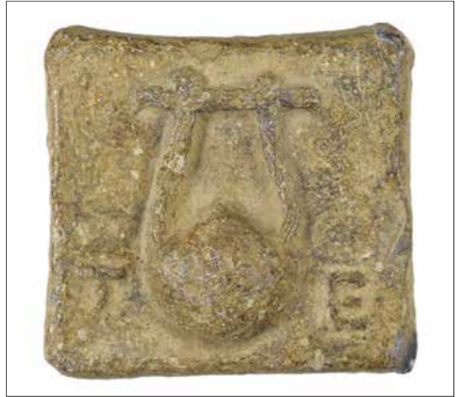
Fotoğraf 3: Kolophon'dan terazi ağırlığı. Selçuk Efes Müzesi / Balance weight from Colophon. Museum of Selçuk Efes