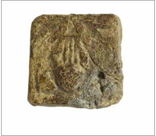
Fotoğraf 7: Kolophon'dan terazi ağırlığı. Selçuk Efes Müzesi / Balance weight from Colophon. Museum of Selçuk Efes