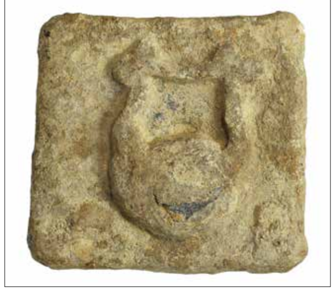
Fotoğraf 2: Kolophon'dan terazi ağırlığı. Selçuk Efes Müzesi / Balance weight from Colophon. Museum of Selçuk Efes

Kolophon kentinde yapılan Amerikan kazıları sırasında benzer ağırlıkların ele geçtiği bilinmektedir. Rapora göre kentsel bir işleve sahip olduğu düşünülen büyük bir yapının kuzey batısında üç adet kurşundan yapılmış kare şeklinde buluntular açığa çıkarılmıştır. Bunlardan birinde 0,07m. yükseklik ve 0,01m. kalınlığa sahip, bir yüzünde lyra kabartması ve altında M harfi; ikincide aynı forma