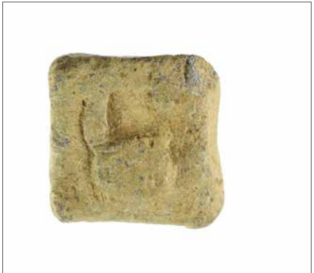
Fotoğraf 8: Kolophon'dan terazi ağırlığı. Selçuk Efes Müzesi / Balance weight from Colophon. Museum of Selçuk Efes