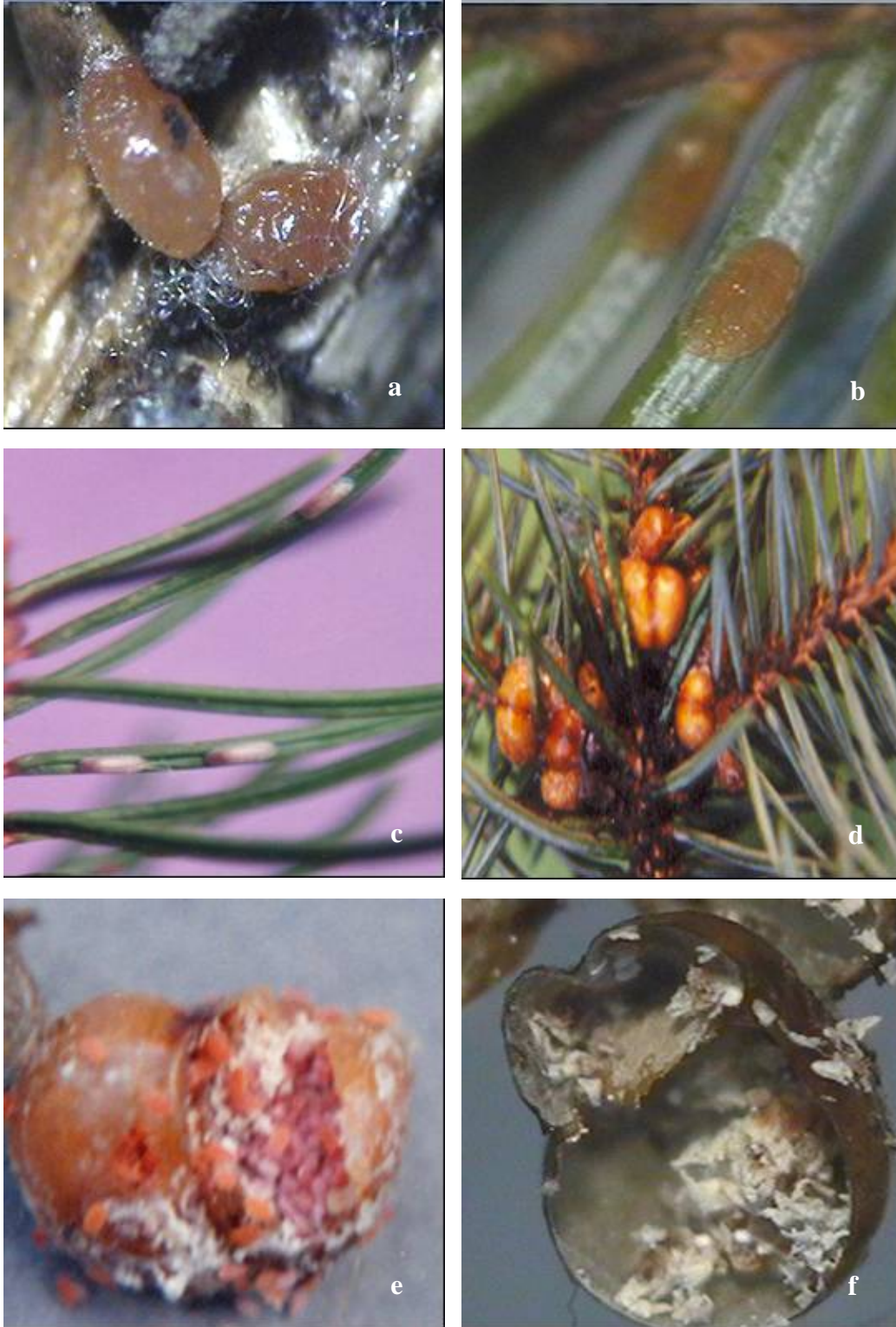
Şekil 2. Physokermes piceae 'nin II. dönem dişi (a), II. dönem erkek (b), pupa ( c), ergin dişi bireyleri(d), yumurtalı dişi (e), boş dişi vücudu ve yumurta kabukları (f)