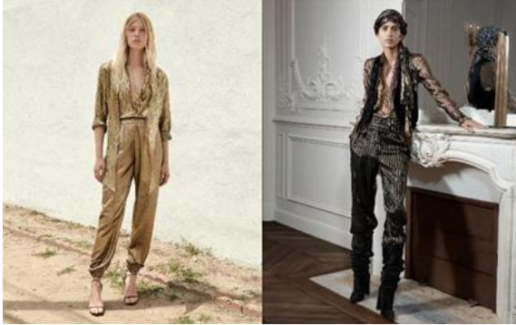
Resim 10. Yves Saint Laurent, 2020 [14] (Figure 10. Yves Saint Laurent, 2020 [14])

Yüzyıllarca Batı dünyasının büyük ilgisini çeken Doğu ülkeleri, modacılar da ilham kaynağı olmuştur. 20. yüzyılın ilk yarısının en önemli modacılarından olan ve Fransa'da "king of fashion" (modanın kralı) olarak adını moda dünyasına yazdıran Paul Poiret, 1900'lü yılların başlarından itibaren Doğu dünyasına ilgisini tasarımlarına taşıyarak göstermiştir. Onun Osmanlı harem giysilerinden esinlenerek hazırladığı koleksiyonlar içerisinde "Harem Pant" olarak adlandırdığı şalvarlar da yer almaktadır. Bu koleksiyon, Poiret'in anısına ithafen Haziran 2007'den itibaren New York Metropolitan Museum of Art'da izlenime açılmıştır [1].