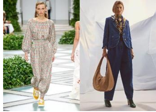
Resim 10. Torrey Burch, 2020 [12] (Figure 10. Torrey Burch, 2020 [12])