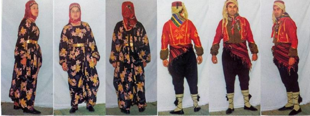
Resim 6. Konya yöresi kadın ve erkek şalvarı [4] (Figure 6. Konya region women's and men's shalwar [4])

İç Anadolu bölgesinin erkek şalvarlarının genellikle siyah renkte sayak kumaşından, dar kesimli ve kısa ağılı olanları dikkati çeker. Kadın şalvarları ise bileğe kadar olup, günlük kullanılan şalvarların pazen ya da basmadan, özel günlerde kullanılanların ise ipeklî kumaşlardan yapıldığı anlaşılmaktadır.