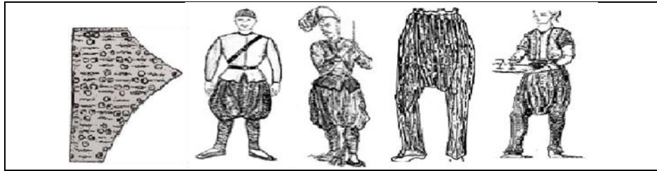
Şekil 2. Değişik şalvar örnekleri (Ayhan, Arşiv 2000)

(Image 1. Large Uighur and Central Asian Chinese type riding shalwar)