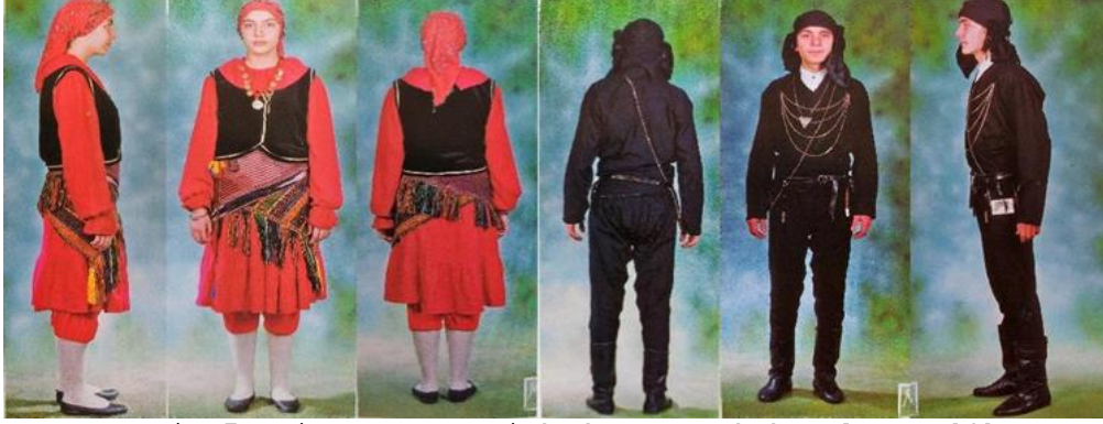
Resim 7. Giresun yöresi kadın ve erkek şalvarı [4] (Figure 7. Women's and men's shalwar in Giresun region [4])