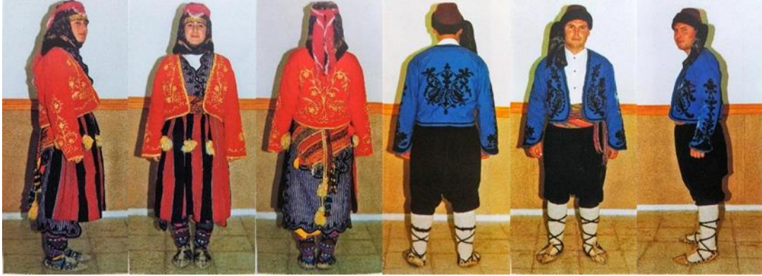
Resim 3. Antalya yöresi kadın ve erkek şalvarı [4] (Figure 3. Antalya region women's and men's shalwar [4])

Bu bölgede kadın şalvarları giyildiği yere göre değişmekle birlikte daha çok kırmızı sarı renklerde atlas ve satenden ya da basma ve yöresel kumaşlardan yapılmaktadır. Bölgede bol kesimli beli uçkurlu, boyu ayak bileği ile diz mesafesi arasında değişen şalvarları görmek mümkündür. Erkek şalvarlarında renkler genellikle siyah olup, gri renklerde şalvarlara da rastlanmaktadır. Çuha ya da dokuma bezlerden yapılan şalvarların dize kadar düşen bol ağırlı olanları yanında daha geniş ve bileğe doğru paçası dar alanları da vardır.