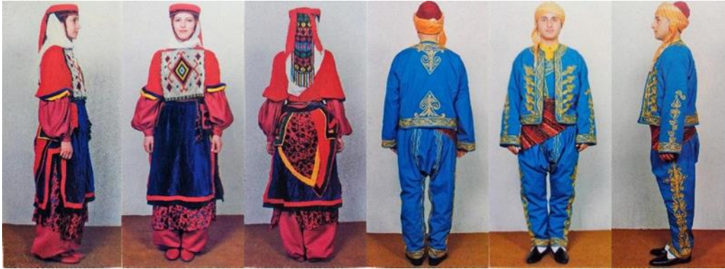
Resim 8. Kars yöresi kadın ve erkek şalvarı [4] (Figure 8. Kars region women's and men's shalwar [4])

Bu bölgede kadın şalvarlarının genellikle kırmızının tonlarında ipekli ve kadife kumaşlardan yapıldığı ve geniş ağırları ile bileğe kadar inen dökümlü parçaları dikkat çeker. Bununla birlikte erkek şalvarlarında oldukça çeşitlilik söz konusudur. Renkler maviden yeşile kırmızıdan siyaha değişim gösterirken yünlü kumaşların yanında kadife kumaşların da erkek giyiminde kullanıldığı görülmektedir. Bazı yörelerde neredeyse pantolona dönüşen kısa ağılı şalvarların yanı sıra, diz kapağının altına kadar inen şalvarlara da rastlanmaktadır. Bunun yanı sıra dizin üst bölümüne kadar daralarak sonrasında genişleyen bazı erkek şalvarlarında zengin işlemler de dikkat çekicidir.