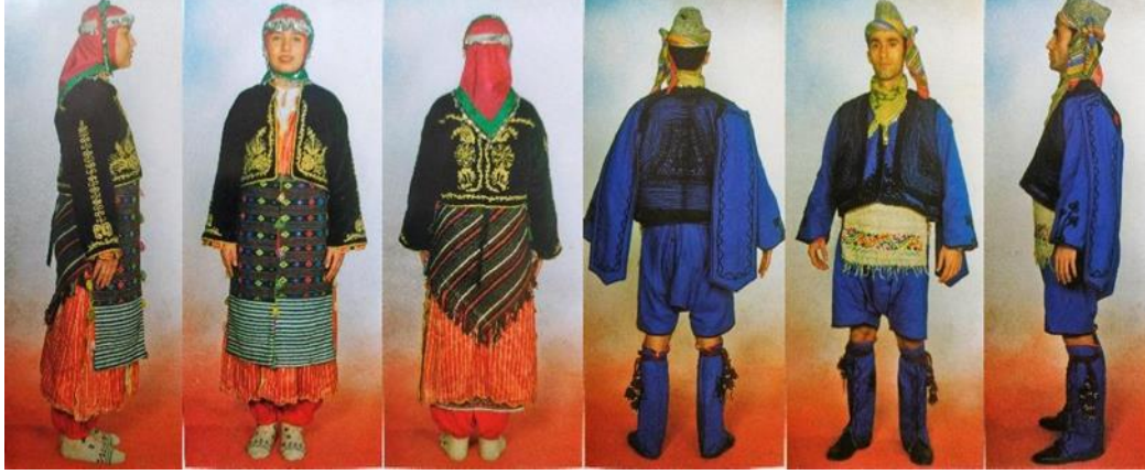
Resim 5. Balıkesir yöresi kadın ve erkek şalvarı [4] (Figure 5. Balıkesir region women's and men's shalwar [4])