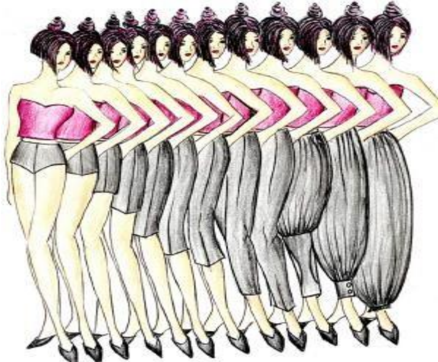
Şekil 3. Fatma Ayhan, Arşivi, 2000 [2] (Image 3. Fatma Ayhan, Archive 2000 [2])