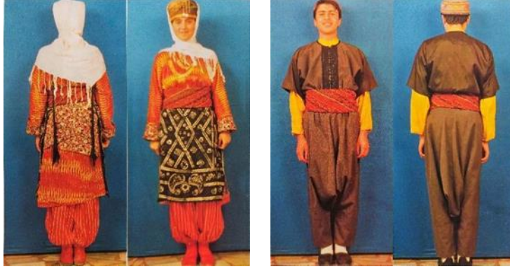
Resim 9. Adıyaman yöresi kadın ve erkek şalvarı [4] (Figure 9. Adıyaman region women's and men's shalwar [4])