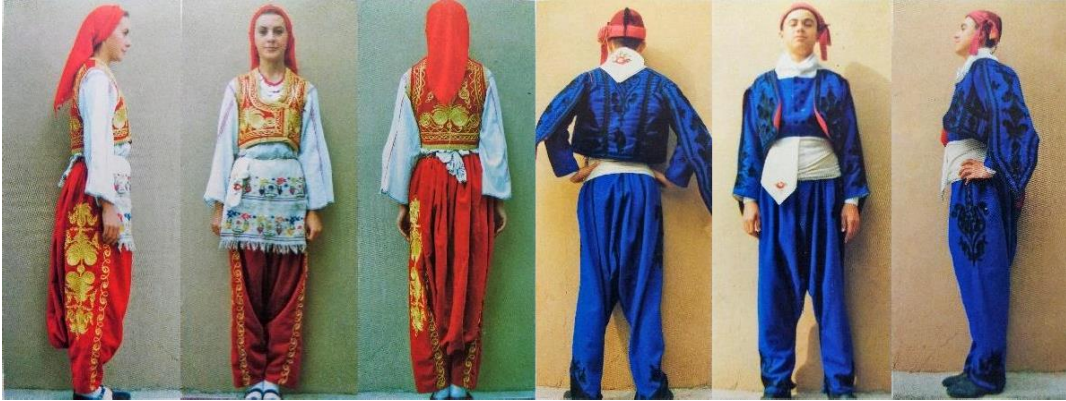
Resim 4. Edirne yöresi kadın ve erkek şalvarı [4] (Figure 4. Edirne region women's and men's shalwar [4])

Marmara bölgesinde giyilen şalvarların en belirgin özelliği erkek şalvarlarını tamamlayan tozluklardır. Hem erkek hem de kadın şalvarlarında kordon ve su taşı ile yapılmış süslemeler görülür. Kumaşlar genellikle yünlü pamuklu karışımdır.