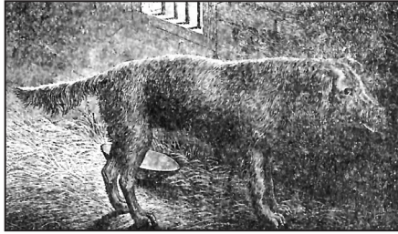
Resim-1: Kuduz Köpek (Nevsâl-i Afiyet, 3. Cilt)

Yarayı dağlamakla faide istihsal edilmesinde en birinci şart süratle hareket etmek ve hemen yarayı iyice ve derince dağlamanın çaresine bakmaktır. Bu vesaite müracaat edilmiş olur ve kuduz yarasına virüs ne kadar az girerse ileride icra edilecek aşı o kadar başarılı olur.