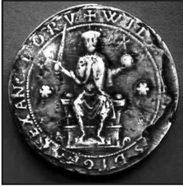
Resim-9: Kral 2. William (1087-1100)'in kullandığı ay-yıldız sembolü

İrlanda'da kaldığı dönemde sadece 19 yaşında olan genç Prens, daha sonra 1210 yılında Kral olarak hüküm sürdüğü sırada, İrlanda'ya yaptığı ikinci seferinde, idare ve hukukun temellerini attı. Prens John, 1185 yılının Aralık ayında İngiltere'ye döndü ve bu tarihte Hugh de Lacy, Drogheda kasaba-