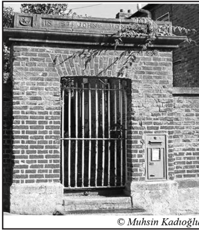
Resim-4: Drogheda kasabasında St. Jones Home üstündeki ay-yıldız

Drogheda'da St. Jones Home 'nin kapısının üstünde ay-yıldız sembolü vardır. St. John's Home iki binadan oluşur. Her bina, üç bölmelidir ve iki katlı iki ev içerir. Binalar, ortasında bir kapı yerleştirilen duvar ile birbirine bağlanmıştır. Daha önce " savaş dullarının yaşam alanı " 26 olan bina kapısının üzerinde ise sağa ve sola yerleştirilmiş ay-yıldız sembollerinin arasına " St. John's Home " yazısı yerleştirilmiştir. Binaların boş duvarları yarım ay şeklindeki pencerelerle ve derin olmayan alınlıkla süslenmiştir. 27 Archiseek sitesine göre, ay-yıldız sembolü bulunan St. John's Home , 1816 yılında inşa edilmiştir. Ancak, kapı ve üzerindeki ay-yıldız simgesinin de aynı tarihte inşa edildiğine dair bir bilgi yoktur.