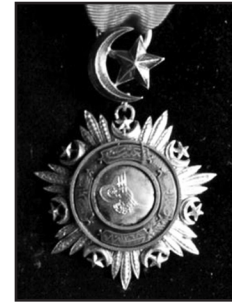
Resim-8: Sultan Abdülmecid nişanındaki ay-yıldız

St. John's Home'deki yıldız yedi köşelidir. Kral 2. William'a ait armadaki yıldız altı köşelidir. Buna karşılık, Drogheda armasındaki yıldız ise sekiz köşelidir. Drog-