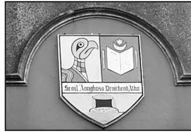
Resim-6: Drogheda kasabasında ay-yıldızlı arma taşıyan bir okul

Günümüzde Louth Golf Kulübü "Balt-ray" olarak biliniyor. 1892'de Messrs Pentland & Gilroy tarafından yapılan bir toplantı, kulübün resmi kuruluş tarihi olarak benimsenmiştir. 30 Kulübün resmi internet sitesinde, kulübün armasındaki sembollerle ilgili bilgi verilmemiştir.