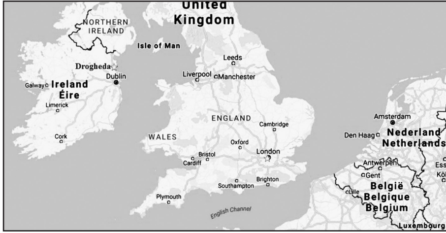
Harita-1: İrlanda ve Drogheda Kasabasının Konumu