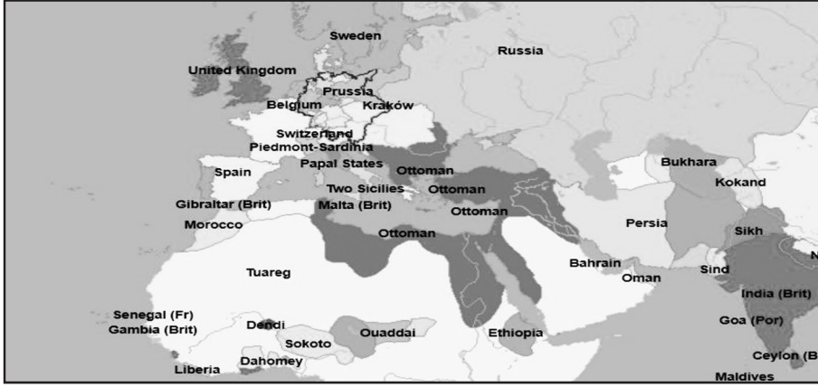
Harita-2: 1840 Yılında Osmanlı İmparatorluğu, Büyük Britanya ve Avrupa

rasında, hiçbir çıkarı olmamasına rağmen İrlanda'ya neden yardım yaptığını anlayabilmek için önemlidir.