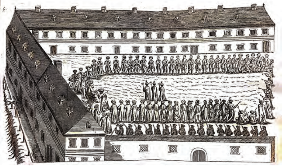
Ek VII: Zum Goldenen Lamm'da Mart 1700'deki bayram eğlencesini tasvir eden bir gravür

Schönwetter, Gründ- und umständlicher [...] , s. 77; Perger ve Petritsch, "Der Gasthof", s. 170.