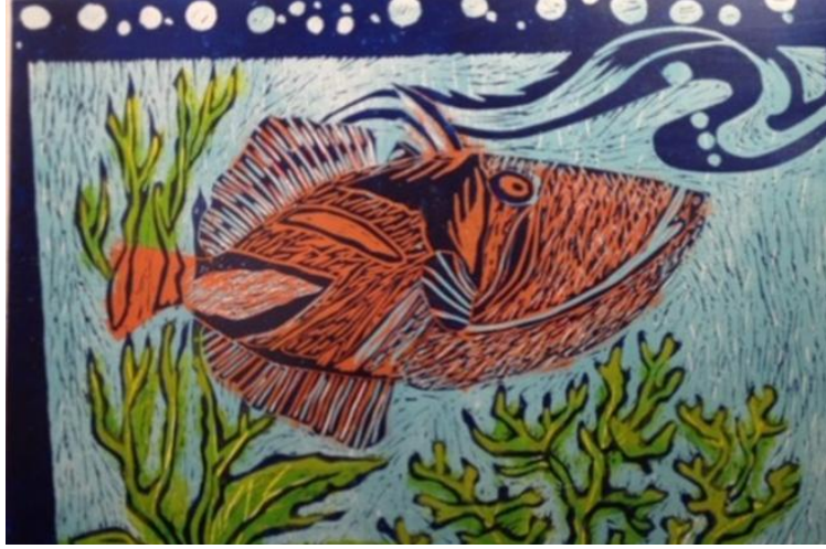
Resim 5. Gecenin Gözler, Linol Baskı, 50x70, 2012