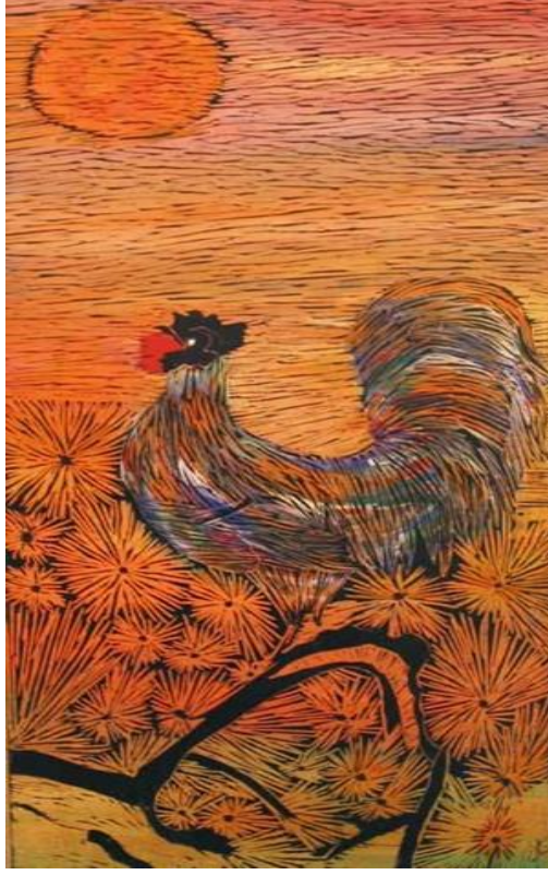
Resim 4. Senden Sonra, T.Ü. Akrilik Boya, 120x50, 2016

kullanılan kırmızı renklerle kadının toprağa kök salmış bir gücünün olduğu ve döl vererek yeşeren hayat ağacı figürüyle yaşamdaki zorlukların üstesinden yine kadının gücü sayesinde geleceğini bize anlatmak istemektedir. (Resim-3)