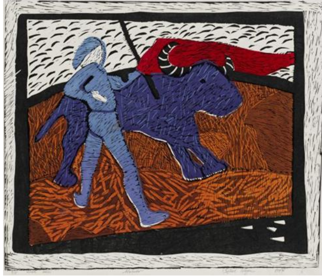
Resim 8. Matador, Linol Baskı, 3/5, 1997

ve berekete de gönderme yapılmıştır. Kadının sol elinin sol tarafı göstermesi de aslında olumsuzluklara karşı koruyucu bir niteliktedir. Arka plandaki kahverengi zemin, toprak ve dünya ile ilişkilendirilmiştir. Dünyanın üzüntülerine, kötülüklerine rağmen kadın bütün umudu ve gücüyle hayat vermeye devam edecektir. (Resim-7)