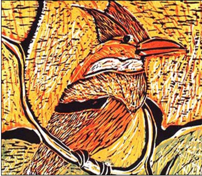
Resim 2. Yalı Çapkını, Linol Baskı, 1/8, 2005

Çalışmadaki kuşun kanatlarını açması ve genellikle sarı ve kahve tonlarında olması aynı zamanda o renklerin zeminde kullanılması aslında kuşun zeminle bir bütün olduğunu hissettirmektedir. Zeminde kullanılan siyah renkler Türk mitolojisinde keder, zekâ ve üzüntüyü simgelerken maviler ise huzuru sarı ve beyaz renkler ise huzurdan sonra gelecek tazeliği bize hissettirmektedir. Bu kuş sarı renk de resmedilirken aslında bilgeliği ve akılcılığı ile bütün olumsuzluklara karşı göğüs germekte olduğunu izlemeyi hissettirmektedir. (Resim-1)