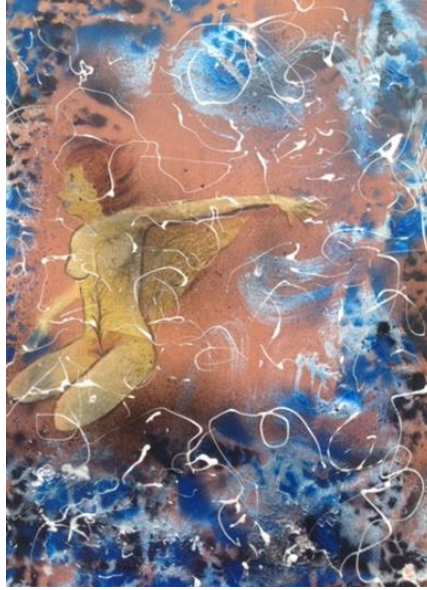
Resim 7. Hayalimde, T. Ü. Akrilik Boya, 60x80, 2017

Çalışmanın ortasında yer alan Türk mitolojisinde güzelliğin simgesi olarak bilinen tavus kuşu resmedilmiştir. Arka zemin rengârenk bir fonda yapılmış olup aslında hayatın bütün renklerini bize yansıtmaktadır. Resmin ortasındaki tavus kuşuyla kadın arasında bir ilişki kurulmuştur. Yaşamın insana getirebileceği olumlu ve olumsuz olaylar karşında ayakta kalabilen bir kadın gösterilmek istenmiştir. Tavus kuşunun kuyruklarını açarken yeniden yaşama dönmeye layık olan insanın tüm nitelikleri gözler önüne serilmiştir. Bu da tavus kuşundan dolayı ölümsüzlükle bağdaştırılmıştır. Resimde yer alan farklı boyuttaki dairesel siyah karamsar çizgiler, resmin merkezindeki kadının bütün olumsuzluklara karşı ayakta kalmayı başarmasıyla ilişkilendirilmek istenmiştir. (Resim-6)