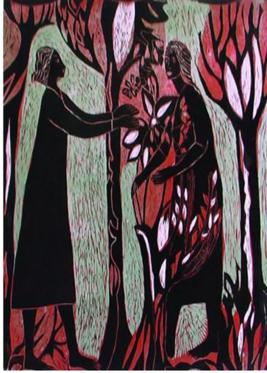
Resim 3. Yaşam Anahtarı, Linol Baskı, 60x60, 2007

bu kuşun dünyanın merkezinde ve dala tünemiş gibi gösterilmesi ile özgürlük ve sınırlılıklar arasındaki bir bağla ilişkilendirilmiştir. Kuşun başının sola bakmasıyla gelecek kötülüklerle karşı koruyucu olarak turuncu ve sarı renklerle güneş ve yeryüzü arasındaki dengeleyici unsura bir vurgu yapılmak istenmiştir. Ağacının kuru bir dalında yer alan bu kuş figüründeki açık sarı, beyaz renklerle resmedilirken sakinlik, temizlik ve saflık duyguları yansıtılmaya çalışılmıştır. (Resim-2)