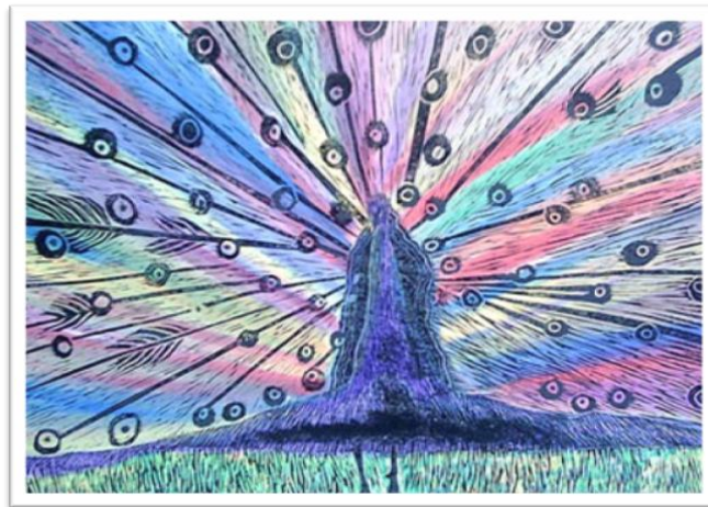
Resim 6. Tavus Kuşu, T. Ü. Akrilik, 110x80, 2000

Çalışmadaki turuncu balıkla yeryüzü mavi zeminle de gökyüzü simgelenmek istenmiştir. Yaratılış destanlarında yer alan balık figürünün aslında Türk Mitolojisinde bereketle ilişkilendirilmektedir. Hayatın döngüsünde balık gelecek içinde önemlidir. Balıkta kullanılan turuncu renkle insanın içinde yer alan enerji ve heyecanlarına bir gönderme yapılmak istenmiştir. Mavi renkle huzur ve mutluluk arasında bir bağlantı kurulmuş olup yeşil renkli yosunlarla insanın içinde yeşeren umutlar ve iyi duygular nefes olan baloncuklar gibi yeniden hayat bulacaktır. (Resim-5)