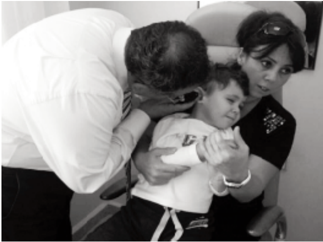
Şekil 2. Her iki kulağında orta kulak iltihabı olan çocuk kulaklarının otoskop ile muayenesi.

- Fizik Muayene: Aurikula ve preauriküler bölgenin inspeksiyonu, otoskopik muayene, aurikulanın traksiyonu veya tragusa bası ile ağrının artıp artmadığının kontrolü mutlaka yapılmalıdır. Kulak muayenesi normal ise temporomandibular eklem, burun, boğaz, boyun ve kranial sinir muayenesi ile devam edilmelidir (2) (Şekil 2).