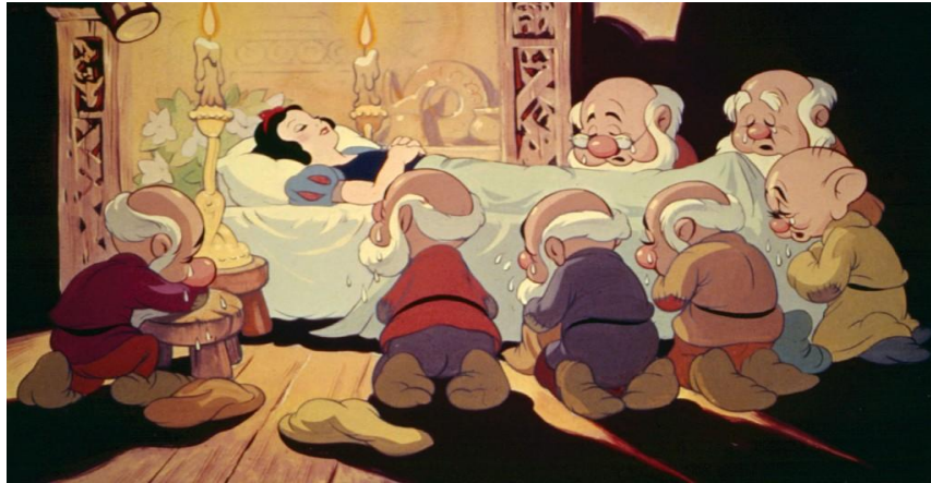
Resim 1. 1937, Snow White And The Seven Dwarfs (URL 1).

Canlandırma sanatı tarihinde önemli yer edinen, Amerikan halkı tarafından sevilen ve ülkesinin desteğini alarak dönemin canlandırma sanatındaki tek hâkimi olan Walt Disney, günümüzde de ortaya koyduğu canlandırma karakterleri tüm dünyada klasikleşerek aynı sevgi ile izlenmektedir (Dedeal, 1999: 14). Dünyanın ilk sesli canlandırma filmi (1928, Steamboat Willie), ilk renkli canlandırma filmleri (1932, Silly Symphony, Flowers&Tree) ve ilk uzun metrajlı canlandırma filmi (1937, Snow White and The Seven Dwarfs) (Resim 1.) Walt Disney'in kurduğu Disney Stüdyolarından çıkmıştır. 1928 yılından 1938 yılına kadar olan bu on yıllık süreçte canlandırma filmleri yeni bir olgunlaşma dönemine girerek, televizyon gelişimi ile sinemanın bir dalı olarak günümüze kadar gelişimini sağlamıştır (Kaba, 1994). Bu olgunlaşma dönemi içerisindeki yıllarda 'Micky Mouse', 'Donald Duck' gibi pek çok Walt Disney yapımı canlandırma film dizileri tüm dünya tarafından sevilerek izlendi (Halas, 1979).