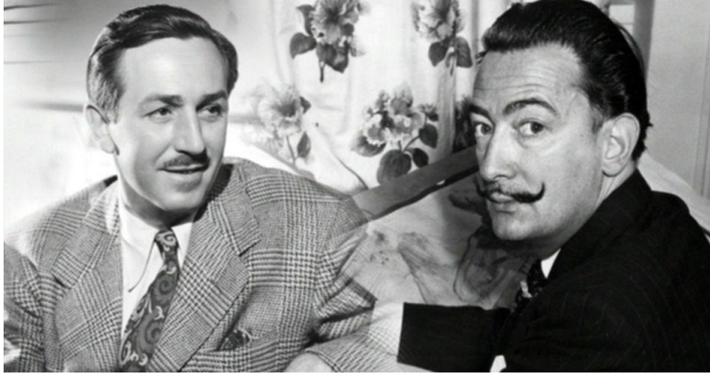
Resim 2. W. Disney ve S. Dali (URL 2).

sanatçılara yol gösterdi (Samancı, 2004: 37). Walt Disney'in ileri görüşlülüğü ile yıllar içinde yarattığı Disney markası günümüzde ulaştığı boyutta, her alanda görmek mümkündür (Resim 2.).