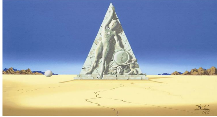
Resim 8. Destino canlandırma filminden bir sahne (Kaynak: Destino filminden).

zü tanrısı Uranos ve yeryüzü tanrısı Gaia'nın en küçük oğlu ve bir Titan olan Kronos, tanrı Hera, Demeter, Hades, Poseidon ve Zeus'un da babasıdır. Zamanı yaratması ve zamanlar arasında hareket edebilen, zamanın vücut bulmuş hali Kronos'un ölümlü bir kadına duyduğu aşkı ve ölümlü olma arzusunu gerçekleştirememesini Dalí'nin sürrealist manzaraları ile anlatan canlandırma filminin tamamlanması sırasında, Dalí'nin günlüklerinden ve eşi Gala ile olan ilişkilerinden yararlanır.