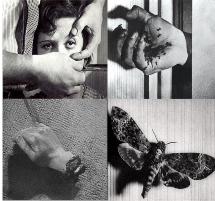
Resim 4. Salvador Dali ve Bunuel'in ortak yapımı olan 'Bir Endülüs Köpeği' filmi (URL 4).

Önceleri Kubizm ve Futürizm'den etkilenen Salvador Dali 1928 yılında İspanya'dan Paris'e giderek Sürrealist akımın önemli isimleri arasındaki yerini almıştır (Turani, 2011: 623). Dali 'Paranoiac Critical Method' adını verdiği otopsikanaliz yöntemi ile diğer Sürrealist sanatçılardan ayrılmıştır. Kendi düşlerine ve bilinçdışı arzularına gönderme yapan kişisel komplekslerini, şehvetli teşhirciliğini resimlerine konu eden sanatçı bu noktada diğer Sürrealist sanatçıların yanı sıra Freud tarafından da tepki görmüştür. 20. yy sanatı olarak ifade edilen ve çok sayıda sanat akımının ortaya çıktığı bu dönem, teknoloji ile ortaya çıkan yeni anlatım biçimleri ile film ve fotoğrafın da dâhil olduğu sanat dalları arasında disiplinler arası bir anlayış ortaya koymuştur (Beksaç, 2000:105). 1929 yılında Salvador Dali ve Bunuel'in ortak yapımı olan 'Bir Endülüs Köpeği' filmi (Resim 4.) Sürrealist sinemanın en önemli yapıtı olarak görülmektedir (Passeron, 1982). Canlandırma sanatı da tam bu noktada kendini göstermekten geri durmamıştır. Kimlik kazanması ise Walt Disney'le birlikte Amerika'da gerçekleşir.