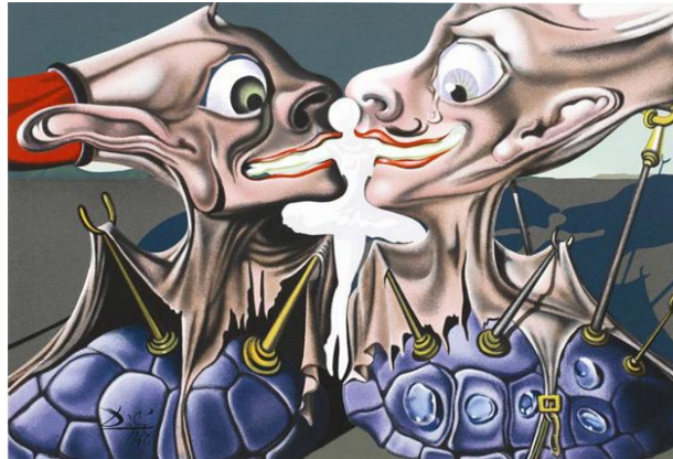
Resim 7. Destino canlandırma filminden bir sahne (Kaynak: Destino filminden).