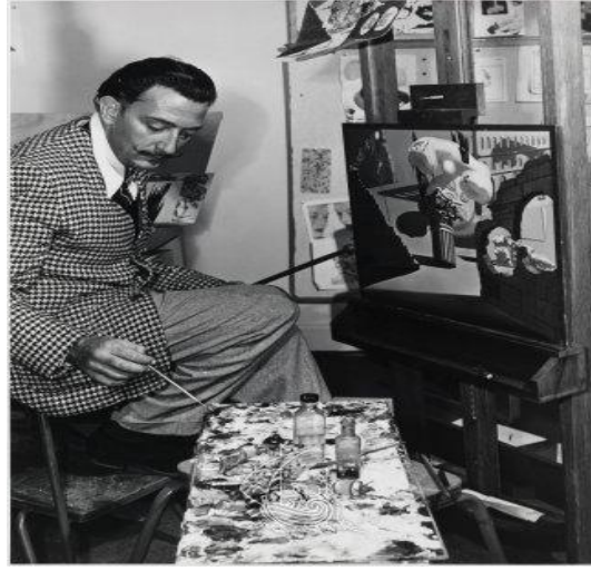
Resim 5. Salvador Dalí, Destino için yağlıboya çalışması (URL 5).

sonunda 17 saniyelik bir kısmı, yaklaşık 80 adet kalem ve mürekkep karalamalarını ve çok sayıda çizgi film, çizim ve tabloyu (Resim 5.) içererek tamamlanır.