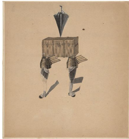
Resim 3. André Breton eserleri. The Egg in the Church, 1932 (sol), Figure, 1928 (sağ) (URL 3).

Bu tarihe kadar olan dönemde sanattaki dini anlatım sınırlılıklarının dışına çıkılmayan alegorik konular işlenirken; Tristan Tzara, Louis Aragon ve Paul Eluard'ın da André Breton'a