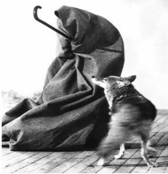
Resim 3. "I Like America and America Likes Me" (Kır Kurdu. Ameika'yı Severim Amerika da Beni Sever), Joseph Beuys, 23-25 Mayıs 1974, Performans- Kavramsal Sanat, Aksiyon yeri: Rene Block Galerisi, New York.

Beuys'un bu aksiyonu genel bağlamda Şamanist dünya ile benzerlikler göstermektedir. Beuys'un bu aksiyonunda, bir kır kurdu üzerinden, genel olarak hayvanların bütününe ruhsal varlıklarıyla, kendi ifadesiyle "bu yüksek varlıklarla ve doğal ruhlarla" iletişim kurmanın denemesini yapılmaktadır. Kır kurdu Kuzey Amerikalı Kızılderililerin edebiyatlarında bir çok hikayelerinde yer alır ve mitolojilerinde de önemli bir yere sahiptir. Beuys bu aksiyonunda insanları, onların altında ya da üstünde başka dünyalar olup olmadığını sormaları için özellikle provoke etmeyi amaçladığını söylemektedir.