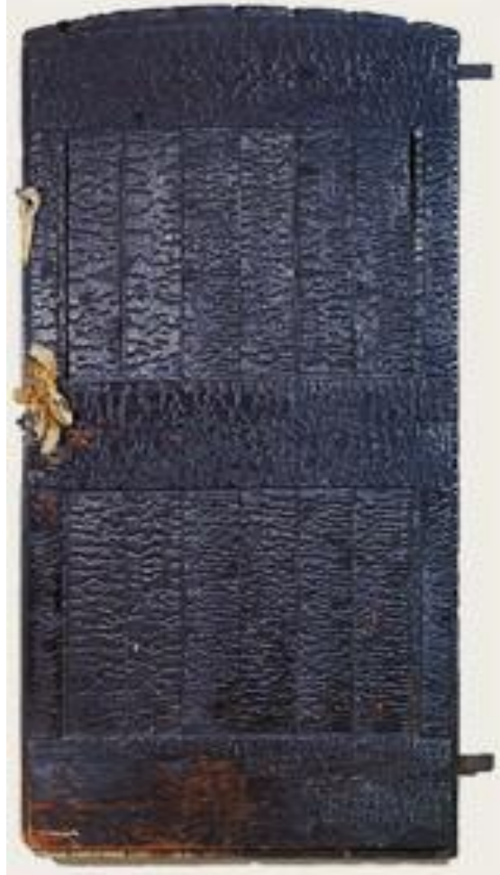
Resim 6. Yanmış Kapı, Tavşan Gagası ve Kulakları, Joseph Beuys, 1953, Yerleştirme- Kavramsal Sanat. (Yanma olayının simyevi dönüşüme olan göndermesi ve yeni bir olağanın sembolü olan kapıya bir gönderme söz konusudur)