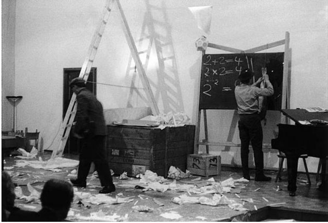
Resim 7. Sibirya Senfonisi, Birinci Bölüm, Joseph Beuys, 1963, Performans.

önemli bir sıçrama yapmıştır. Beuys, Naim June Paik ile düzenlediği Fluxus festivalinde "Sibirya Senfonisi" ile çarpıcı bir performans gerçekleştirmiştir.