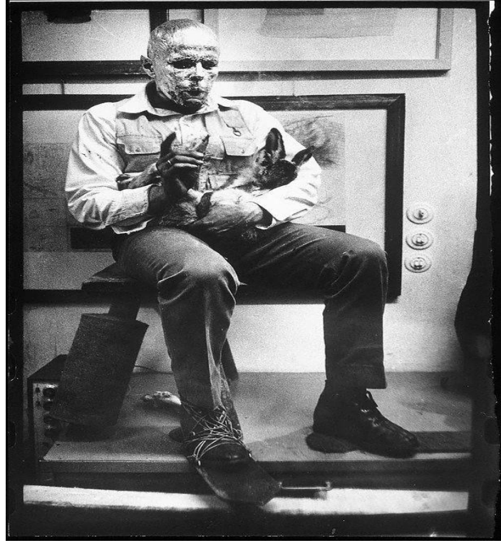
Resim 4. "Ölü Bir Tavşana Resimleri Nasıl Açıklamalı", Joseph Beuys, 1965, Performans- Kavramsal Sanat.

Beuys, bu aksiyonunda yüzünü bal ile kaplayıp, üstüne altın lifleri yerleştirerek bir çeşit maske oluşturmaktadır. Maske takmak şamanların hayvan-ruhlarıyla iletişim kurabilmek için kullandıkları bir teknik olarak bilinmektedir. Beuys, bu aksiyonunda ayağının altına metal bir plaka bağlayarak, galeri salonundaki hareketleri sırasında metalik sesler çıkarmaktadır. Böylece, hem kendi sesini hem de bu metalik sesleri işitsel eleman olarak kullanmıştır. Şamanik seanslarda mutlaka bulunan hareket elemanları da Beuys'un salonda gerçekleştirdiği hareketler olarak algılanabilmektedir.