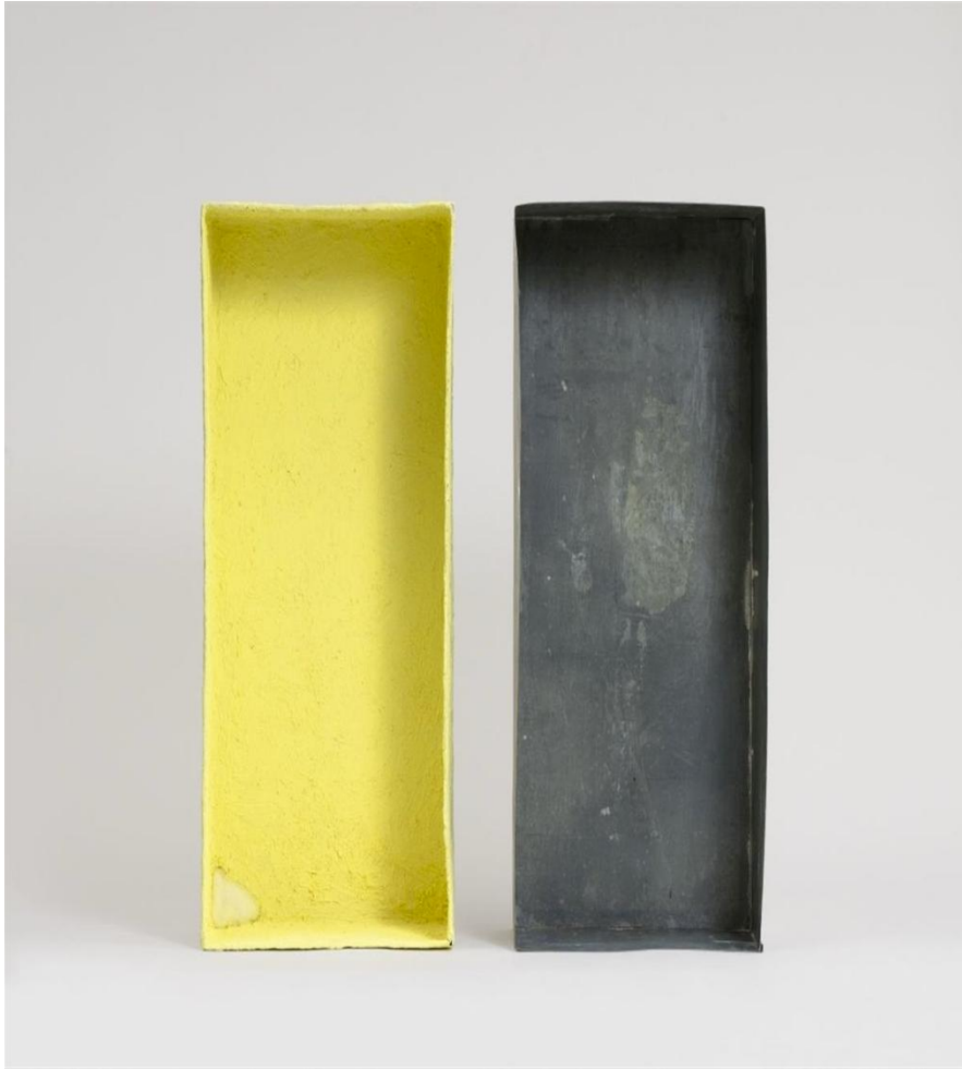
Resim 5. Kükürt Kaplı Çinko Kutu, Joseph Beuys, 1970, Yerleştirme- Kavramsal Sanat. (Kükürt simya geleneğinde manevi ateşin sembolüdür.)

Beuys'un sanatında simyanın izleri açık olarak 1954 sonrası bazı çalışmalarında görülebilmektedir.