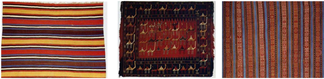
Resim 1: Palaz. 19. yy. Kailash Galerisi, Antwerpen.

19. yüzyılda Azerbaycan’da çok miktarda düz dokuma yaygılar, palaz (Resim 1), şedde (Resim 2), cecim (Resim 3) dokunmuştur. Düz dokuma yaygılar, halılara göre daha hafif ve ince olduğundan dolayı, onu genellikle göçebeler günlük yaşantılarında kullanmışlardır. Bu nedenle, genellikle dağ eteği bölgelerinde dokunmuştur (Güngör, 2007: 208).