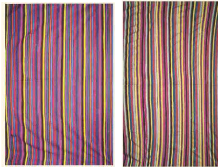
Resim 4: Nahçıvan'dan beş dar parçanın birleştiği cecim örnekleri Kaynak: (Muradov, 2013: 63)

12.-15. yüzyıllarda Azerbaycan'da mevcut olan zanaatlar içerisinde kumaş dokumacılığı, en çok gelişen zanaatlardan birisidir. Bu yüzyıllarda Azerbaycan'da bulunan yabancı seyyahlar, yerli halkın hem iç, hem de dış pazarlar için çok miktarda yüksek kaliteli ipekli, keten ve yünlü kumaşlar, halı, cecim (Azerbaycan'da cecim, özgü yüzlü bir dokuma türü olup, Türkiye'deki cecim dokumasından farklıdır) palaz vs. tekstil ürünleri dokuduklarını günlüklerinde belirtmişlerdir (Güngör, 2007: 173).