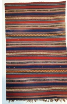
Resim 10: Çiyi palaz, Bakü 19.yy. sonu, malzeme: yün Kaynak: (Tağiyeva, 2015: 30, 31)