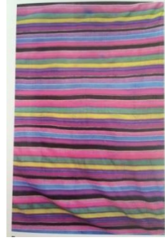
Resim 9: Palaz (Nahçıvan) Azerbaycan Halı Müzesi Kaynak: ( Muradov, 2013: 40,41)