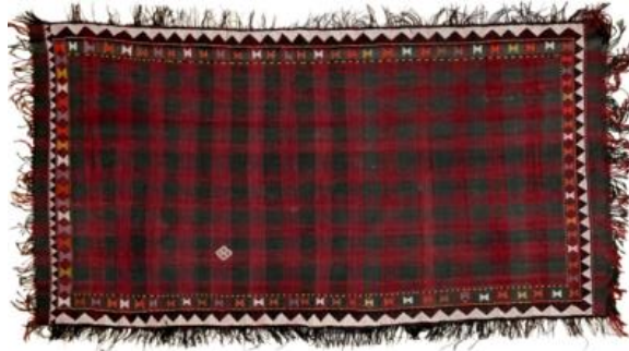
Resim 12: Şedde, yün iplikli, Karabağ, 20.yy ortaları, 136 x 267cm, Azerbaycan Halı Müzesi

"Orta Çağ'da kareli desen ipek kumaşlara ve düz dokuma (palaz) üsulu ile yünden dokunan ince halılara da "şetrenci" denilirdi ...Şeddelerin başlıca üretim merkezleri Garabağ (Gubadlı, Cebayıl, Ağdam, Berde), Gazah, Nahçıvan, Güney Azerbaycan (Erdebil, Meşgin, Muğan) ve Göyçe'dir (Tahirov, 2012:33).