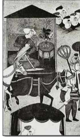
Resim 1. Cilt Yapmakta Olan Bir Sanatkarın Minyatürü, Levni, XVIII. yüzyıl.

Cilt sanatçıları tezhip, nakış, hat gibi sanatlarda da ustalaşmışlardır. Bu hem bazı ciltlerdeki mücellit ve müzehhip imzalarının aynı olmasından hem de Esnaf-ı Nakkaşan ve Esnaf-ı Mücellidan'ın bir arada anılmasından anlaşılmaktadır.