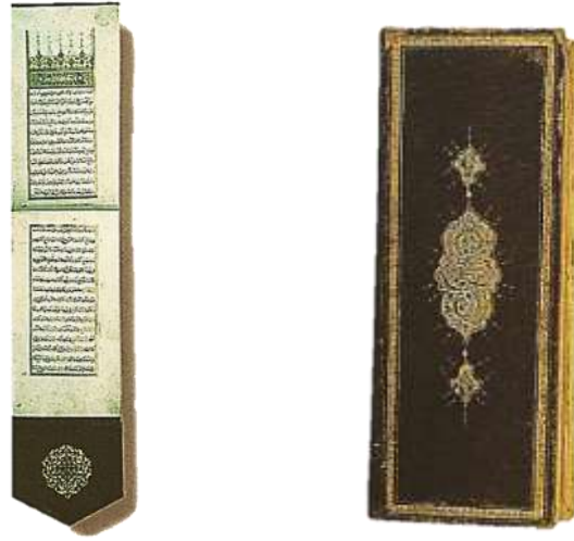
Resim 4.(sol) Sığır Dili (Sefinekâri) Cilt, Mesalihü'l-ebdan, Belhî, Ayasofya No.3740.

Eski yazma kitapların, uzunlamasına ve küçük olarak ciltlenmiş olanlarına “kümmî” adı verilmiştir. Eskiden âlimler bu kitapları yenlerinde kolayca taşıyabilmek için böyle ciltletmişlerdir. Bir de sırt boyu uzun, eni çok kısa tutulmuş olan ciltler vardır. Ancak bunların adı tam olarak bilinmemektedir. Bu diklemesine uzun ciltlere örnek, Süleymaniye kütüphanesi Şehid Ali Paşa 1887 numarada kayıtlı, Katip Çelebi'nin müellif hattı, Süllemü'l-vusûl ila tabakati'l-fuhûl adlı eseridir (Esiner Özen, 1998, s.11).