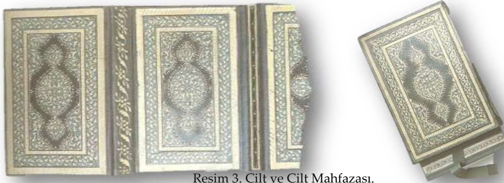
Resim 3. Cilt ve Cilt Mahfazası.

Ciltleri korumak amacıyla, bazen düz bazen de içine konulacak ciltle aynı biçimde süslenmiş kitap mahfazaları yapılmıştır. Bu, kitabın içine, dikine konulduğu bir kutu biçimindedir. Geniş yan kapaklardan birinin ortasına, 1-1.5 cm eninde deri veya ucuna deri yapıştırılmış bir şerit dikilmiştir. Kitap, bu şerit ile yapıştırıldığı kapak arasına oturtularak zahmetsizce mahfazaya yerleştirilip, dışarı çıkarılabilmektedir.