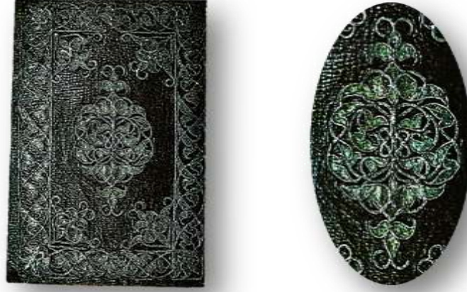
Resim 29 Simdûzî Cilt, Süleymaniye Kütüphanesi, Lala İsmail 300, 1000-1050 Yılları Osmanlı Tarihi.

İşlemeli Ciltler; deri üzerine, kalıplayarak veya fırçayla boyayarak süslemeler yapıldığı gibi, bir kumaş gibi işlenerek de hazırlanan ciltlerdir. Bu işlemler altın, gümüş veya ipek iplikle yapılmıştır. Gümüşle yapılan işlemeli ciltlere “simduzî cilt” adı verilir. Süleymaniye Kütüphanesi Lala İsmail 300 numarada kayıtlı 1000-1050 Yılları Osmanlı Tarihi adlı kitabın kapakları, kahverengi deri üstüne gümüş telle işlenmiştir. Bu simduzî cilt kapağında salbek, şemse ve köşebentler rûmî motiflerle süslenmiş, çevredeki yekpare su ise üç iplik rûmîlerle, köşelerde alt ve üst sıra ortasında buna uygun, çiçeğe benzer motiflerden oluşmuştur.