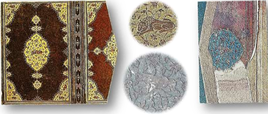
Resim 9. (sol) Süleymaniye Kütüphanesi, Laleli 1679. Sadî, Bostan.

Ciltlerde hayvan resimleri, alt ve üst kapakta, şemse ve köşebentlerde, bazen de miklep-te görülebilmektedir. Daha çok cildin dış yüzeyinde kabartma motif halindedir. Süleymaniye Kütüphanesi, Ayasofya 4221 numaralı eserde miklep içinde, katı'a şemse içinde hayvan motifi görülmektedir. Ciltlerde daha çok geyik, ceylan, kurt, tilki, aslan, maymun, tavşan, leylek ve çeşitli kuşlar resmedilmiştir. Süleymaniye Kütüphanesi Laleli 1679 nolu eserde de hayvan resmi, dış kapak üzerinde yer almaktadır (Esiner Özen, 1998, s.21).