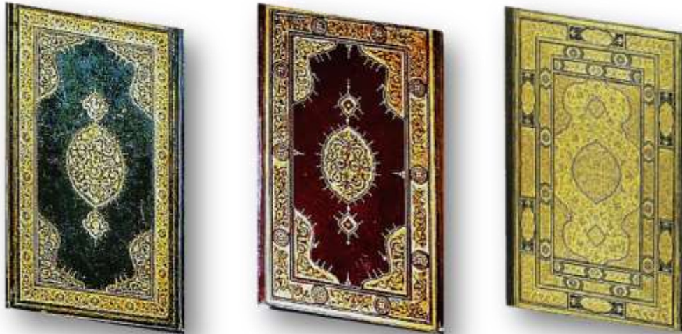
Resim 6. (sol) Üstten Ayırma Şemse, Ayasofya No.3972, Muradî Divanı XVI. yy.

Parçalı olmayıp, bütün meşin üstüne yapılan şemseye "yekpare şemse", etrafı zincir şeklinde bordürlü olana "zincirli şemse", kapakların mukavvası oyulup içine kabartma olarak oturtulana "gömme şemse" denilmektedir. "Mülemma şemse"de motifin hem zemini hem de kendisi altın yaldızla işlenmekte; "mülevven şemse" de ise tek renk deri kullanılmayıp, bezemeler cilt kapağından farklı renkte deri ile kaplanmaktadır. Bu şekilde renkli derilerle yapılan şemse ciltte de diğer şemse ciltlerde olduğu gibi, motifleri üstten veya alttan ayırma tarzında altınla bezemek mümkündür. Motif kalıbın zemini altınla doldurularak, motifler kabartma şeklinde üstte ve deri renginde bırakıldığında "alttan ayırma şemse", zemin olduğu gibi bırakılıp yalnız motifler altınlandığında ise "üstten ayırma şemse" denilmektedir (Esiner Özen, 1998, s.15).