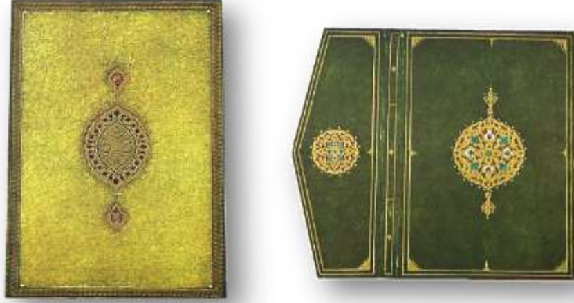
Resim 22. (sol) TSM Emanet Hazinesi Kütüphanesi, No. 2324.

köşe mavi, yeşil zeminli daha büyük bir yıldız görülmektedir. Salbekler altınla yapılmıştır. Köşebentler altınla ve üçgen şeklinde “geçme” olup bu üçgenlerin kaidelerinde altışar adet “tığ” bulunmaktadır (Çığ, 1971, s.28).