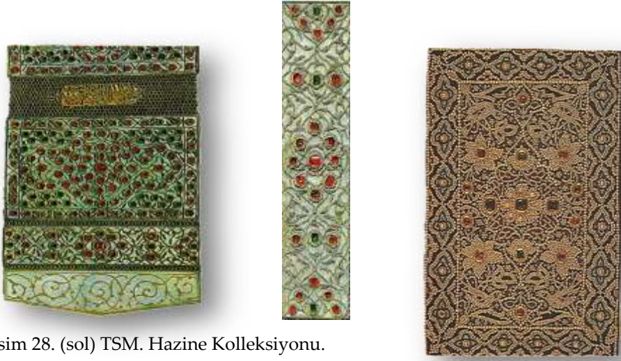
Resim 28. (sol) TSM. Hazine Koleksiyonu.

Murassa Ciltler; kıymetli taşlarla bezenmiş eserlerdir. Fildişi, sedef, firuze, mine, mercan, yakut, zümrüt, inci ve elmas süslemeli olanları bulunmaktadır. İstanbul Üniversitesi Kütüphanesi Nadir Eserler A.Y. 6553 numaralı Kur'an, 1830'da Muhammed Şirazi hattıyla istinsah edilmiştir ve murassa bir cilt içindedir. İnci, yakut ve zümrütlerle süslenildiği görülmektedir.