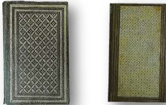
Resim 17 (sol). Süleymaniye Kütüphanesi, Esad Efendi 2676. Galib Dede Divanı.

Zilbahar Ciltler; üzerine ezme altınla, fırça kullanılarak geometrik çizgiler çizilmiş, kesişen hatlar arasında yıldız ve noktalar konulmuş ciltlerdir. Kafes'de denmektedir. Süsleme kapağın ortasında bir dikdörtgen alanı veya kapağın bütün yüzünü kaplar. 19. yy'da çok rastlanan bu ciltlerden biri Süleymaniye Kütüphanesi Esad Efendi 2676 numaralı eserdir. Altın yerine boya kullanılmıştır. Üç zencirek ortasında, krem rengi lake üzerine kırmızı boyayla zilbahar cildir. Kafes süslemesi bazen altın çizgilerle, bazen süslemeli eğrilerle, bazen de sazyolu yapraklarla yapılmıştır. Süleymaniye Kütüphanesi Nuri Arselez 314 numarada kayıtlı, 1855 tarihli Kur'an'ın cildi, cedveli çift zencirek, içinde sazyolu yapraklarla kafeslenmiş, ortalarına dörder altın nokta konulmuştur.