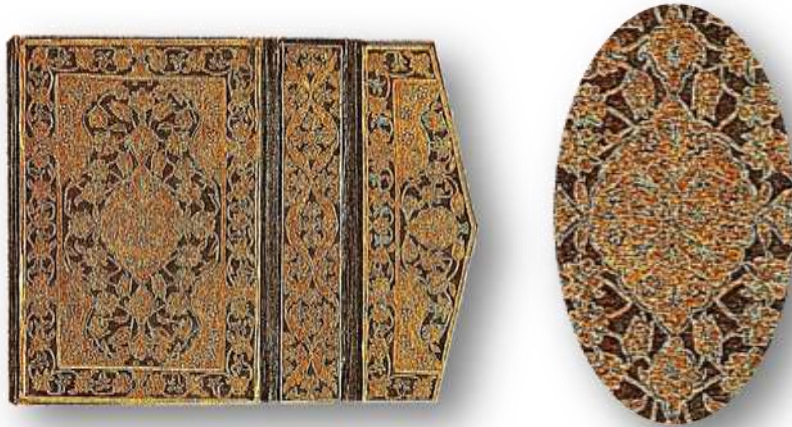
Resim 20. Zerdûzî Cilt, İ.Ü. Kütüphanesi, A.Y. 6570. Kur’an, XVI. yy.

Deri üzerine altın yaldızlı sırma ile işlenmiş ciltler, özellikle Topkapı Sarayı Müzesi Kütüphanesi ile İstanbul Üniversitesi Kütüphanesi Nadir Eserler Bölümünde bulunmaktadır. Bunlara altın işlemeli olmalarından dolayı “zerdûzî cilt” denilmektedir. İstanbul Üniversitesi Kütüphanesi Nadir Eserler Bölümü A.Y. 6570 numarada kayıtlı, 16. yy’da istinsah edilmiş Kur’an-ı Kerim miklebi ve sertabı da altınla işlemeli zerdûzî ciltlidir (Esiner Özen, 1998, s.22).