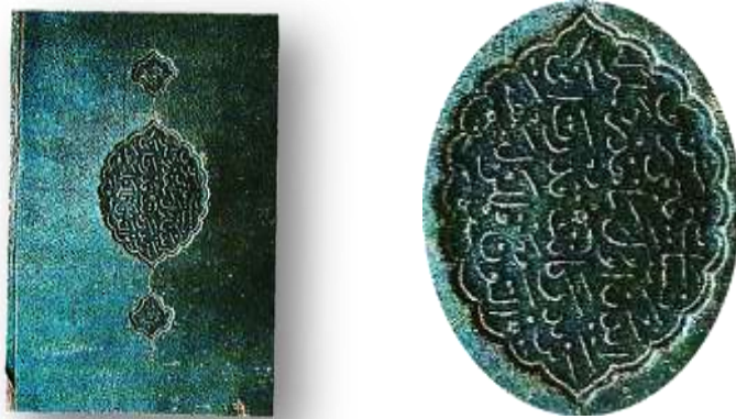
Resim 14 . Süleymaniye Kütüphanesi, Fatih 1648. Molla Hüsrev b. Feramuz, Dürerü'l-Hükkam, 1068/1653.

Yazıdır Kâtib-i Kudret anı altın kalemlerle”