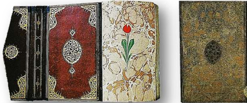
Resim 26. (sol) Süleymaniye Kütüphanesi, Fatih 3874. Muradî Divanı.

Ebru Ciltler; ebru sanatının alt ve üst kapakla, miklep üzerinde kullanıldığı ciltlerdir. Bununla beraber ebru sanatının, her dönemde pek çok cildin iç kapağında ve yan kağıdında da kullanıldığı görülmektedir. Yan kağıdı iç kapakla kapak arasında yer alan boş kâğıdın olduğu bölümdür.