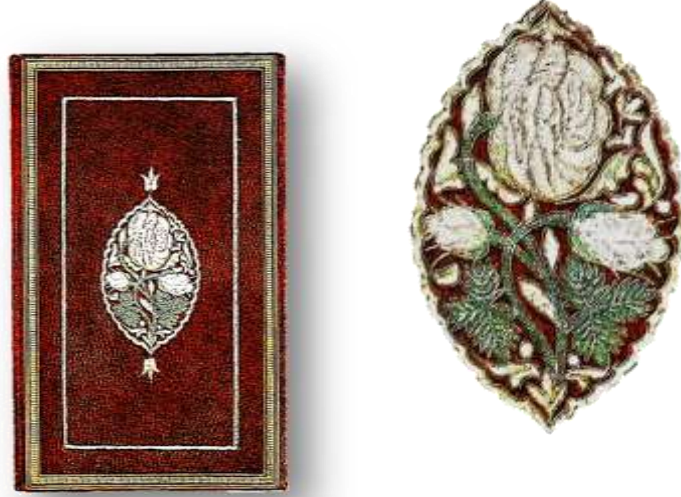
Resim 21. TSM Revan Kütüphanesi, No. 426, Şerh al-Tarikat al-Ahmediye, 1708.

İşlemeli ciltlere güzel bir örnek eser de, Topkapı Sarayı Müzesi Revan Kütüphanesi 426 numaradaki Şerk al-Tarikat al-Ahmediye adlı 1708 tarihli kitabın kabıdır. İnce mukavvaya kaplanmış kahverengi deridir. Dış kenar cetveli altın yıldız zencirek hat, iç kenar cetveli beyaz sırma ile işlenmiştir. Şemsesi yeşil, sarı ve pembe renk sırma ile işlenmiş realist gül, gül goncası ve yaprakları taşıyan bir dal motifini içerir. Salbekler, sarı sırma ile işlenmiş birer lale motifidir (Çığ, 1971, s.53).