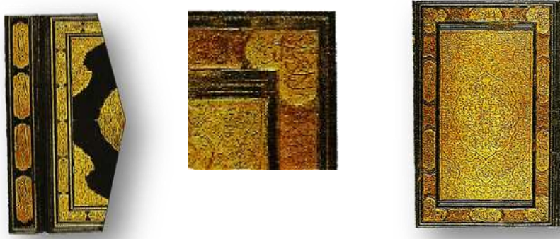
Resim 15 (sol). Süleymaniye Kütüphanesi, Fatih 4284, el- Bel'amî, Terceme-i Tarih-i Taberi.

Kitabesi yazılı Kur'an ciltlerinin çok güzel örnekleri Süleymaniye Kütüphanesi Sultannahmet koleksiyonunda görülmektedir. Deri üstüne sıvama altın süslemeli 14 numaralı Kur'an'ın kitabelerinde ayetler yazılı bulunmaktadır.