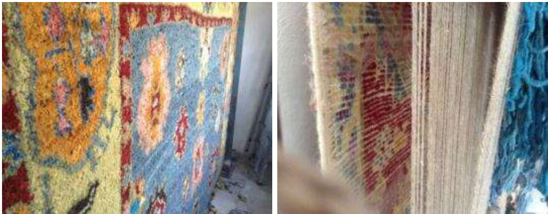
Resim 3:Havlar arasında iki atkı sırası kullanılan sık yapılı Karapınar ilme tülü örneği ve tersinin görüntüsü

Sarılar Halıcılık'ın üretim ve satış merkezi Aksaray'ın Sultanhanı beldesindedir. Firma Karapınar ilmeli tülüsü üretimine odaklanmıştır. Halının kabası olan bu tür tülülerde havlar arası atkı sıraları dokumanın görüntüsüne göre 2-8 atkı arasında değişmektedir. (Resim 3), (Resim 4)