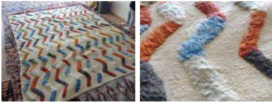
Resim 7: Dokumanın genelini zemindeki düz dokumaların oluşturduğu tasarım ve detayı

Bölgede hala kök boya, cehri (acı çehre, cihri), söğdek, yarpuz otu, sütleğen, ceviz kabuğu gibi coğrafyada bulunan bitkilerle doğal boyama yapılabilmektedir. Ayrıca günümüz koşullarında rekabeti yükseltmek için bilinenden farklı denemeler yapılmaktadır. Örneğin; hav ve zemin oranları değiştirilerek zemindeki düz dokumalarının yüksek oranda gösterildiği tasarımlar yapılmıştır. (Resim 7) Ya da havları yumuşatmaya ve parlatmaya yönelik farklı yıkama denemeleri yapılmıştır. (Resim 8)