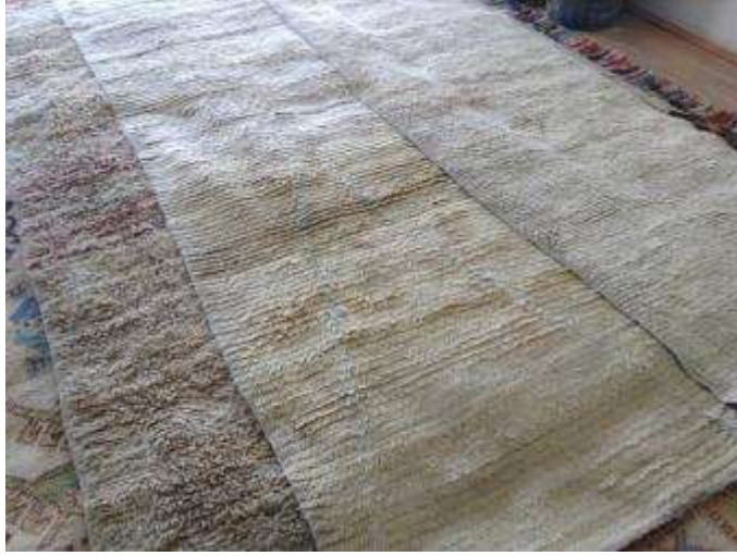
Resim 8:Yıkama denemeleriyle tiftik gibi parlak görünüm verilmiş Karapınar ilmeli tülü örnekleri