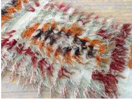
Resim 2: Yaklaşık 70 yıllık olan Sarılar Halıcık'a ait filikli örneği

Sarı'nın ve dokuyucuların verdiği bilgilere göre; filiklinin dokunması diğer tülülere kıyasla zahmetlidir. Lifin pulcuk yapısından dolayı tiftik lifleri dokuma anında ellere batarak zarar verir ve kesilmesi oldukça zordur. Bu tür zorluklara rağmen üretim yapabileceklerini fakat müşteri sıkıntısı çekildiği iletilmiştir. Filikli için müşteri bulunamamasının en önemli nedeni tiftiğin yüksek maliyetli olması ve bunun satış fiyatlarına yansımadır. Tiftik kullanılarak 10 cm'de 35 sıklıkla dokunan son filiklinin metrekare satış fiyatı 700 Dolar olarak belirlenmiş fakat alıcı bulunamamıştır. Sarı, ellerinde kalan birkaç eski filikliyi örnek olarak saklamaktadır. (Resim 2)