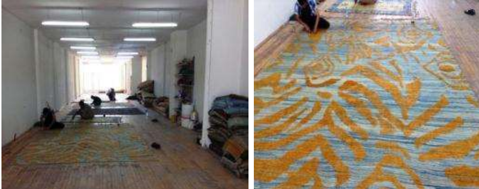
Resim 5: Sultanhanı'ndaki Sarılar Halıcılık'a ait atölyeden görünüm

Sultanhanı'ndaki atölyede (Resim 5) dokuma, eskitme ve yıkama sonrası düzeltme işlemleri, depolama ve satış yapılmaktadır. Dokumaların hav iplikleri Aksaray'daki iplikçiler tarafından kabaca eğrilmektedir. Yünler buldukları coğrafyanın ırkı olan Karaman koyunlarından elde edilmektedir.