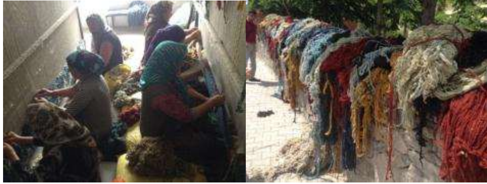
Resim 1: Emirgazi Halı-Kilim Dokumacılık ve Onarım Kursu atölyesinden ve kullandıkları ip-liklerden görüntüler

Kursta sadece Karapınar ilmeli tülüsü dokunmaktadır. (Resim 1) Eğitici Atan'la ve dokumacı kadınlarla yapılan görüşme de filikli ve çeki tülü dokumaların talep olmadığı için üretilmediği bilgisi verilmiştir.