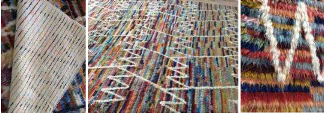
Resim 6: Sekiz atkı aralığıyla dokunmuş, yıkanarak eğrilmiş iplikleri açılmış Karapınar ilmeli tülü örneği

Sarı'nın verdiği bilgilere göre; geçmiş yıllarda Karapınar ve çevresinde benzer işleri yapan çok sayıda üretici varken günümüzde 3-4 firma kalmıştır. Bu firmaların hepsi zor durumdadır. Çünkü Pakistan, Çin, İran gibi el dokumacılığı ve tamir işlerini çok uygun fiyatlara yapan ülkelerle rekabet edilememektedir.