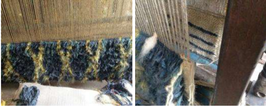
Resim 4:Havlar arasında sekiz atkı sırası kullanılan kaba yapılı Karapınar ilme tülü ve tersinin görüntüsü

Sultanhanı'ndaki atölyede (Resim 5) dokuma, eskitme ve yıkama sonrası düzeltme işlemleri, depolama ve satış yapılmaktadır. Dokumaların hav iplikleri Aksaray'daki iplikçiler tarafından kabaca eğrilmektedir. Yünler buldukları coğrafyanın ırkı olan Karaman koyunlarından elde edilmektedir.