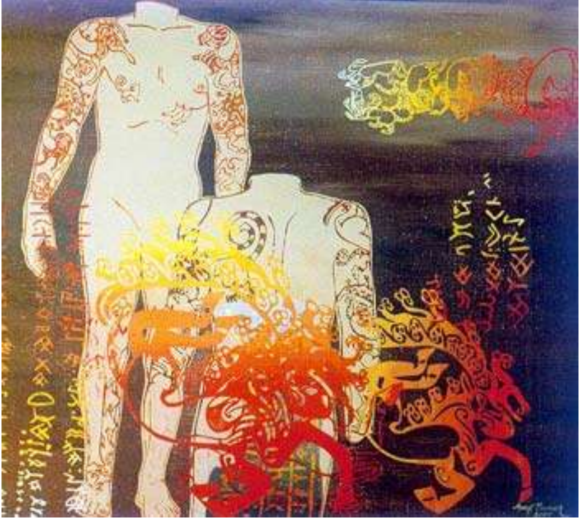
RESİM 5-ORHUN SERİSİ, 90*90CM, TUVAL ÜZERİNE KARIŞIK TEKNİK, 2000