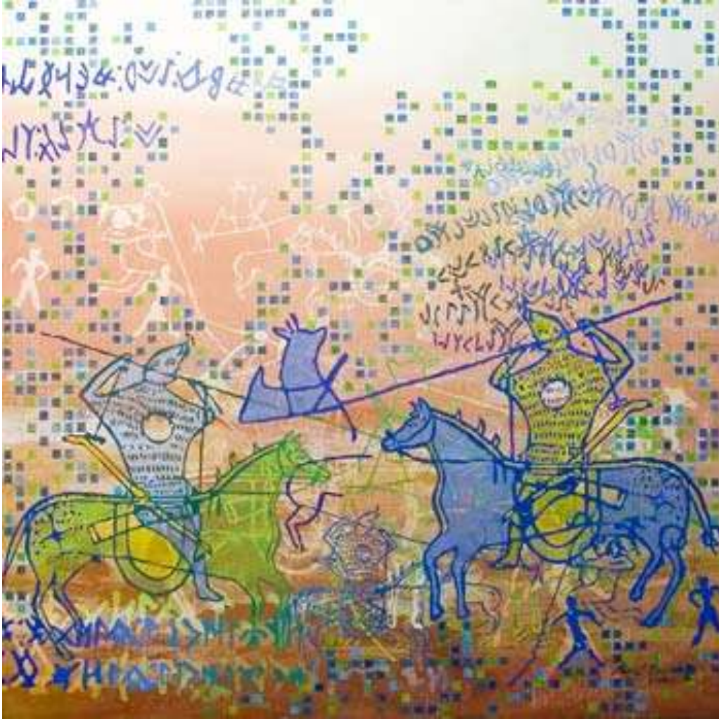
RESİM 6-ORHUN SERİSİ, 90*90CM, TUVAL ÜZERİNE KARIŞIK TEKNİK, 2000