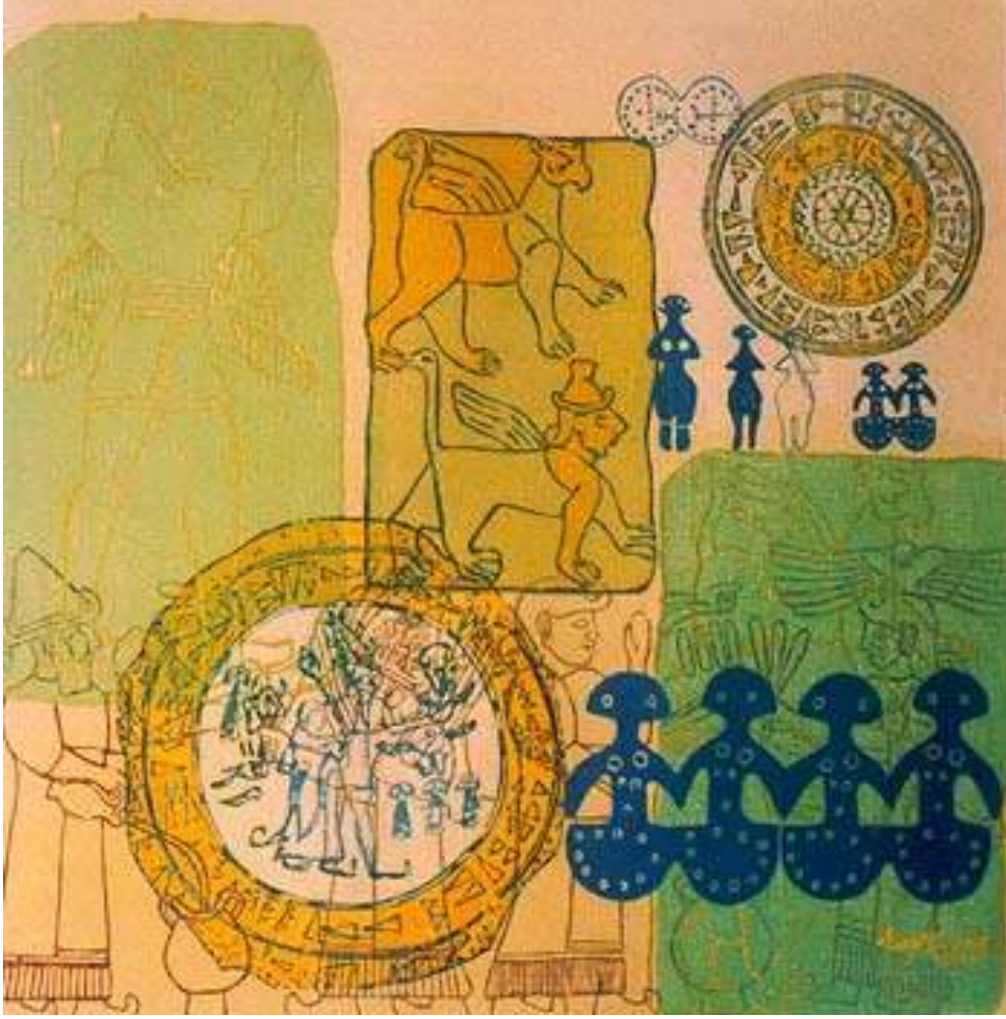
RESİM 2-Folklorik Resim Serisi, 90*90CM, TUVAL ÜZERİNE AKRİLİK BOYA TEKNİĞİ, 2000 ESER ANALİZİ;

Eserde bej renk üzerinde turuncu, mavi, yeşil renkler ağırlıklı olarak kullanılmıştır. Resimde sanatçımız kare formlu tuval tercih etmiş olup tuval içerisinde de dikdörtgenler ve daireler ile bütünlüğü sağlamıştır. Ayrıca yer yer kabartma ve damgaları üst üste getirerek bu bütünlüğü pekiştirmiştir. Sanatçımızın eserinin diğer bir özelliği ise Orta Asya ve Anadolu'da var olan günümüze kadar varlığını sürdüren figüratif kabartmalarla damgaları *etlektik bir şekilde başarı ile birleştirerek kompozisyonunu tamamlamıştır. (Resim -2)