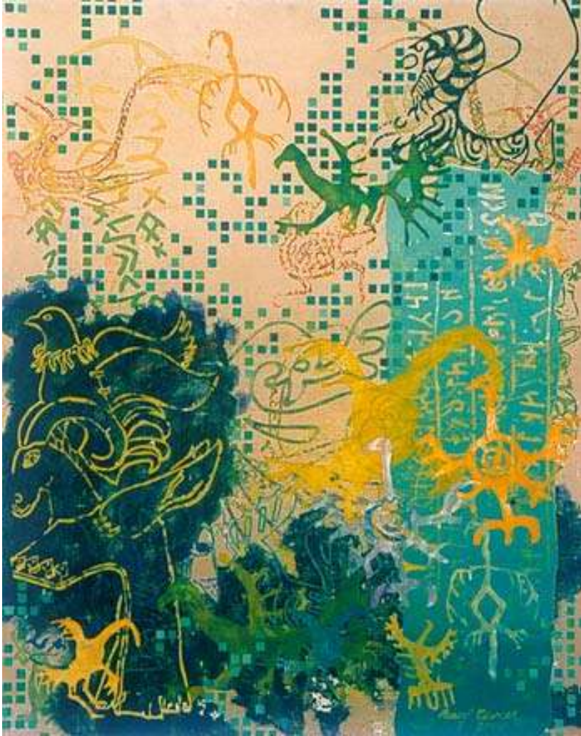
RESİM 1 - ORHUN SERİSİ, 70*90CM, TUVAL ÜZERİNE KARIŞIK TEKNİK, 2000

BEYAZ: Beyaz rengin genelinde çeşitli mitoloji ve kültürlerden doğan en genel anlamları aydınlık, ışık, güneş, hava, saflık, temizlik, iffet, masumiyet, sadelik, mükemmellik, kutsallık, kurtuluş, ruhsal yetkinliktir. Beyaz bir elbisenin giyilmesi, saflık, temizlik ve iffete işaret ettiği kadar ruhun beden üzerindeki zaferini de gösterir.(Çoruhlu,2011,215)