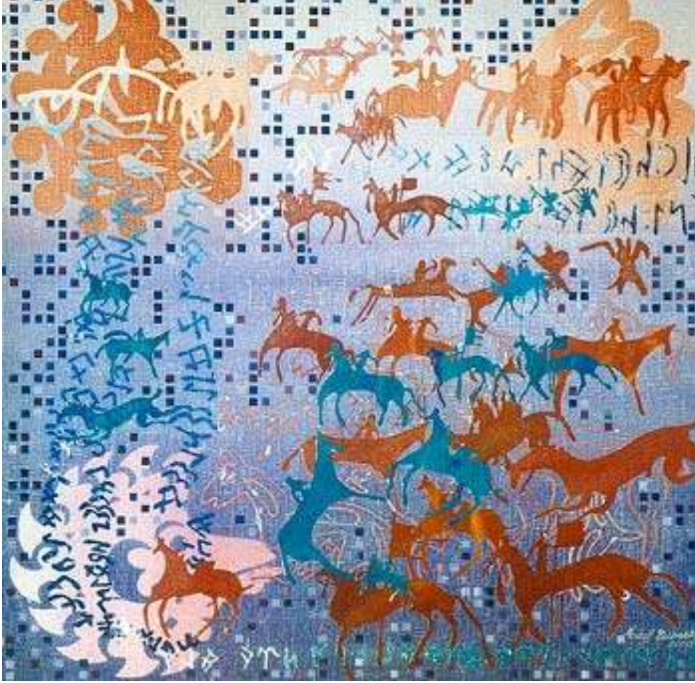
RESİM 7-ORHUN SERİSİ, 90*90CM, TUVAL ÜZERİNE KARIŞIK TEKNİK, 2000