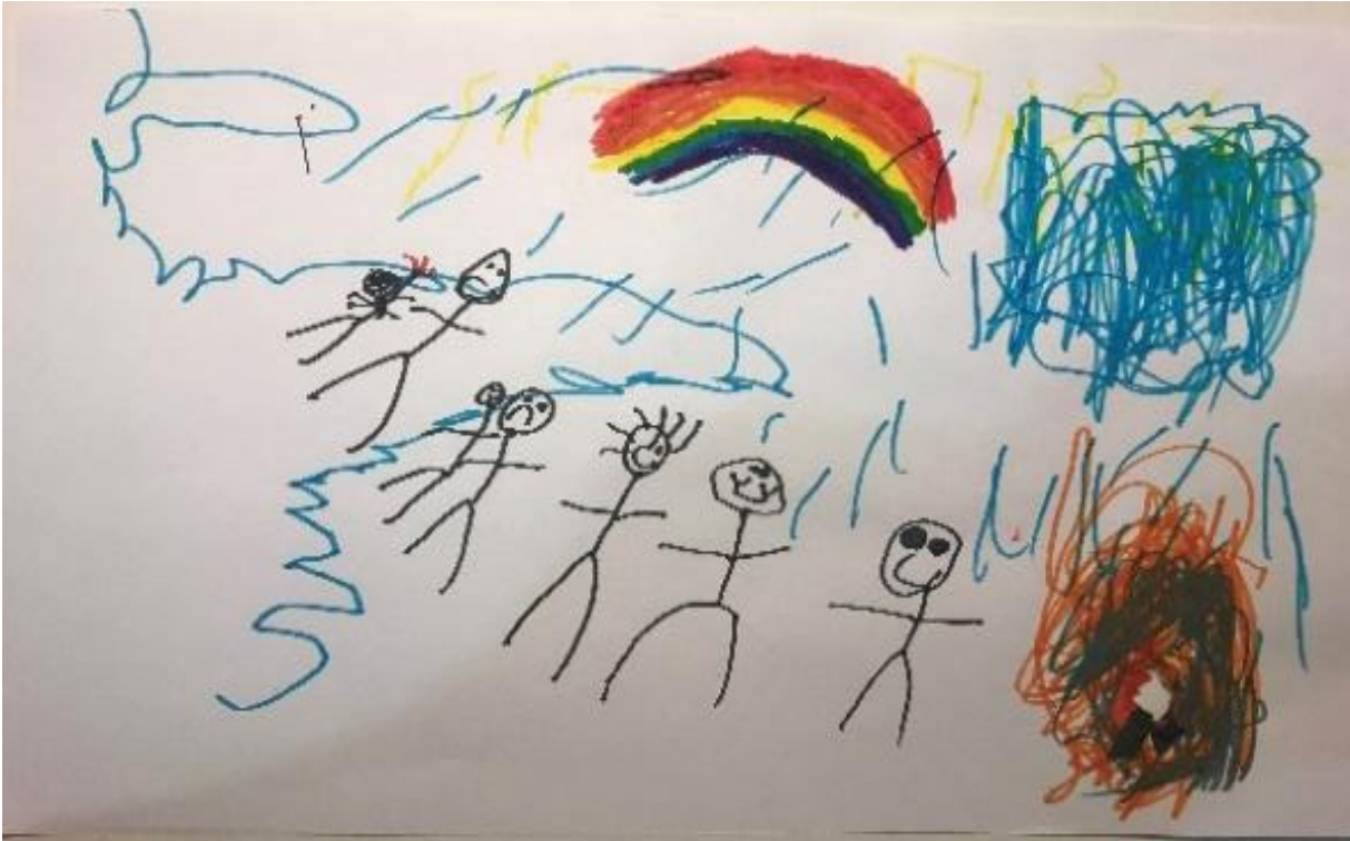
Resim 2. 36

Tablo 4’de, araştırmaya katılan çocukların kaynaştırma öğrencisi resminin çiziminde kullandıkları ilk figürler incelendiğinde, en çok “kendisini (f=16)” figür olarak kullanmışlardır. Daha sonra çoktan aza doğru “kaynaştırma öğrencisi (f=13)”, “okul (f=5)”, “öğretmen (f=2)”, “kardeş (f=2)”, “top sahası (f=2)” “tekerlekli sandalye (f=2)” ve “öğretmen masası (f=2)” figürlerini belirtmişlerdir. Ayrıca 1’er öğrenci kaynaştırma öğrencisinin çiziminde ilk figür olarak gözlük, güneş, çimen, ağaç ve gökkuşuğu figürlerini kullanmışlardır.