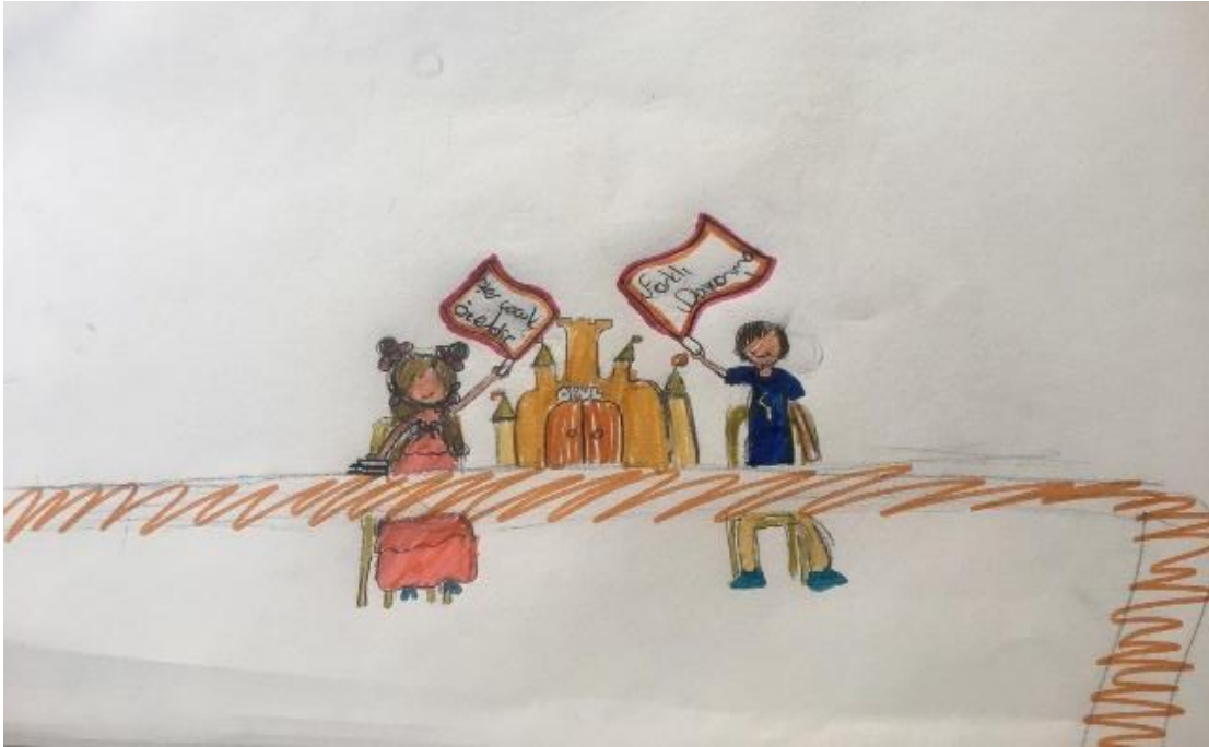
Resim 1. 35

Tablo 2’de, araştırmada yer alan öğretmenler kaynaştırma öğrencilerinin sosyal etkileşimi öğrencilere grup etkinliklerinde yapabilecekleri görevler vererek (f=7), sohbet içerikli diyaloglar kurarak (f=1), paylaşımlı oyunlar oynatarak (f=1) ve etkileşim sürecini anlatarak (f=1) sağlamaktadırlar.