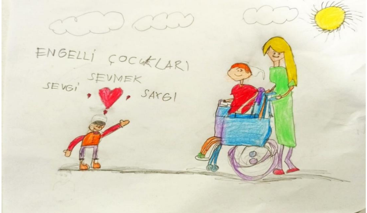
Resim 3. 37