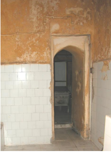
Res.7- Ilıklık girişi.