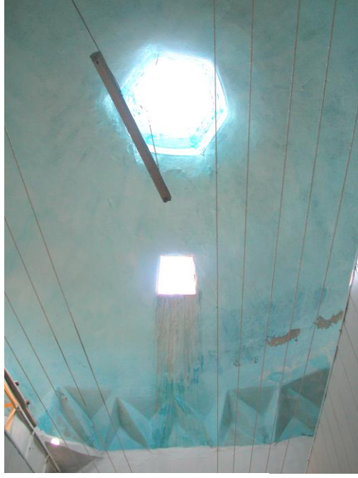
Res.5- Soyunmalık kubbesi.