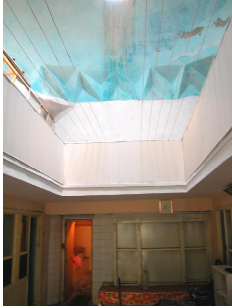
Res.3- Soyunmalık mekanından bir görünüş.