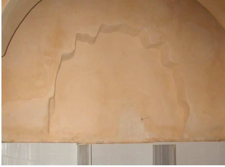
Res.9- Ilıklık mekanında dekoratif kemerli çökertmelerden güneydeki.