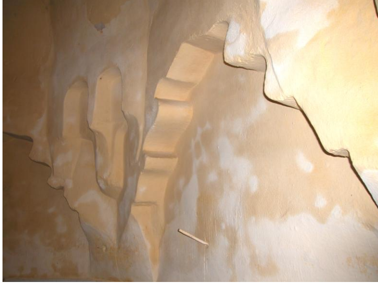
Res.13- Sıcaklık mekanının duvarlarındaki dilimli kemerler.