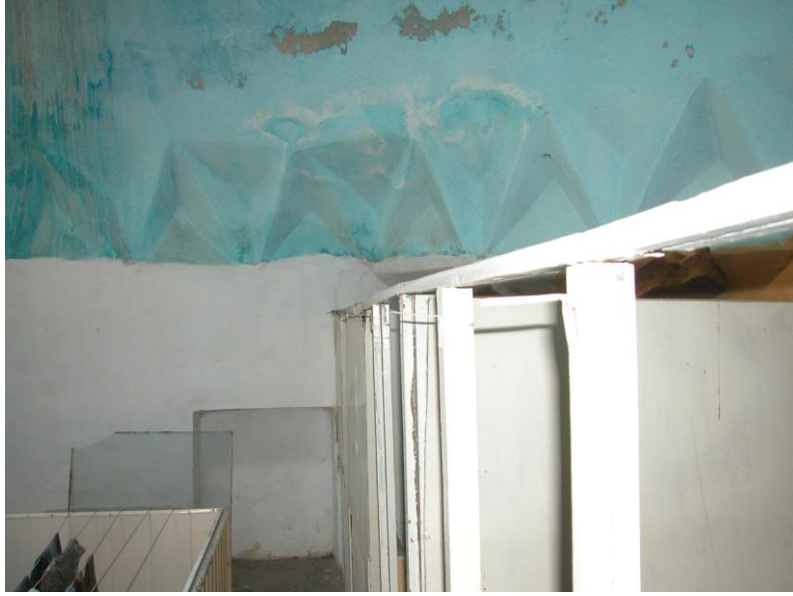
Res.4- Soyunmalık mekanının üst katında soyunma birimleri.