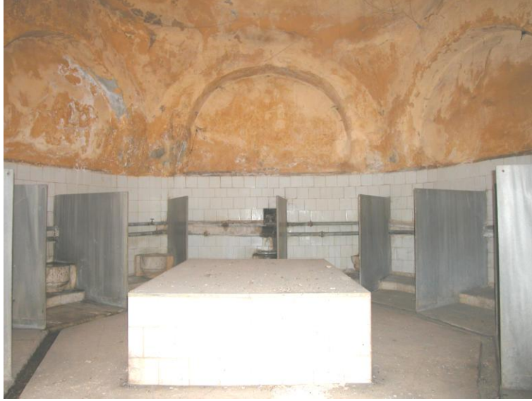
Res.20- Kadınlar kısmı sıcaklik mekanı.