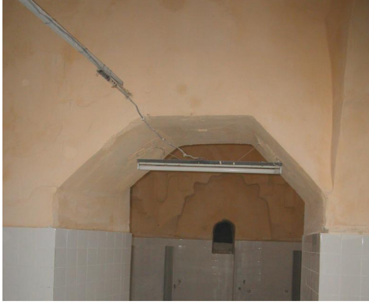
Res.11- Ilıklık ile sıcaklık arasına sonradan açılan giriş.