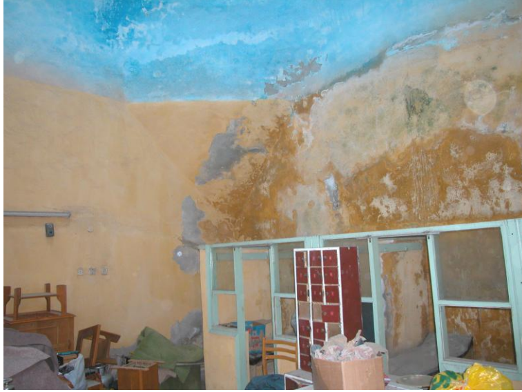
Res.18- Kadınlar kısmı soyunmalıđı