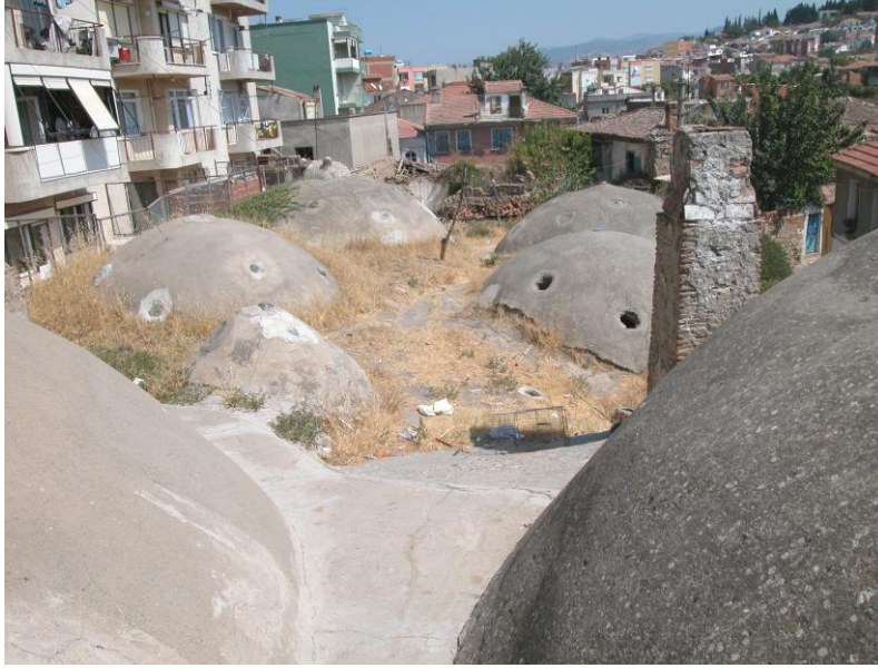
Res.2- Yüzeyleri beton sıvayla kaplanmış kubbeler.