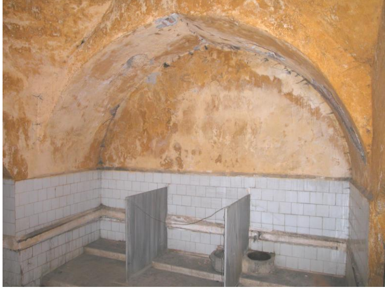
Res.19- Kadınlar kısmı ılıklik mekanı