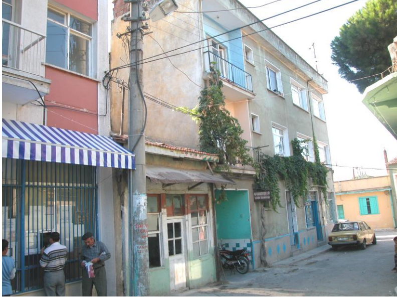
Res.1- Erkekler kısmı giriş cephesi.