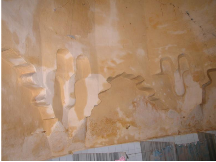
Res.12- Sıcaklık kubbesine geçiş unsurları.