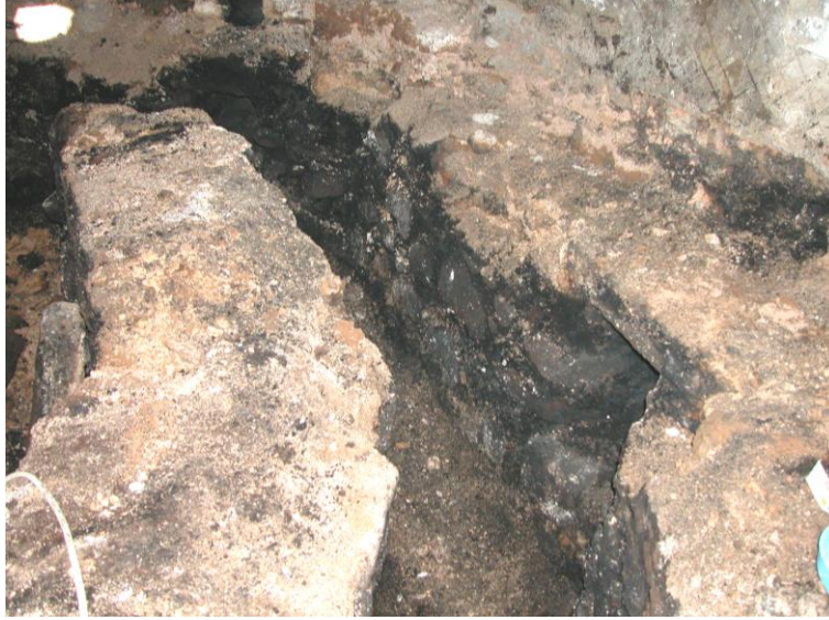
Res.14- Sıcaklık mekanı cehennemlik kanallarının temizlik sonrası görünümü.