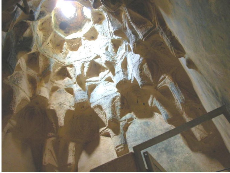
Res.10- Tuvalet-traşlık mekanı kubbesi.