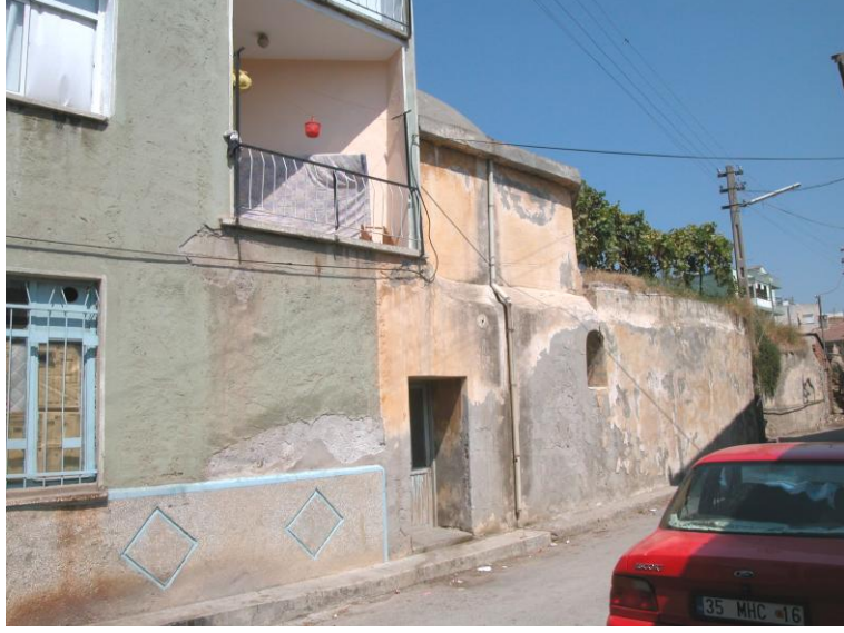
Res.17- Kadınlar kısmı girişi