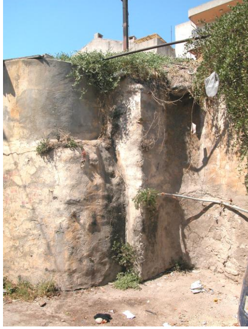
Res.21- Kadımlar kısmı güney duvarı üzerine inşa edilen soğuk su deposu.