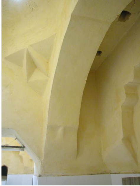
Res.8- Ilıklık mekanının güney kesimindeki kemer ve düz tavan.