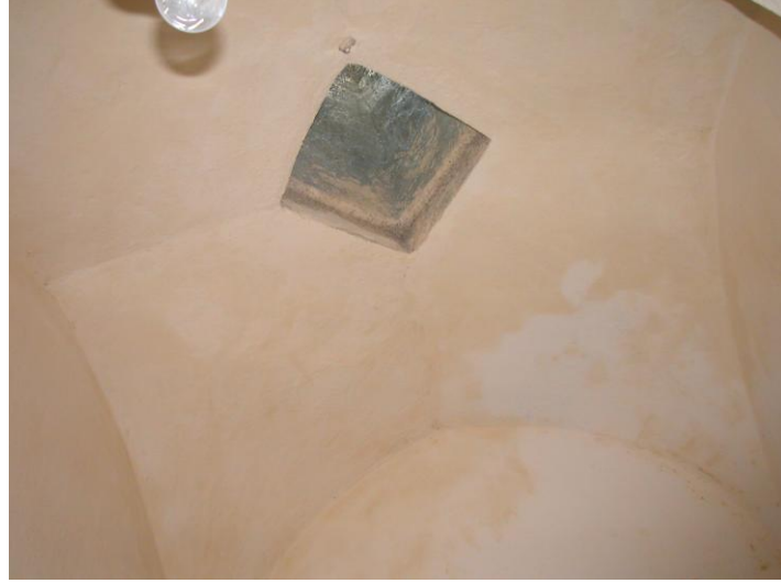
Res.6- Aralık mekanı örtüsü.