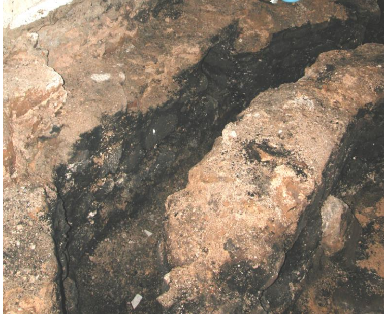
Res. 15- Sıcaklık mekanı cehennemlik kanallarının temizlik sonrası görünümü.