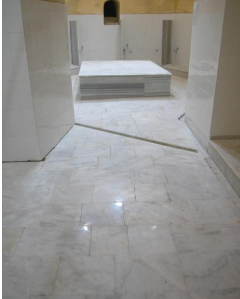
Res.16- Çalışmalar sonrası, ılıklıktan sıcaklığa bakış.