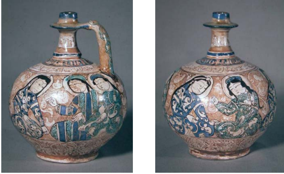
Foto. 4a-b- İran Büyük Selçuklu dönemi, lüster teknikli sürahi (Washington D. C. Freer Gallery of Art)