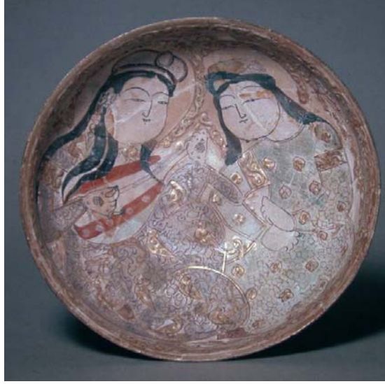
Foto 7- İran'ın Keşan kentinde üretilmiş, Büyük Selçuklu dönemi, minai teknikli kâp (Washington D. C. Freer Gallery of Art)