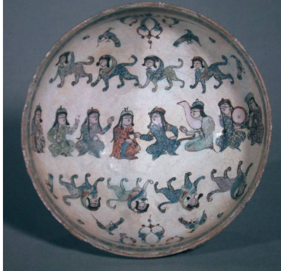
Foto 8- İran'ın Rey kentinde üretilmiş, Büyük Selçuklu dönemi, minai teknikli kâp (Washington D. C. Freer Gallery of Art)