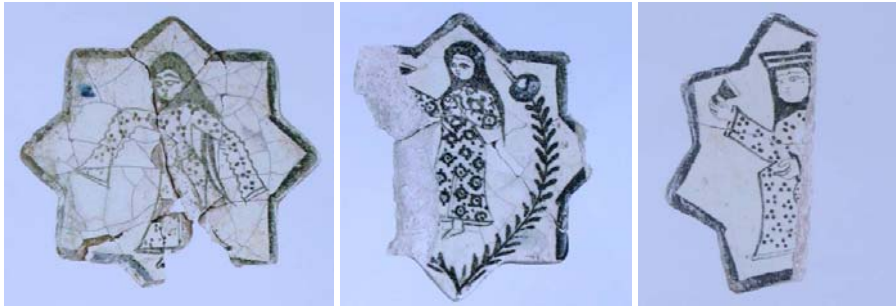
Foto. 18-20- Beyşehir Kubadabad Sarayı'ndan çiniler