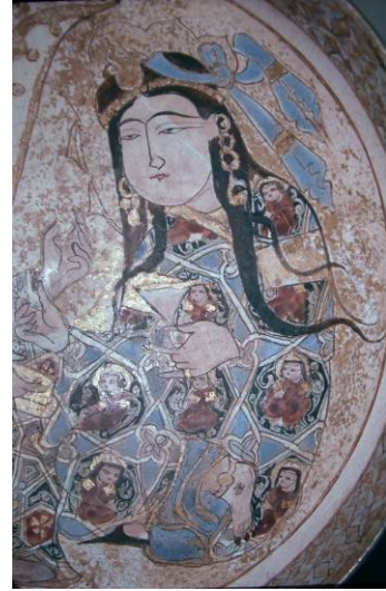
Foto 6a-b- İran'ın Keşan kentinde üretilmiş, Büyük Selçuklu dönemi, minai teknikli kap (Washington D. C. Freer Gallery of Art)