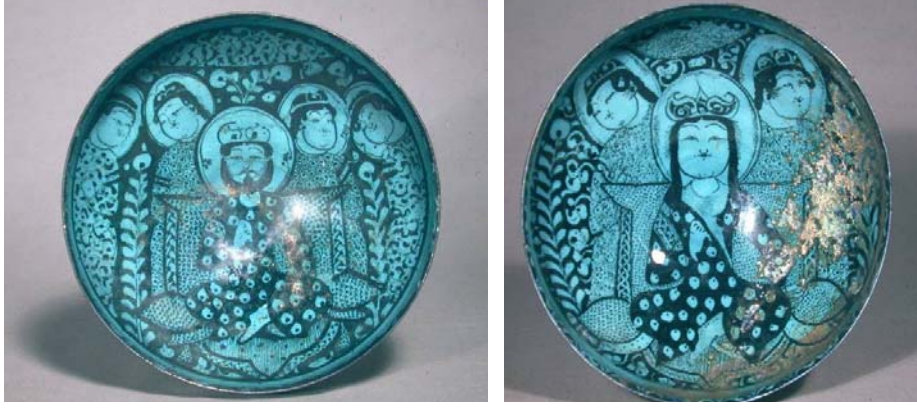
Foto. 3a-b- İran'ın Keşan kentinde yapılmış, Büyük Selçuklu dönemi, sıraltı teknikli kaplar (Washington D. C. Freer Gallery of Art)