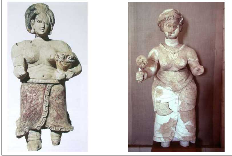
Foto. 1a-b- Hırbet-el Mefcir Sarayı'na ait alçıdan kadın heykelleri (Kudüs Rockfeller Müzesi)