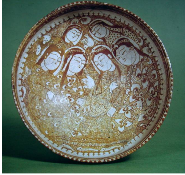
Foto. 5- İran'ın Keşan kentinde üretilmiş, Büyük Selçuklu dönemi, lüster teknikli tabak (Oxford Ashmolean Müzesi)