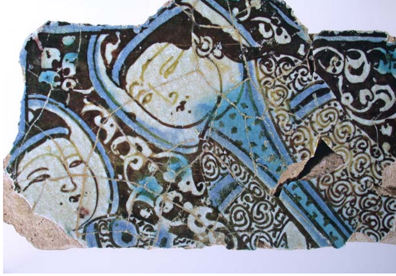
Foto. 15- Beyşehir Kubadabad Sarayı'ndan çini pano.