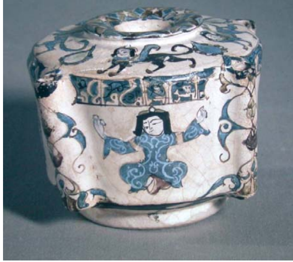
Foto 9- İran, Büyük Selçuklu dönemi, minai teknikli hokka (Washington D. C. Freer Gallery of Art)