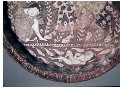
Foto 12a-b- İran'ın Keşan kentinde üretilmiş, Büyük Selçuklu dönemi, lüster teknikli tabak (Washington D. C. Freer Gallery of Art)