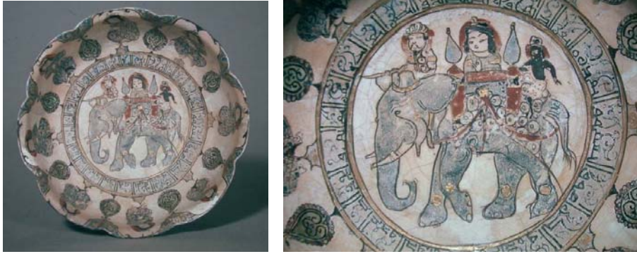
Foto 10a-b- İran, Büyük Selçuklu dönemi, minai teknikli tabak (Washington D. C. Freer Gallery of Art)