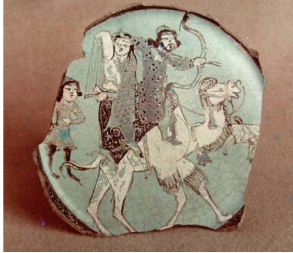
Foto 11- İran'ın Rey kentinde üretilmiş, Büyük Selçuklu dönemi, minai teknikli tabak (Berlin Pergamon Müzesi)