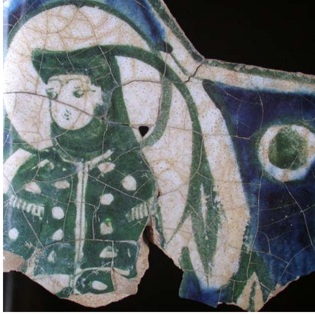
Foto. 17- Beyşehir Kubadabad Sarayı'ndan çini pano.