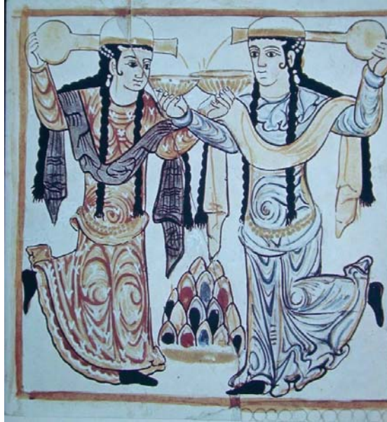
Foto. 2- Samarra Cevsak-ül Hakani Sarayı'nın duvarlarını süsleyen fresk.