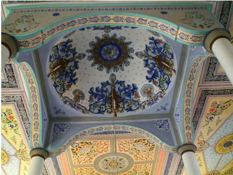
Res. 10- Eğridere Çarşı Camii, kubbe içi süslemeleri