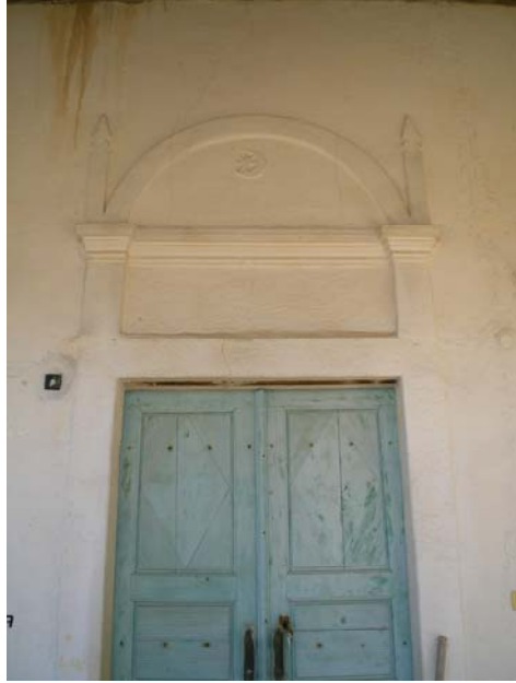
Res. 21- Ömerler Ali Rıza Bey Camii, harim girişi