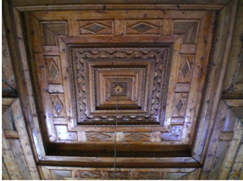
Res. 25- Ömerler Ali Rıza Bey Camii, ahşap tavan süslemeleri