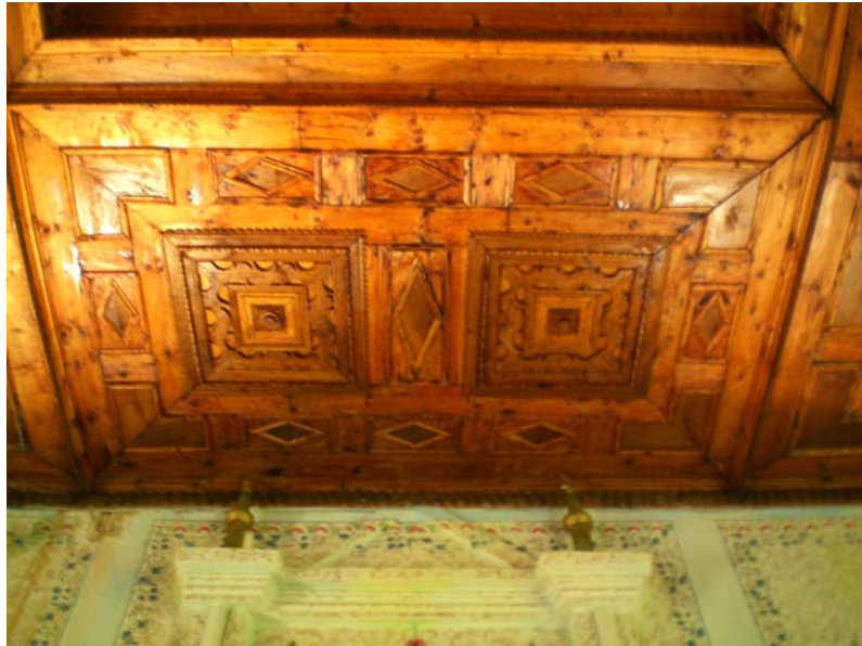
Res. 26- Ömerler Ali Rıza Bey Camii, ahşap tavan süslemeleri