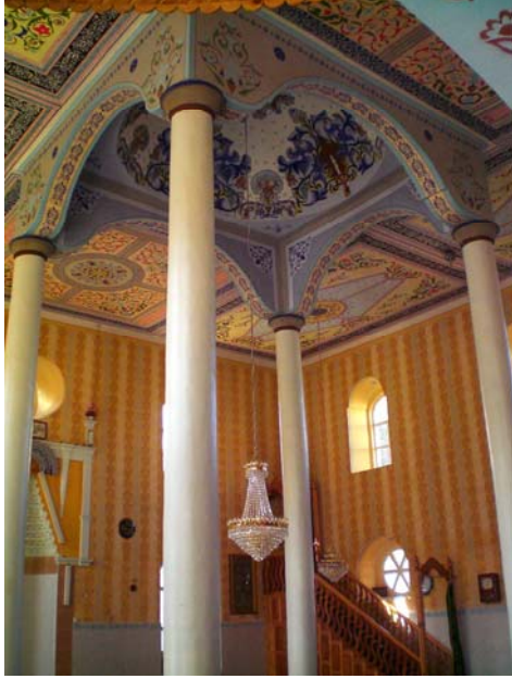
Res. 9- Eğridere Çarşı Camii, kubbesi