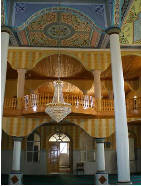
Res. 7- Egridere Çarşı Camii, kadınlar mahfil