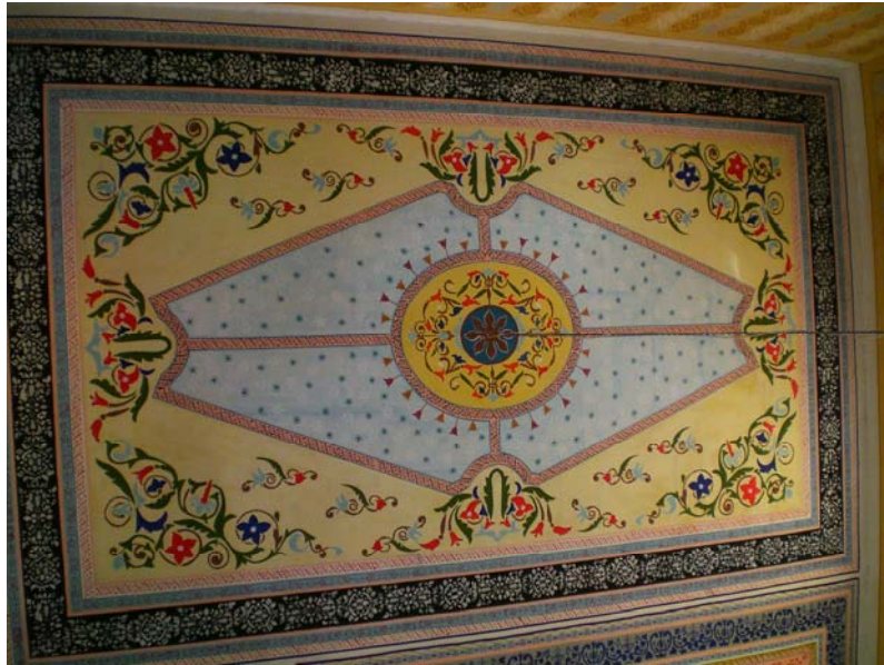
Res. 12- Eğridere Çarşı Camii, yan sahnin tavan süslemeleri