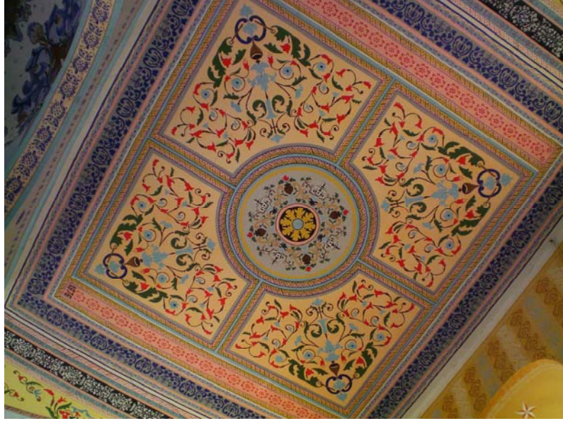
Res. 11- Eğridere Çarşı Camii, orta sahnin tavan süslemeleri