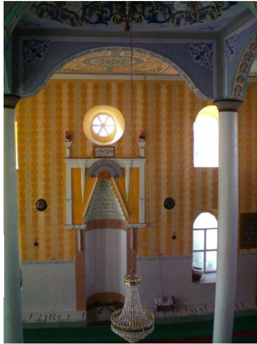
Res. 8- Egridere Çarşı Camii, mihrabı