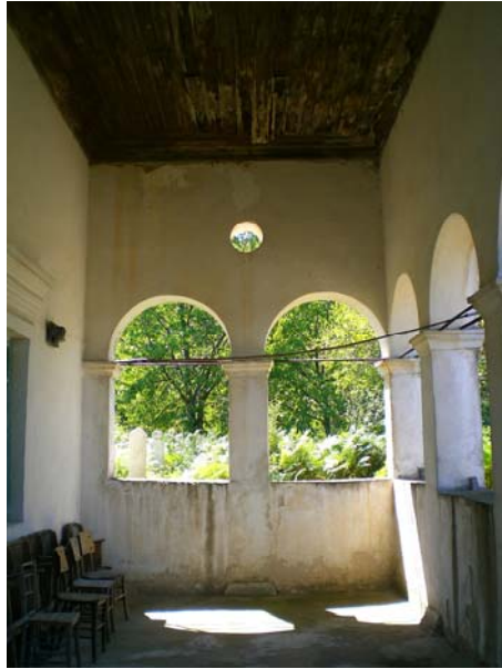
Res. 20- Ömerler Ali Rıza Bey Camii, son cemaat revakı tavanı