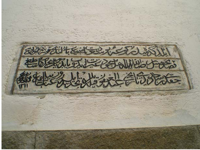
Res. 13- Eğridere Çarşı Camii, onarım kitabesi