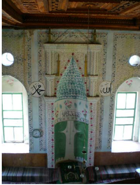
Res. 23- Ömerler Ali Rıza Bey Camii, mihrabı