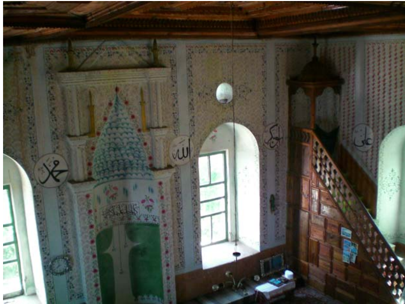
Res. 22- Ömerler Ali Rıza Bey Camii, harimi