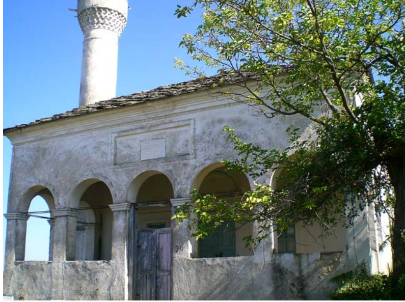
Res. 19- Ömerler Ali Rıza Bey Camii, son cemaat revakı