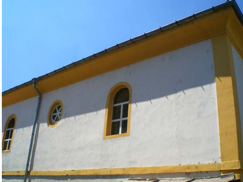
Res. 2- Eğridere Çarşı Camii, güney cephesi.