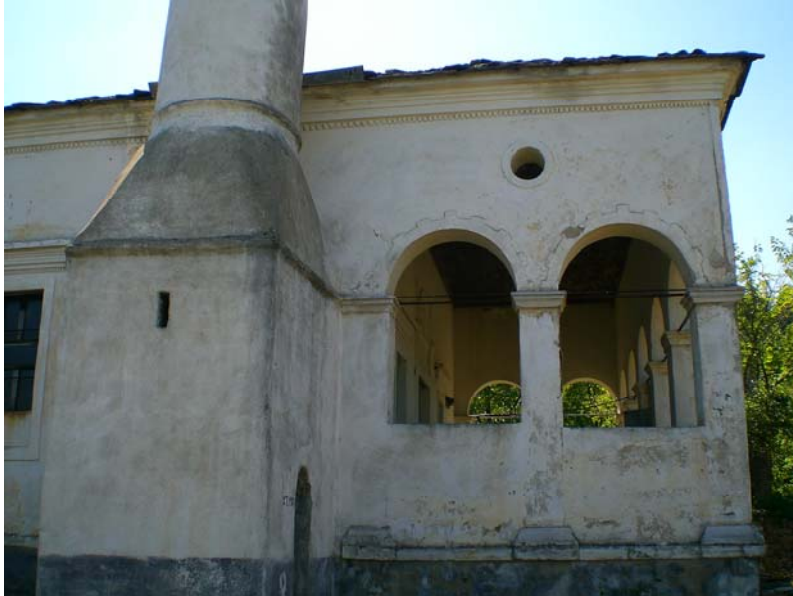
Res. 18- Ömerler Ali Rıza Bey Camii, minare kaidesi