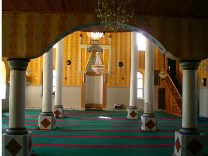
Res. 6- Eğridere Çarşı Camii, harimi