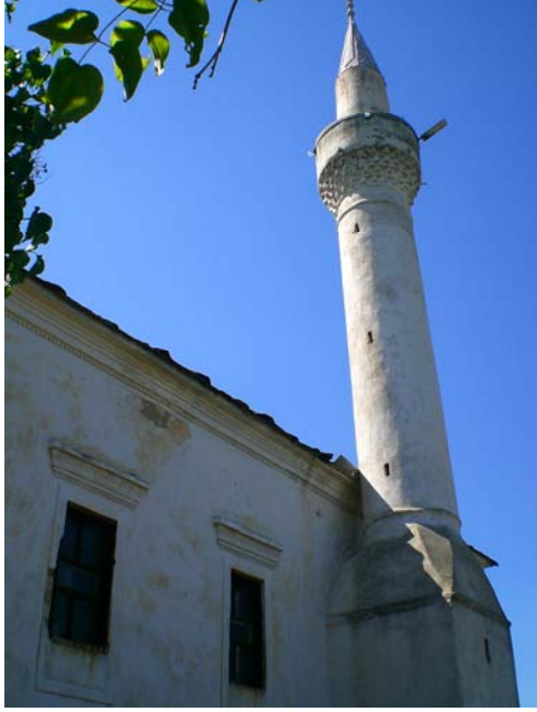
Res. 15- Ömerler Ali Rıza Bey Camii, doğu cephesi