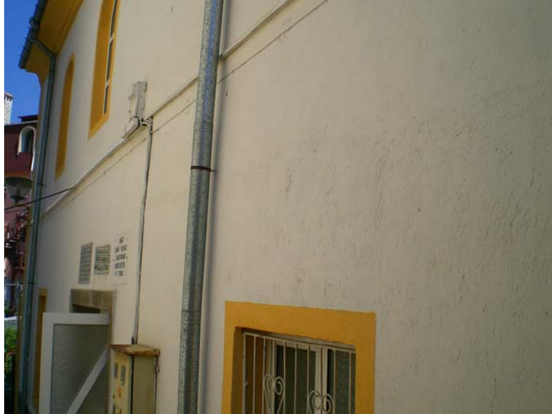
Res. 4- Eğridere Çarşı Camii, son cemaat yeri girişi