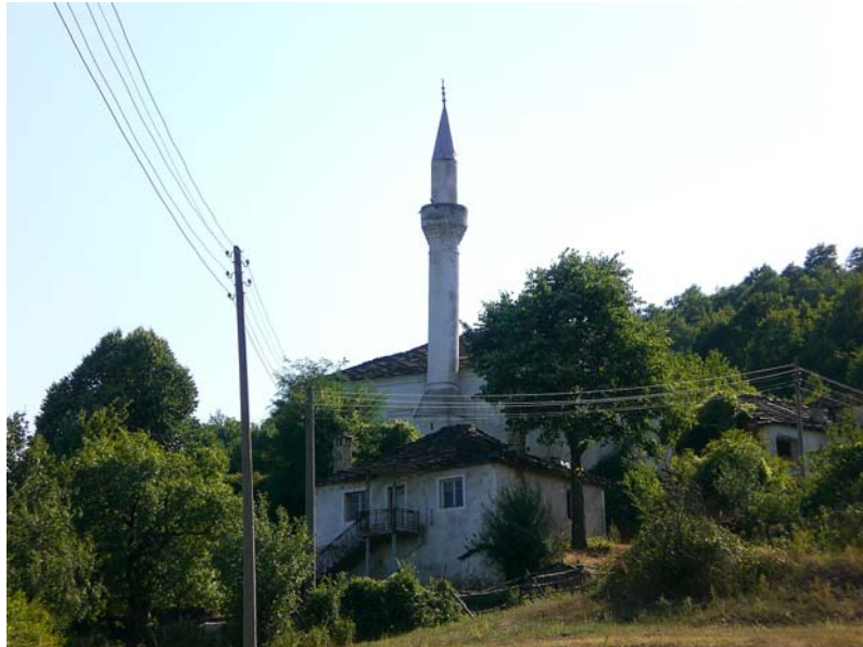
Res. 14- Ömerler Ali Rıza Bey Camii, genel görünüşü