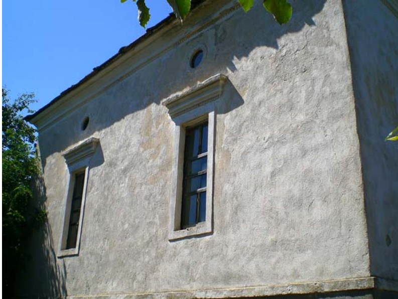
Res. 16- Ömerler Ali Rıza Bey Camii, güney cephesi