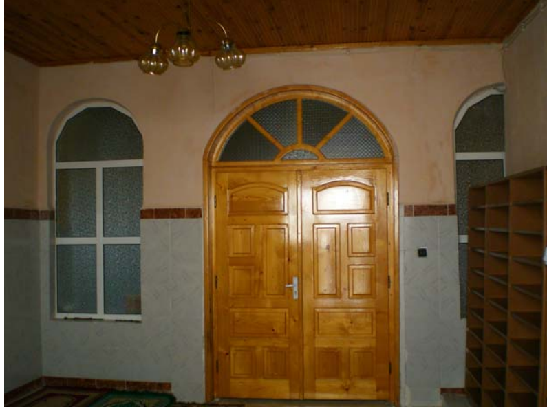
Res. 5- Eğridere Çarşı Camii, harim girişi