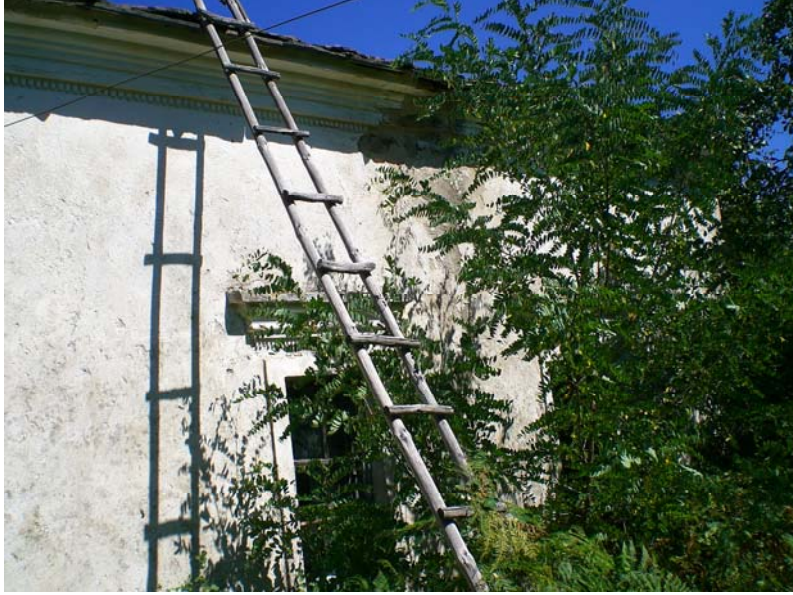
Res. 17- Ömerler Ali Rıza Bey Camii, batı cephesi