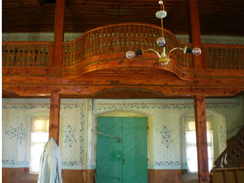
Res. 24- Ömerler Ali Rıza Bey Camii, kadınlar mahfilı.