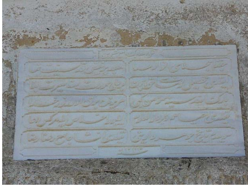
Res. 27- Ömerler Ali Rıza Bey Camii, inşa kitabesi