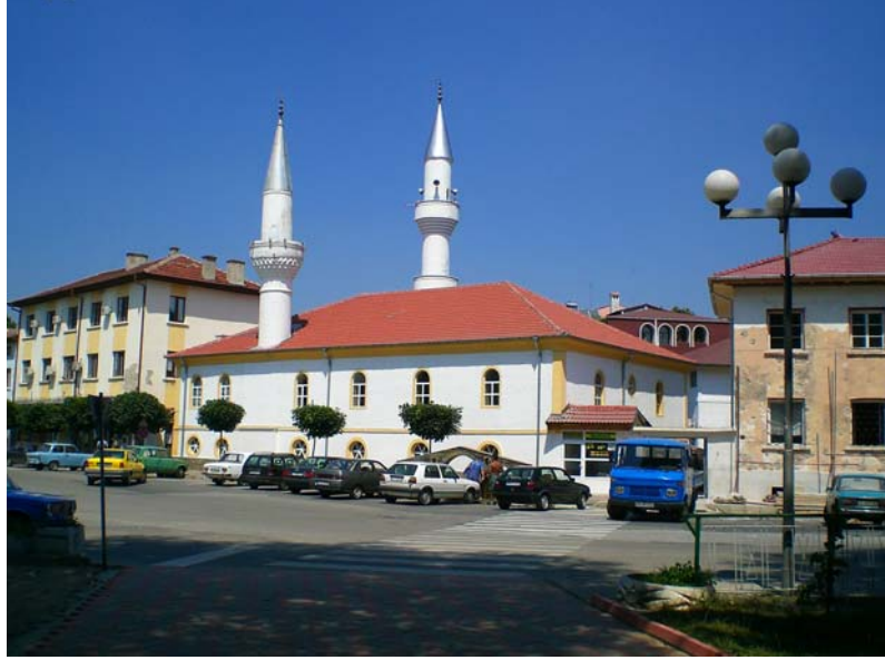
Res. 3- Eğridere Çarşı Camii, batı cephesi