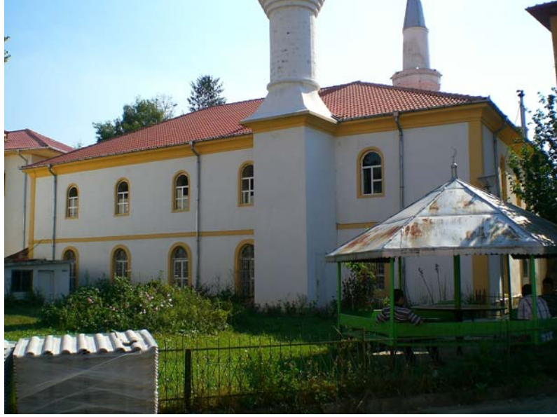
Res. 1- Eğridere Çarşı Camii, doğu cephesi