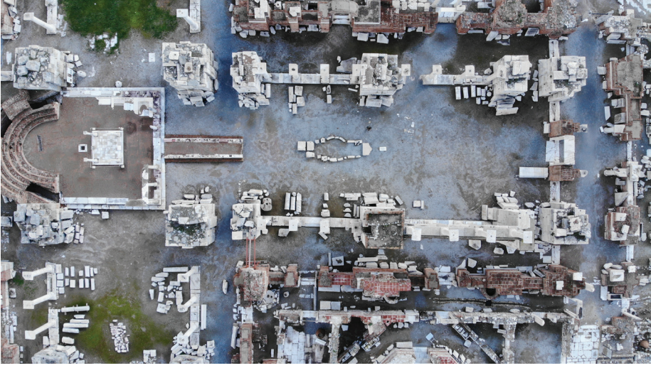
Fot. 1: Efes St. Jean Kilisesi