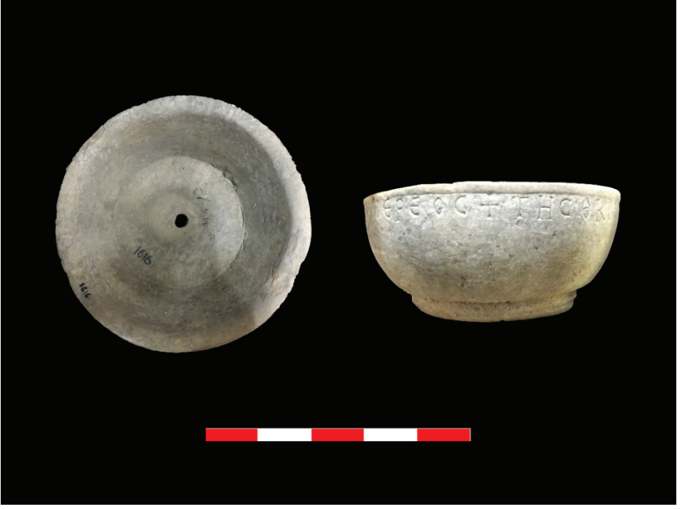
Fot. 6: Efes Arkeoloji Müzesi'nde bulunan phiale