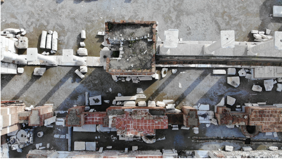
Fot. 2: Kilisenin kuzey koridorunda bulunan zeytinyağı işlikleri