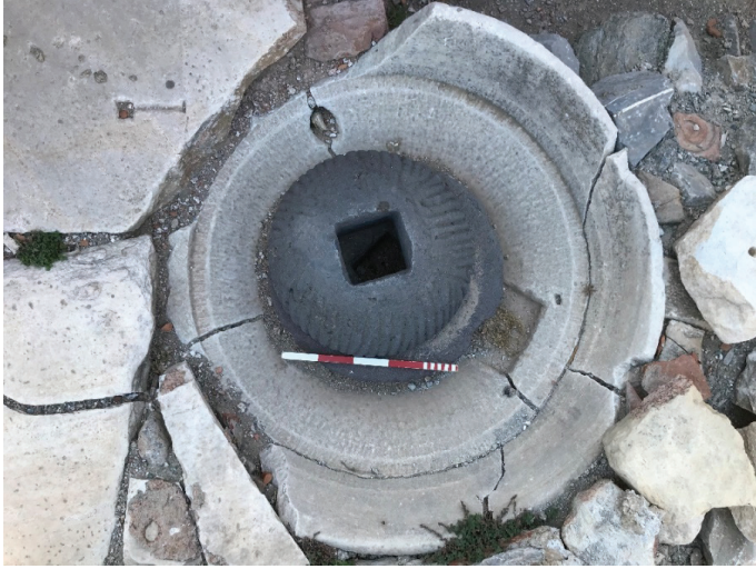
Fot. 4: Phiale