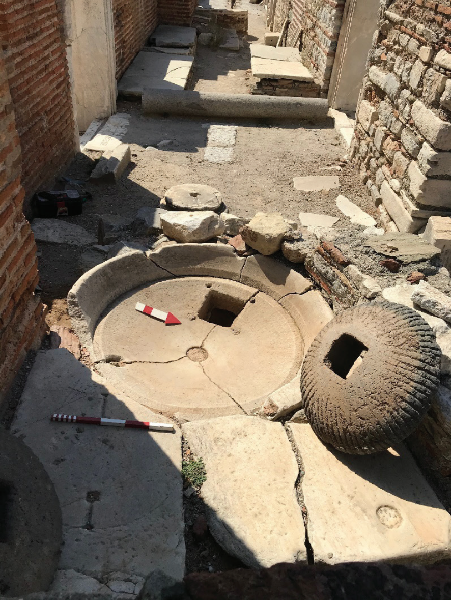
Fot. 3: Phialenin devşirme olarak kullanıldığı işlik (Ayasuluk Tepesi ve St. Jean Anıtı Kazı Arşivi)