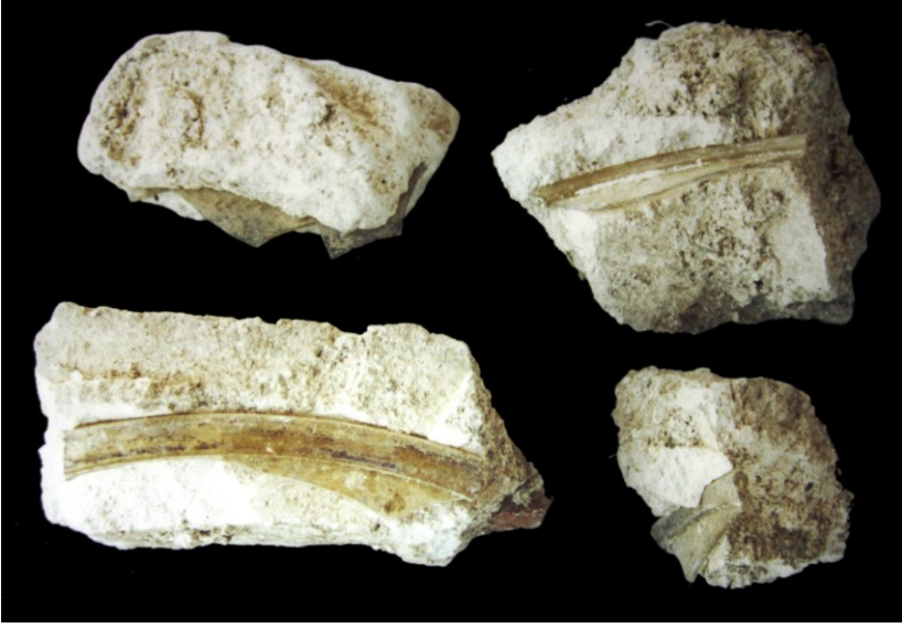
Resim 8. Alçıya gömülmü pencere camları.

figürlü kemer köşeliđi ve atlı avcı figürlü panoya ait bir parça da yer almaktadır.