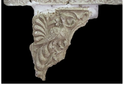
Resim 4. Dolap nişi kemer köşeliği.

Büyük Sarayın harem olduğu düşünülen bölümdeki (“R” kodlu) odada in-situ alçı dolabın önündeki göçük tabakası içinde ise dolap nişine ait; bordür, kemer köşeliği ve pano parçaları ele geçirilmiştir. Bunlar arasında, alçı kaplamaların üst kısmına ait olduğu düşünülen dikdörtgen biçimli bir pano parçası dikkat çekicidir 8 . Panoda, arslan başı şeklindeki başlıklara sahip Burma sütunların taşıdığı sivri kemer içerisinde atlı avcı figürü tasvir edilmiştir 9 (Resim 5). Koşan atın üzerindeki avcı figürünün gövdesi ve başı