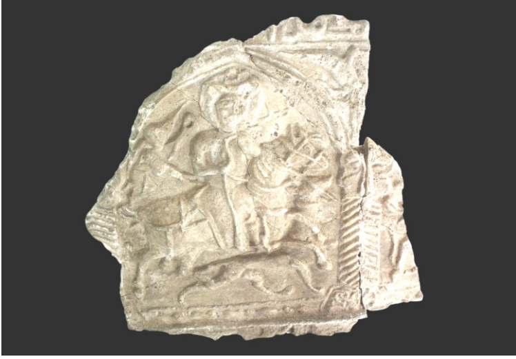
Resim 5. Atlı avcı figürlü pano.

cepheden, bacağı profilden verilmiştir. Üzerinde kaftanı, başında başlığı ve halesiyle verilen avcı figürü sakalsızdır. Sağ eliyle atın eğerini, sol eli ile atın boynunun arkasındaki mızrağı tutmaktadır. Atın kafası koşumlu ve kuyruğu düğümlüdür. Avcı figürünün arkasında sol elinde bir zafer çelengi taşıyan melek figürü, atın ayakları altında ise koşan bir tazi yer almaktadır. Avcının başının sol yanında kabartma harflerle “Muhammed” yazmaktadır 10 . Panoyu üstten sınırlayan bordürün yüzeyi yazı ile doldurulmuştur. Ancak yazı bordürü kırık olduğundan ne yazdığı tam olarak anlaşılmamaktadır 11 . Mask şeklinde verilmiş arslan başları ve melek figürü koruyucu, uğur getiren öğeler olarak kullanılmıştır 12 . Panonun sol yanında burma sütunun diğer