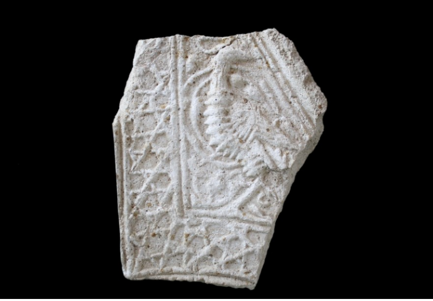
Resim 7. Kuř figürlü pano parası.

Buraya kadar ele geen eřitli alı paralarından, odanın bir duvarının tamamının alı dolap ve panolarla kaplandığı anlaşılmaktadır. Altta niřler, niřlerin üstünde av sahneli, kuř figürü tasvirli panolar ve bunları üç yönden kuřatan geometrik ve bitkisel bezemeli bordürler olduđu düşünölebilir. Bu řekildeki bir düzenleme ađdařı olan Musul'daki Karasaray'da görölmektedir. Burada alt bölüm sađır niřlerle süslenmiř, bunun üzeri eřitli kuř ve arabesk kompozisyonlarla bezenerek, yazı bordürleri ile erevelenmiřtir 16 .