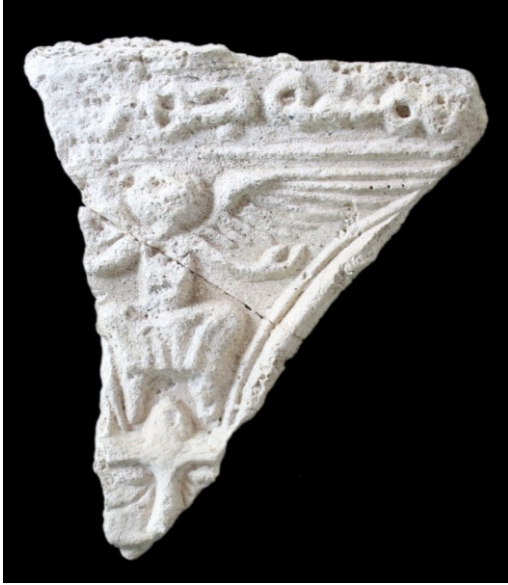
Resim 6. Melek figürlü pano köşeliği.

yarısının bulunduğu ve bu panodaki sahnenin tekrarının olduğu anlaşılan bir başka panoya ait parça yer almaktadır. Hem bu parça hem de kazı çalışmaları sırasında bulunan aynı nitelikteki diğer parçalar, dolap nişinin üst kısımlarının bu panolarla kaplı olduğunu düşündürmektedir. Bu av sahnesindeki sıralama Sâsânî av sahnelerinin etkilerini taşımaktadır 13 . Konya Alâeddin Köşkü'ndeki karşılıklı iki atlı figürü tasviri de aynı sıralamanın olması nedeniyle benzerlikler göstermektedir 14 . Konya Alâeddin Köşkü kabartmasında Kubad Abad kabartmasında olduğu gibi atlı figürlerinin başları ve gövdeleri cepheden, bacakları profilden verilmiştir. Buradaki avcı figürleri, başlarında başlık ve haleleriyle Kubad Abad avcı figürüne benzerler. Her iki tasvirde de atlar dörtlü tasvir edilmişler, atların kafa koşumları ve kuyruk bakımları aynıdır.