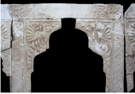
Resim 3. Üç dilimli kemerli dolap nişi.

Dolap nişleri üç dilimli kemerli olup, kemerlerin tepesi düzdür. Kemer köşeliklerinde profilden verilmiş birer tavus kuşu figürü yer alır (Resim 3). Başlarında üç tüyden oluşan sorguçları bulunan tavus kuşlarının, kuyrukları yelpaze gibi açılmaktadır. Tavus kuşlarının etrafı rumi ve kıvrık dallı bitkisel motiflerle süslüdür (Resim 4). Tavus kuşları, ebedi hayat ve cennet sembolü olarak, Anadolu Selçuklu dini ve sivil mimarisinde süslemede yaygın bir şekilde kullanılmıştır 6 . Tavus kuşu figürünün alçı süsleme olarak; Yozgat Delice Köşkü, Konya Alâeddin Köşkü ve Turhal Gümüştop Zaviyesinde de aynı şekilde kullanıldıkları görülmektedir 7 .