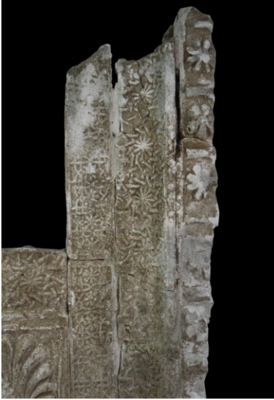
Resim 2. Dolap nişi çerçeve içine alan bordürler.