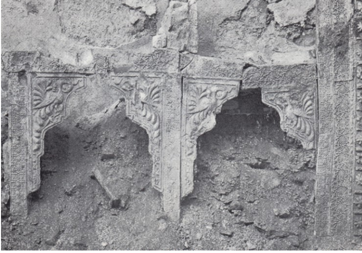
Resim 1. Alçı dolap nişleri (K. Otto-Dorn'dan – 1969).

bordürün yüzeyi sekiz kollu yıldız ve haç kompozisyonu ile süslüdür. Yıldızların ortasında, sekiz dilimli rozet çiçek motifleri bulunur (Resim 2). Bu bordürlerin benzerlerine, Alanya Sarayı ve Konya Alâeddin Köşkü'nde de rastlanılmaktadır 5 .