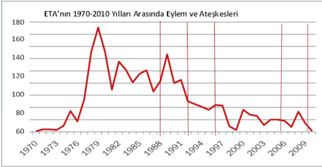
Grafik 1: ETA'nın 1970-2010 Yılları Arasındaki Eylem ve Ateşkesleri

Kaynak: (GTD, 2011). https://www.start.umd.edu/sites/default/files/files/publications/br/ETACeasefires.pdf