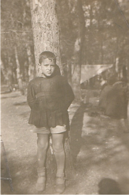
1953: Denizli, amlık mevkiindeki okul pikniğinden bir kesit.