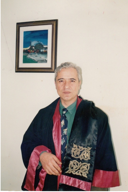
Selçuk Üniversitesi cübbesi ile.