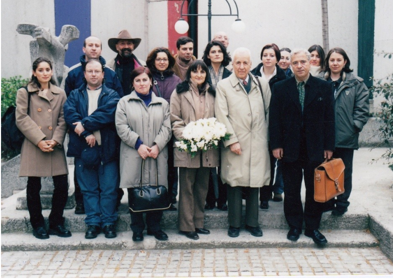
2002: 15. Yüzyıl Osmanlı Kültür ve Sanatı Sempozyumu'na katılanlardan bir grup.