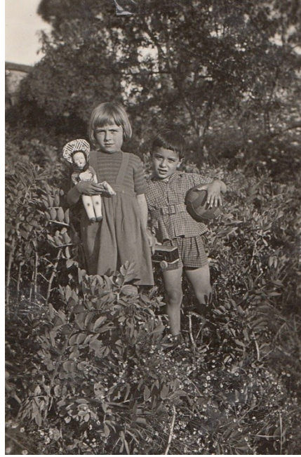
1951: Teyzemlerin Şişli’deki evlerinin bahçesinde, tahta tramvay ve topumla.