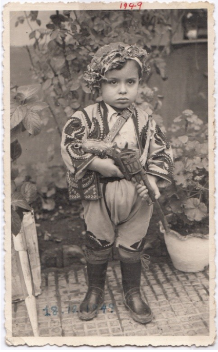
1949: Denizli’de bulduğumuz sırada efe giysileriyle bayramlık fotoğraf.