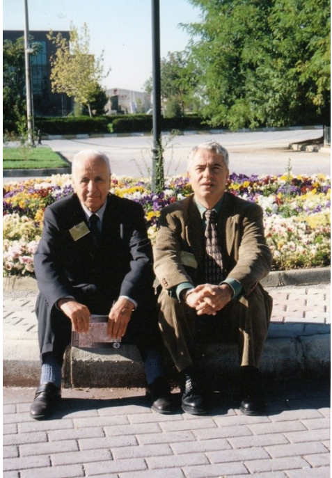
2000: Konya'daki bir sempozyum sırasında Prof.Dr. Oktay Aslanapa ile dinlenme ânı.