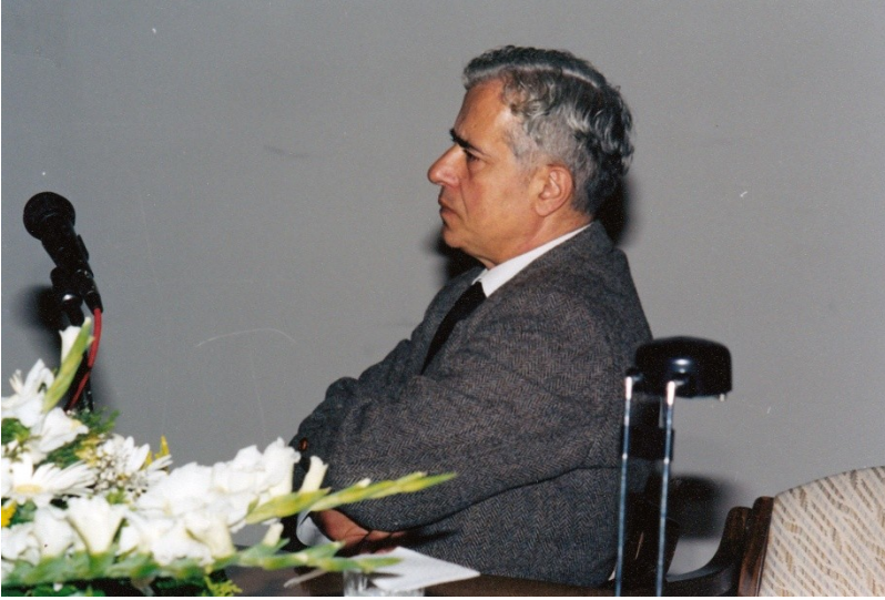
2001: Bir sempozyumda oturum başkanlığı.