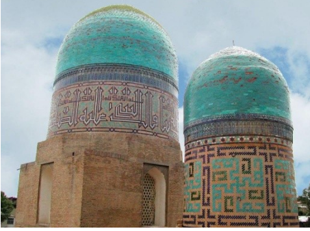
15. Kadızâde-i Rûmi Türbesi Güney Doğu Cephesi. Semerkant, Özbekistan.