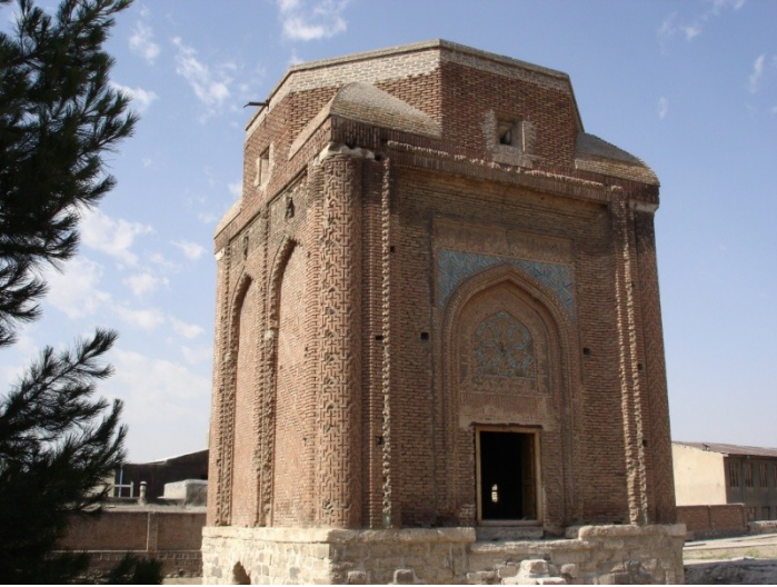
Res.4-Kümbet- Surh. 1147, Meraga, İran. (R.T.Mortel, 2005) ( http://www.panoramio.com/photo/10767975 )