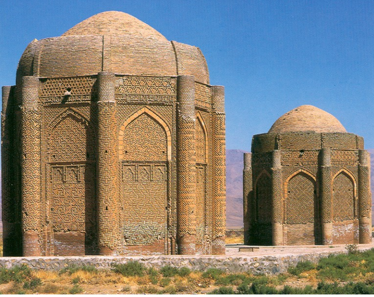
Res.3- Kazvin yakınındaki Büyük Selçuklu Dönemine ait Karagan (Harrek) Kümbetleri. İran. Zereshk, 2005. ( http://tr.wikipedia.org/wiki/Dosya:Kharaghan.jpg )