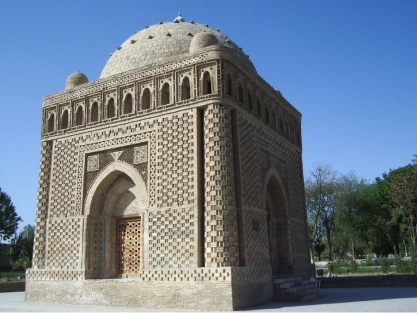
Res.12- Samânoğlu İsmâil Bey Türbesi, Buhara, Özbekistan. 2006. ( http://www.pbase.com/juninho03/bukhara&page=all )