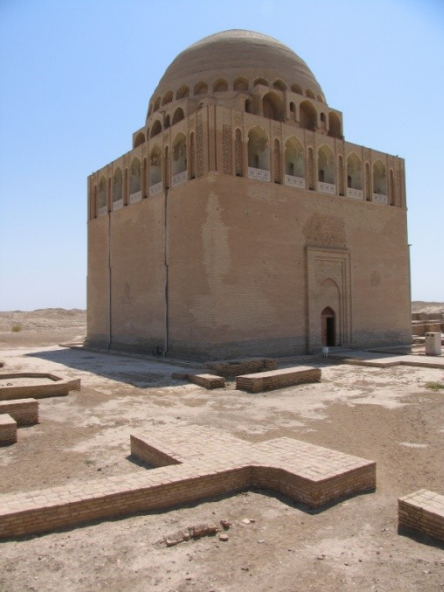
Res.5-Sultan Sencer Türbesi. 1157. Merv, Türkmenistan.