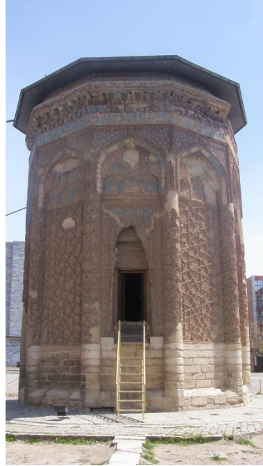
Res.6-Kümbet-i Kebut. 1197, Meraga, İran. (Elmju, 2010) ( http://commons.wikimedia.org/wiki/File:Kabud_dome.JPG )