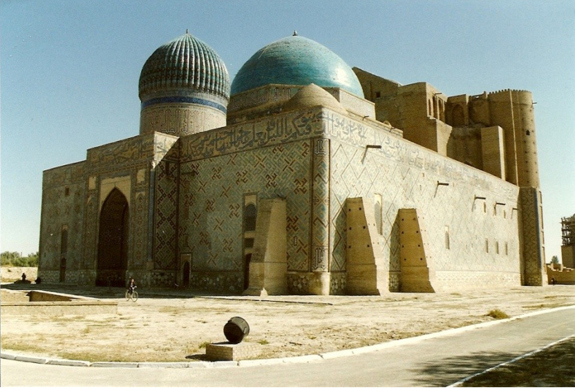
Res.11- Hoca Ahmet Yesevi Türbesi, Türkistan, Çimkent, Kazakistan.