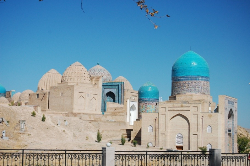
Res.14- Şah-ı Zinde türbelerinden Kadızâde-i Rûmi ve Emir Hüseyin Tuğluk Türbeleri. Semerkant, Özbekistan. (S. Başkan, 2007)