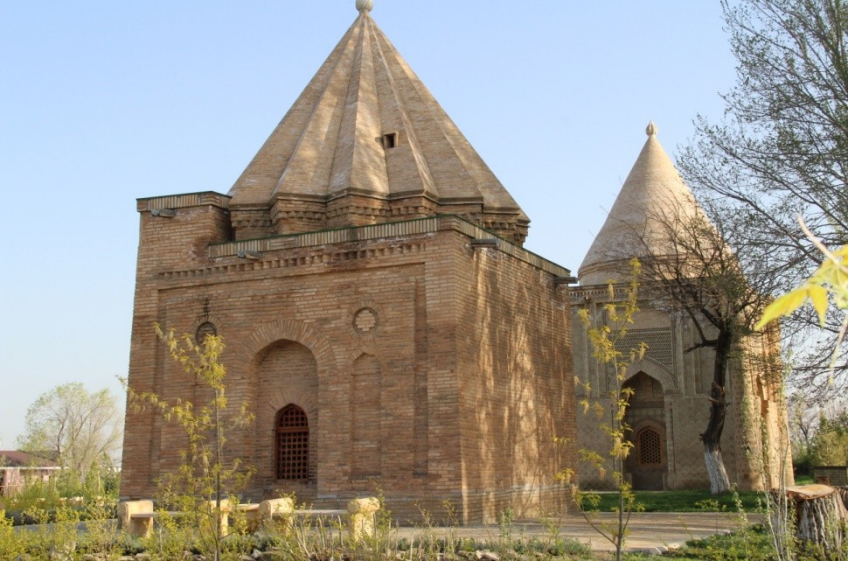
Res.9.-Kazakistan'ın Taraz/ Cambul şehri yakınındaki Karahanlı Dönemine ait Ayşe Bibi ve Balaca Hatun Türbeleri (G.Kushenova,2012)