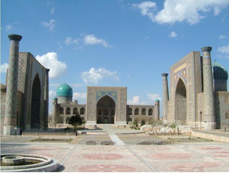
Res.1.Registan Meydanı. Semerkant, Özbekistan. (S. Başkan, 2007)