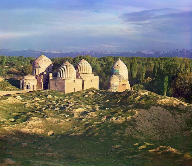
Res.13- Yüz yıl önce Şah-ı Zinde Yapılar Topluluğu, Semerkant, Özbekistan.