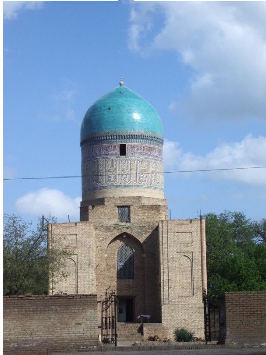
Res.17- Bibi Hanım Türbesi. Semerkant, Özbekistan. (S. Başkan, 2007)