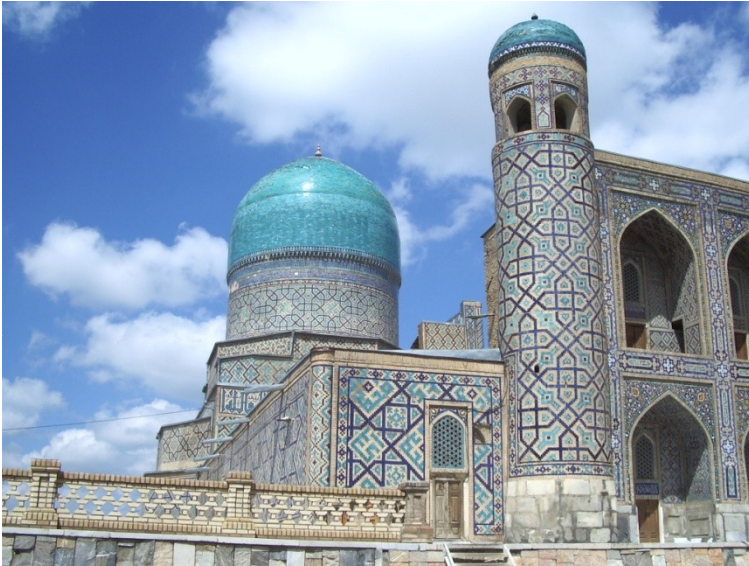
Res.2-Uluğ Bey Medresesi. Semerkant, Özbekistan. (S. Başkan, 2007)