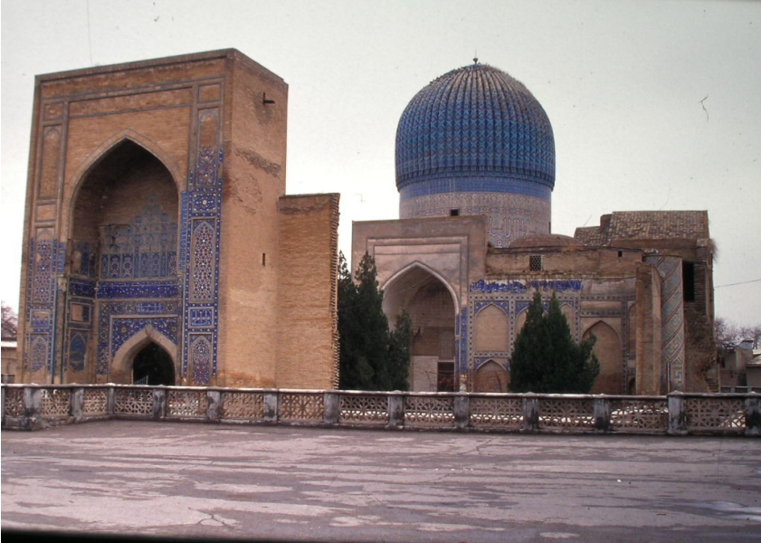
Res.10- Timur'un Türbesi /Gür- ı Emir, Semerkant, Özbekistan. (S. Başkan, 1992)