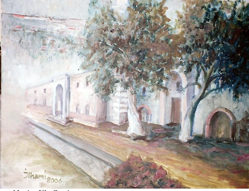
Manisa Ulu Cami