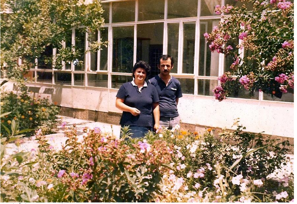
Türk İslam Müzesi'nden