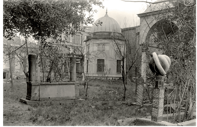
Yedi Sekiz Hasan Paşa Türbesi

1937 yılında Türkiye'ye gelen İngiltere Kralı Edward'ın ziyaret arzusu dolayısıyla türbenin durumu dikkat çekmiş, bakımsız haziresinin düzenlenmesi zorunluluğu doğmuştur. Sultan II.