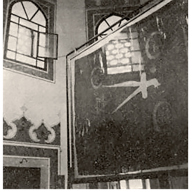
1982'de türbe içi

22 Eylül 1913 tarihli belgede, Barbaros Hayreddin Paşa'nın türbesinde bulunan ve benzeri Bahriye Sancak Mağazası'nda yapılacak olan sancağın