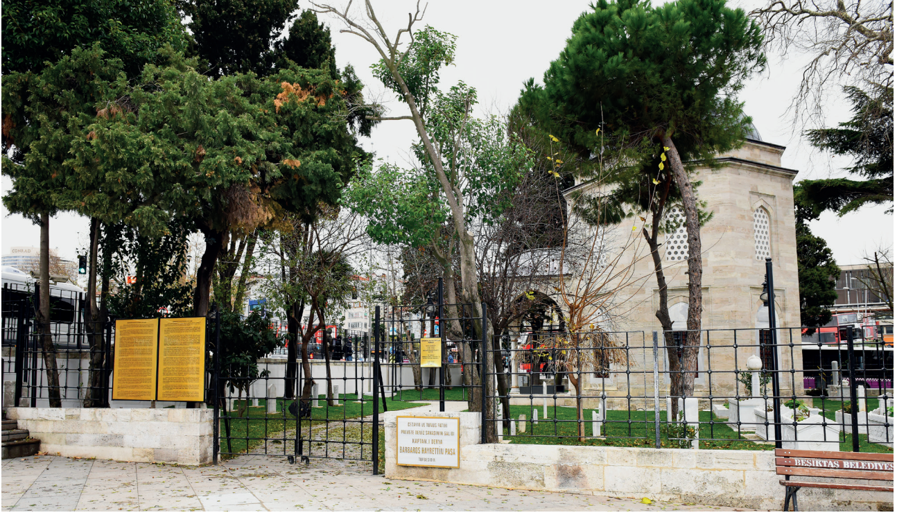
Meydandan genel görünüm