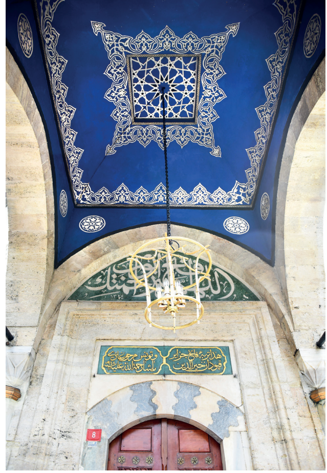
2013 yılındaki restorasyon sonrası revak tonozu

Kapı kanadına iki basamakla ulaşılır. Kündekâri kapı, 1958 yılındaki restorasyon sırasında Asaf