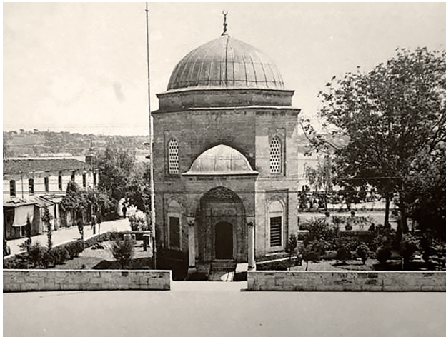
Türbenin 1950’li yıllardaki görünümü

Türbe, çağdaşı yapılarla karşılaştırıldığında döneminin karakteristik özelliklerini tamamen yansıtmaktadır ve üzerindeki tarihle (H. 948 / M. 1541) uyum göstermektedir. Ancak Barbaros’un ölüm tarihinden çok önceleri yapılmış olması, geleneklere aykırı bir durum olmasa da soru işaretlerine yol açmaktadır. Türbenin yapıldığı ve vakfedildiği tarihlerde Akdeniz’de başardasıyla dolaştığı düşünülünce çelişki ortaya çıkmaktadır. Deniz savaşlarının zirvesindeyken mezarının yapılmasını istemesi ve İstanbul’da gömüleceğini düşünmesi ilginçtir. Kaynaklarda Barbaros Vakfiyesi’nin yazılışıyla ilgili olarak verilen 1548 ile 1562 (H. 954 ve 970) arasındaki farklı tarihler, türbenin yapım tarihini netleştirmeyi engellemektedir. Yıllar içinde dış görünümü sabit kalmakla birlikte içindeki bazı süslemeler ve kapı kitabesindeki yazılar değişikliğe uğramıştır. Burada türbenin tarihteki yeri, mimari özellikleri, onarımları, mezarlar ve içindeki eşyalar aktarılmaya çalışılacaktır.