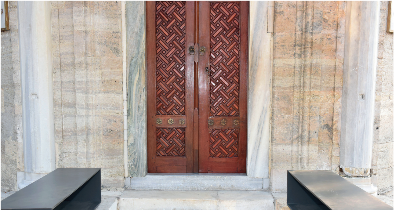
2019 yılındaki restorasyon sonrası revaklı giriş