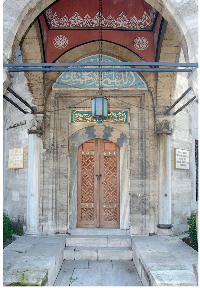
2013 yılında yapılan restorasyon öncesi revak tonozu