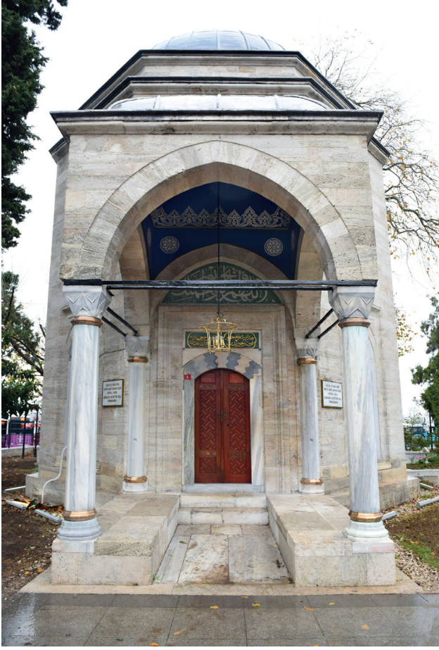
2019 yılında yapılan restorasyon sonrası