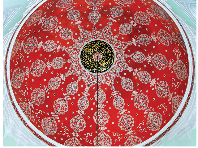
2013 yılındaki restorasyon öncesi kubbe içi

Selçuklu türbelerinden esinlenen türbe, yapısal olarak Sinan Okulu’na bağlı, Klasik Türk stilinde gruplandırılmıştır. Külliye haziresinde ayrıık nizam olarak tesis edilmiştir. İç ve dış elevasyonu zengin, renkli, çift konstrüksiyon ikiz formu kubbeye sahiptir. 11