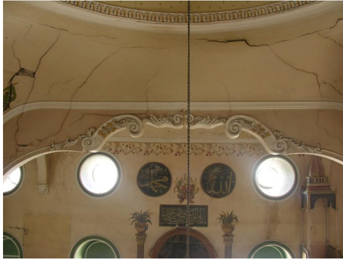
Fotoğraf 26- Güneydeki beşik tonoz ile kubbeyi taşıyan kemer formu.