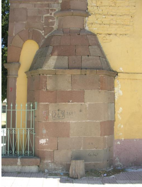
Fotoğraf 2- Minare kürsüsü, pabucu, gövdenin alt kesimi ile son cemaat yeri batı duvarı.