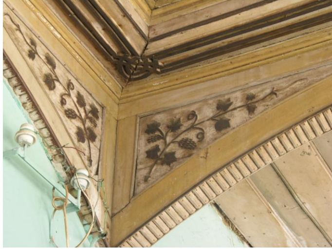
Fotoğraf 23- Son cemaat yeri orta biriminin kemer köşeliklerindeki bitkisel bezeme.