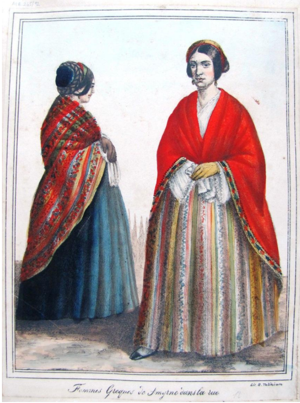
Res. 1: Sokakta İzmirli Rum Kadınlar. Boğos Tatikian. 1893. Gift Made by H.I.M. the Sultan Abdul-Hamid II to the National Library of the United States of America albümünden. Atatürk Kitaplığı, İstanbul.

bulunmaktadır. 1893 tarihli bu albüm, II. Abdülhamid Dönemi'nde Birleşik Devletler Kongre Kütüphanesi için hazırlanmıştır ( Res. 1 ). Bu albümde, İzmir'in sokak satıcılarını, Rum, Ermeni, Yahudi ve Türk kadın ve erkek tiplerini, giyim ve kuşamlarını gösteren sonradan renklendirilmiş taş baskı resimler yer almakta, kentteki çok yönlü renklilik adeta Tatikyan'ın resimlerinde hayat bulmaktadır.