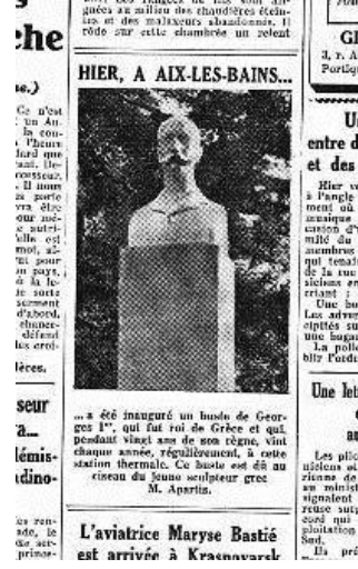
Res. 15: Yunanistan Kralı I. Geórgios'un büstü ile ilgili haber. Le Figaro , 25 Temmuz 1937, s. 3.