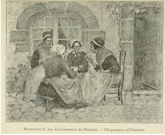
Res. 8: Plouénan'ın Dedikoducuları . Christian de Marinitsch. (Exposition aux Salon d'Artistes Français 1893, no. 1199)

Fleury ve G. Ferrier'den resim eğitimi aldığı bilinmektedir. 23 1879-1914 yılları arasında Paris'te düzenlenen Société des Artistes Français'in sergilerine katılmıştır. 1893 Salonu'nda sergilenen Plouénan'ın Dedikoducuları ( Res. 8 ) bunlardan biridir. 24 Sanat yaşamını Paris'te sürdürmüş olan sanatçının bazı eserlerine o dönemde İzmir'deki galerilerin de ev sahipliği yaptığı anlaşılmaktadır; Galerie P. Miolti ve 1897'de kendisine onur ödülü kazandıran Gece Vakti Dönüş adlı çalışmasının yer aldığı Galerie Sparlati bunlar arasındadır. Ayrıca mesleki kariyerine bakıldığında, Monde Illustré , La Revue de Paris , l'Illustration , La France Illustrée ve l'Univers Illustré için çalışmalar yaptığı anlaşılmaktadır. 25