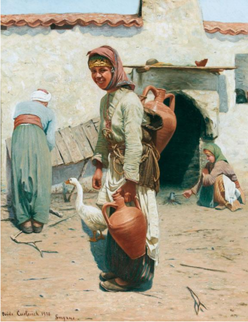
Res. 4: Amfora Taşıyan Genç Kız , Ovide Curtovich, 1910. Özel koleksiyon

Viyana Güzel Sanatlar Akademisi’nde Avusturyalı ünlü ressam Eduard Ritter von Engerth’in öğrencisi olan ve Royal Academy of Arts’ın 1892 yılı sergisine katılan Curtovich’in, “Atölye Pasajı, Smyrna” adresi ile sergi kayıtlarına geçtiği, Dinlenme Anı-Sabah, Bornova Ovası (sergi no. 32) ve Nymphia Yolu’nda, Öğlen (sergi no. 844) adlı resimlerle bu sergiye katıldığı anlaşılmaktadır. 14 Resimlerinde büyük ölçüde yaşadığı kent olan İzmir ve çevresine dair izlenimlerine yer veren ressamın Amfora Taşıyan Genç Kız (Res. 4) adlı çalışması bu örneklerden biridir.