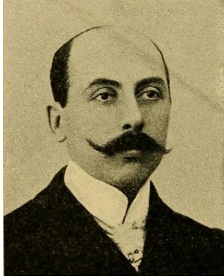
Res. 7: Christian de Marinitsch , fotoğraf.