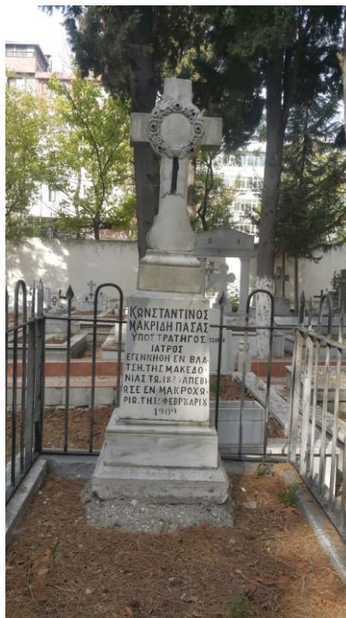
Ο τάφος του Κωνσταντίνου Μακρίδη Πασά (φωτ. π. Αντώνιου Καρατζίκου, ιερατικού προϊσταμένου του Ι. Ν. αγίου Γεωργίου Μακροχωρίου, 4.9.2020).