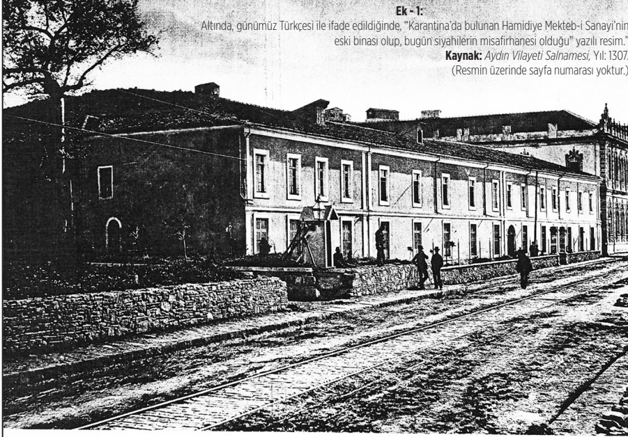
Ek - 1:

Altında, günümüz Türkçesi ile ifade edildiğinde, "Karantina'da bulunan Hamidiye Mekteb-i Sanayi'nin eski binası olup, bugün siyahilerin misafirhanesi olduğu" yazılı resim."