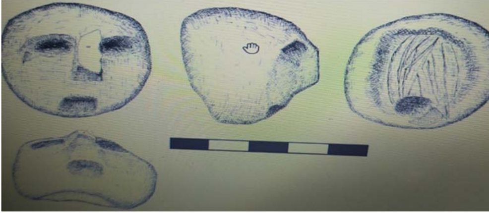
Foto 4. Nevali Çori minyatür maske çizimi