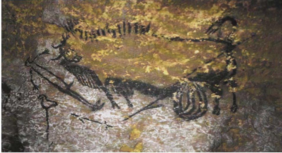
Foto 1. Lascaux maske taktığı düşünülen kuş başlı adam

https://www.visionaryartexhibition.com/archaic-visions/the-bird-man-of-lascaux Erişim Tarihi 22.01.2021