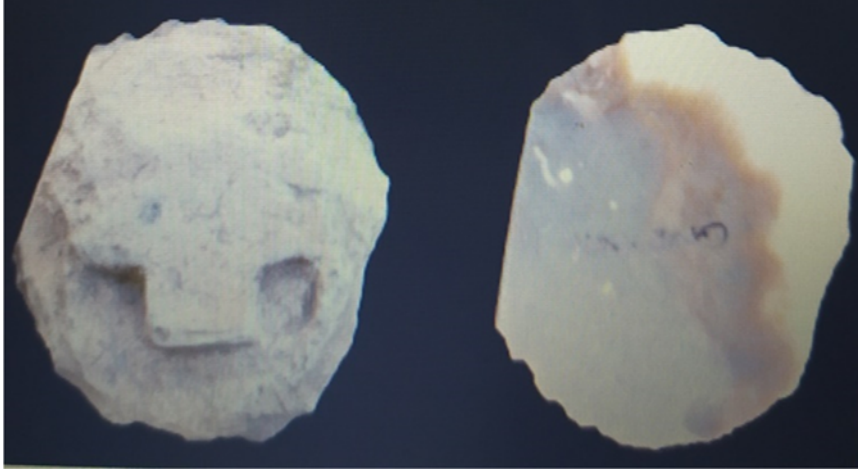
Foto 6. Göbekli Tepe’de bulunan çeşitli maske örnekleri. Dietrich, O.- Notroff, J.- Dİetrich, L. (2018) “Masks and masquerade in the Early Neolithica view from Upper Mesopotamia”, Time and Mind ”, The Journal of Archaeology, Consciousness and Culture ,2018, 11: 1.

Neolitik dönemin sembolizmi içerisinde bazı hayvanlara ayrı bir önem atfedilmiştir. Bu hayvanlardan biri de leopardır. Domuztepe’de leopar hayvanına ayrı bir değer verildiği ve ayinlerde kullanılmak üzere maskesinin yapıldığı çanak çömlek parçaları üzerindeki motiften anlaşılabilir. Bu boyalı çanak çömlek parçasının üstünde leopar maskesi olduğu düşünülen bir tasvir vardır. Parçalar oldukça küçük olarak işlenmiştir. Burada dinsel bir sahnenin anlatılmak istendiği açıktır. Tasvirin, şamanik birtakım öğeler içerdiği ileri sürülmektedir. Bu iddiaya göre; tasvirde şamanın transa geçerek ruhlarla iletişime geçmek amacıyla hayvan kılığına bürünmesini anlattığı düşünülmektedir. Bu amaç yüze takılan maske ile sağlanmaktadır. (Schmidt, 2007: 241; Carter, 2012: 116).