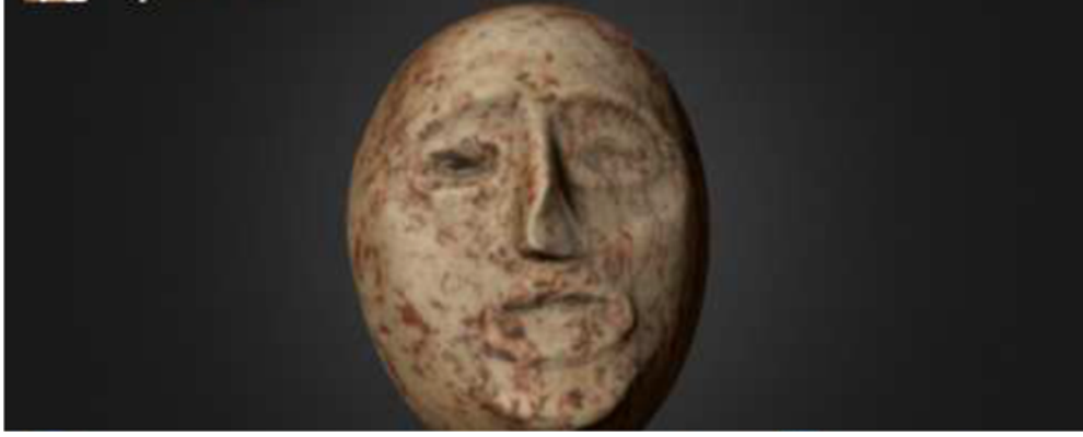
Foto 2. Er- Ram Maskesi. Bienert, H. (1990) “The Er- Ram Stone Mask At The Palestine Exploration Fund, London”, Oxford Journal Of Archaeology 9(3).

Ürdün’de Neolitik bir yerleşme olan Ain Ghazal’da yapılan kazılarda da ölüm ritüelleri ile bağlantılı olduğu düşünülen sıvalı kafatasları ile taş maskeler bulunmuştur. Maskelerin yanında figürinler ve heykeller de tespit edilmiştir (Mithen-vd, 2016: 86).