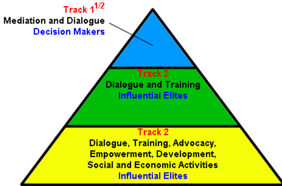
Şekil 3: Diplomasi Kulvarları

Resmi aktörlerle gayri resmi müdahalelere örnek olarak Dartmouth konferansını örnek göstere biliriz. Bu konferans 1993 yılında Tacikler arası diyalog süreci olarak bilinmektedir (SLİM ve SAUNDERS 2001). BM ve BDT (Bağımsız Devletler Topluluğu) başkanlığı altında birçok kez barış süreci için konferans düzenlendi. 1994 yılında yapılan konferansta bu süreç “halkların barışı süreci” olarak sloganıyla süreç yönetilmeye başlandı. 1997 yılında yapılan Harold Henry Saunders’in önerdiği portatifler esasında nihai sonuca varılarak ortak bir diyaloga ulaşılmıştır. Harold Henry Saunders’in önerdiği bu çözüm yolu resmi aktörlerle resmi olmayan müdahaleler sonucu olumlu sonuç kazanmanın bir yöntemi olarak Track Two Diplomacy kulvarında yer almaktadır. Genelde bu işlerin yürütülmesinde uluslararası kuruluşlar tarafından çatışma gurubunun her ikisinin de arasından bu konularda bilgili şahıslar seçilerek çözüm yolları aranır (Chigas 2003).