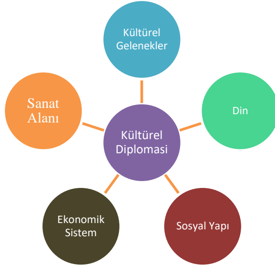
Şekil 2: Kültürel Diplomasi Elvin ABDURAHMANLI tarafından düzenlenmiştir

Kaynak: (Yeni Diplomatik Yöntemler: Çevre Diplomasisi 2018)