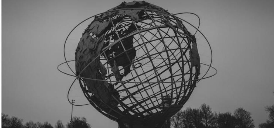
Şekil 1: Diplomacy