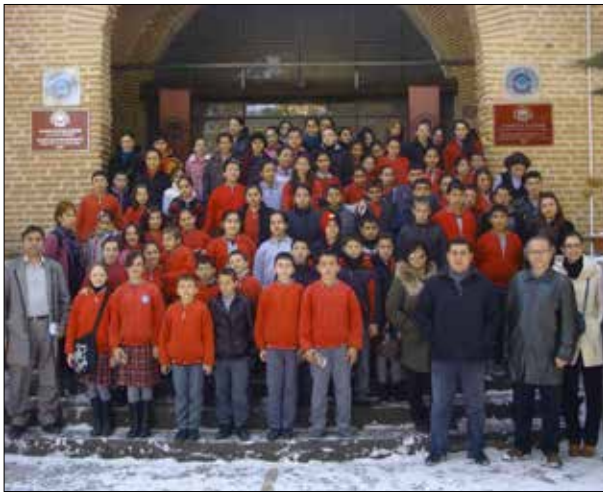
Fotoğraf 19. İlköğretim öğrencileri Eskişehir müzelerini geziyor etkinliği

2012 yılı: Bu yıl Birim'in en az etkinlik düzenlediği dönem oldu. Bu satırların yazarının altı ay süre ile yurt dışında bulunması ve diğer bazı yönetsel engeller dolayısıyla 2012 yılında ancak 19 etkinlik düzenlenebildi. Gerçekleştirilen etkinlikler arasında 11 konferans, dört söyleşi, üç eğitim ve bir sergi yer alıyor. Bu dönemin en dikkati çeken etkinliği, Eskişehir Skal Kulübü ile birlikte düzenlenen İlköğretim Öğrencileri Müzeleri Geziyor oldu. Bu faaliyet kapsamında Eskişehir'in kenar mahallerinde ikamet eden 1200 öğrenciye müzeler gezdirildi.