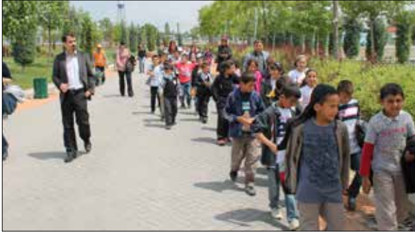
Fotoğraf 29. İlköğretim Öğrencileri Kentpark'ı gezerken