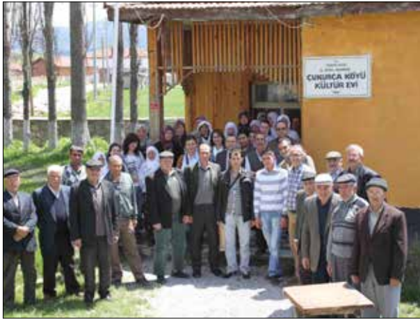
Fotoğraf 38. Çukurca-Şükranlı köylüleri ile eski eserlerin korunması konulu seminer sonrasında toplu halde

7. Eskişehir'in gezi haritası hazırlanacaktı: Eskişehir'de gezilecek yerlerin harita üzerinde gösterimine yer verildiği bir gezi rehberi hazırlanması da Turizm Araştırma ve Uygulama Birimi bünyesinde düzenlenmesi planlanan etkinlikler arasında yer alıyordu.