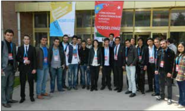
Fotoğraf 31. Türk Dünyası Turizm Kurultayı'na katılan bir bölüm öğrencisi

2. Türkiye Turizmi Sözlü Tarih Projesi: Çoğunluğunu Birim etkinliklerine destek olan lisansüstü öğrenci ve öğretim elemanlarının araştırmacı olarak yer aldıkları bir projedir. Projede sözlü tarih yöntemiyle Türkiye'de turizmin gelişme dönemine tanıklık etmiş yaklaşık 500 kişi ile görüntü ve ses kayıtlı görüşmelerin yapılması öngörülmüştür. Ekim 2014 tarihi itibarıyla projede 400 kişi ile görüşmeler tamamlanmış, projenin raporlaştırılma çalışmalarına başlanmıştır. Bu proje de Turizm Araştırma ve Uygulama Birimi etkinliklerinin bir sonucu olarak ortaya çıkmıştır.