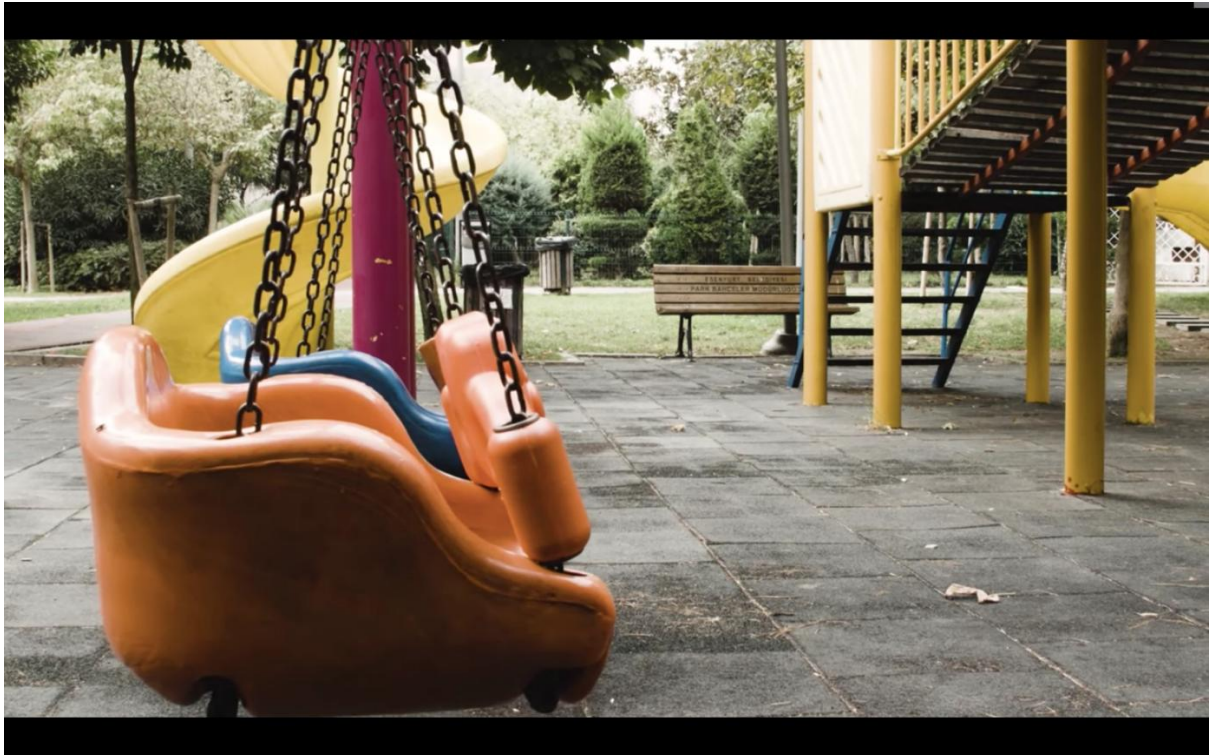
( Eve Sığmayan Hayatlar , Sertaç Yıldız, 2020)

güvencesizliği daha da sağlamlaştırır. “Z” bu adaletsiz dağılımı şöyle dile getirir: “Biz kargo çalışanları her gün o kargolarla aynı ortamda yüzlercesine temas halindeyken genel müdürlük ve bölge müdürlüğü çalışanları home office ve vardiya düzenine geçerek kendi sağlıklarını korumaya giriştiler”. Öyleyse burada vurgulanan şudur: Daha kırılgan kılınan, tehlikeye açık bırakılan ve olanaksızlıklar içinde kalan her zaman daha riskli koşullar altında çalışmaya zorlanandır. Ancak “Z”nin de dediği gibi aslında uygulanması gereken ise şudur: “Ekonomik yaşam bir şekilde sürekli devam etmek zorunda olduğu için birileri sürekli çalışmak zorunda. Ancak salgını durdurmak için bir karantina uygulanacaksa halkın tamamına uygulanmalıydı.”