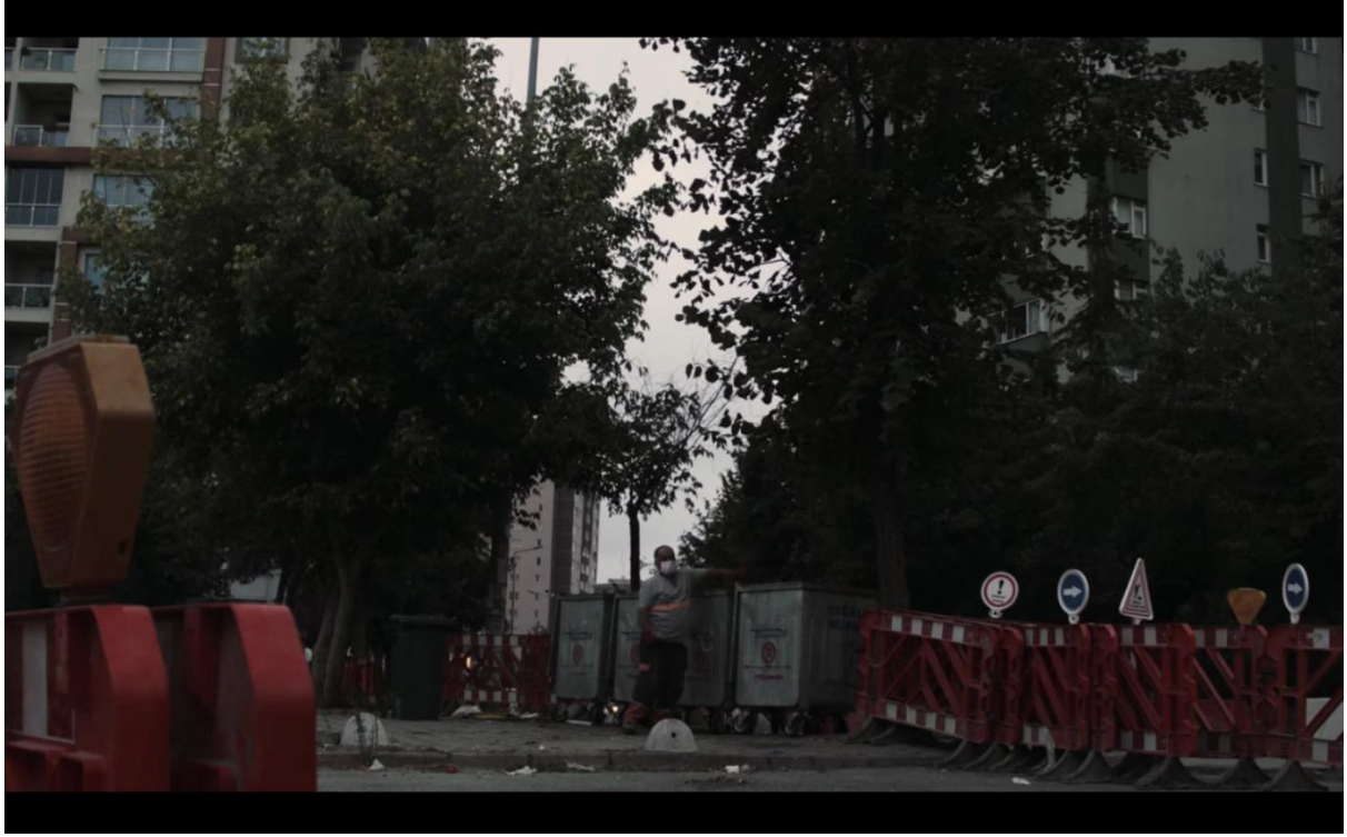
(Eve Sıđmayan Hayatlar, Sertaç Yıldız, 2020)