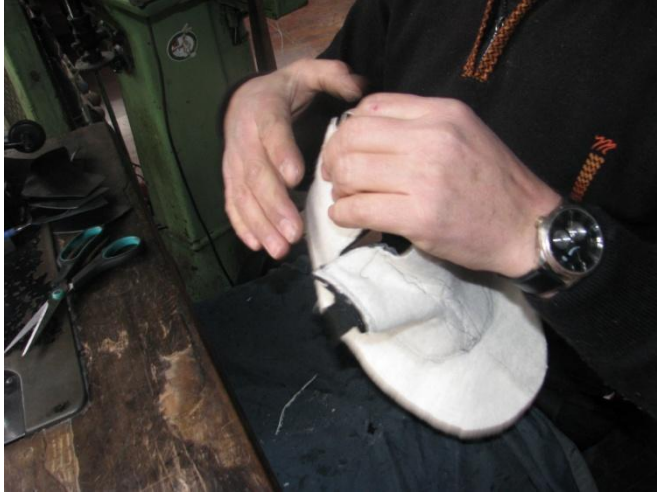
Fotoğraf No 12: Parçaları birleştirilen mestin iç yüzeye çevrilemesi

Taban kısmı hariç parçaları birleştirilen mest, içi miflonlu yüzeye çevrilir (Fotoğraf 12).