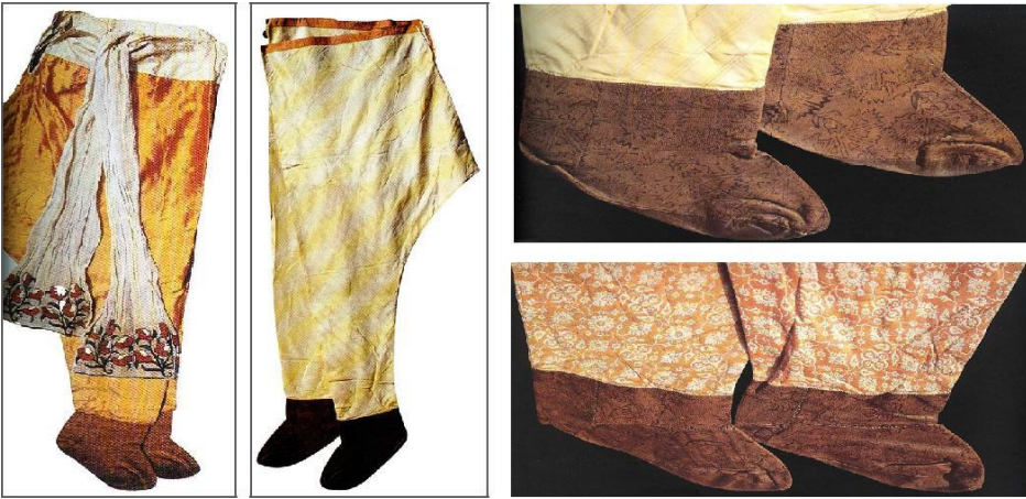
Fotoğraf No 3: Topkapı Sarayı Müzesinden giysiye dikili mest örnekleri( Sakaoğlu ve Akbayar 2002:236-37)

Osmanlı Dönemi ayakkabılarına ait bilgiler genellikle arşiv belgelerine, seyyahların notlar ına, hediye, masraf ve narh belgelerindeki kayıtlara dayanmaktadır. Bu belgelerin ilginç yanı her ay padişaha on çift çizme, iki ayrı kalite on iki çift pabuç, altı çift mest ve sekiz çift terlik dikildiğini göstermektedir (Delibaş 1989:9). En yaygın giyilen ayakkabı çeşidi, mest pabuçlardır. İç edik de denilen, altı kösesiz, konçlu, yumuşak mestler içerde giyilir, dışarı çıkarken sarı meşinden yapılmış üzeri baskı, işleme gibi çeşitli yöntemlerle bezenmiş ayakkabılar giyilmiştir (Fotoğraf 1,2) (Tezcan 1998: 62). Ayrıca Topkapı Sarayı Müzesi koleksiyonunda pantolona dikilmiş mest örnekleri de bulunmaktadır (Fotoğraf 3).