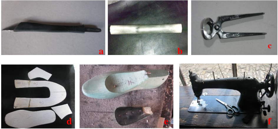
Fotoğraf No:5 Mest yapımında kullanılan araçlar (a:bıçak, b:masat c:kerpeten, d:endaze, e: ayakkabı kalıbı, f: dikiş makinesi.)

Dikiş makinesi: Deri dikiminde kullanılır. (Fotoğraf 5f).