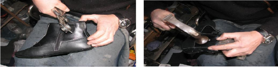
Fotoğraf No 18: Çarklı zımba ile düğme yeri açılması ve düğmenin takılması

Kalıplama işlemi bittikten sonra fermuar yerinin 2 cm. altından dikilerek sabitlenmiş deri şerit parçasına çarklı zımba ile düğme yeri açılır ve karşı tarafına düğme takma işlemi yapılır.(Fotoğraf 18).