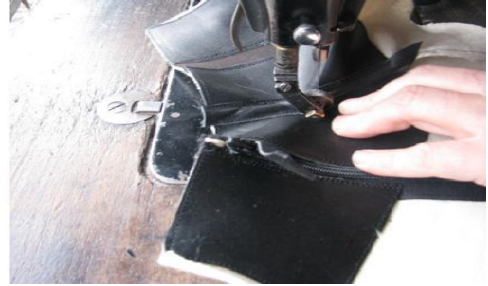
Fotoğraf No 9: Yan parçaların önden birleşimi ve birleşen parçaların üstüne deri ile makinede süs yapımı

Saya ve yan parçalar makinede dikilerek birleştirilir (Fotoğraf 10).