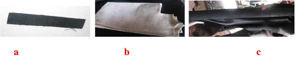
Fotoğraf No: 6 Mest yapımında kullanılan gereçler (a: lastik b: miflon c: deri )