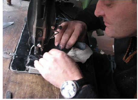
Fotoğraf No 13: Çevrilen mestin arka tarafına deri parçası dikimi

Yine 2cm. eninde deri şerit parçası tıraşlanarak inceltilir. Şerit parçası mestin boğaz kısmının çevresini temizlemek amacıyla biye şeklinde çevrilerek makinede dikilir (Fotoğraf 14).