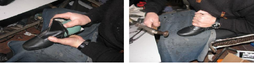
Fotoğraf No 17: Dikilen mestin kalıba konulması ve çekiç ile düzeltilmesi

Mest numarasına göre seçilen kalıp mestin içerisine yerleştirilip çekiç ya da muştâ ile dövülerek kalıplanır (Fotoğraf 17).