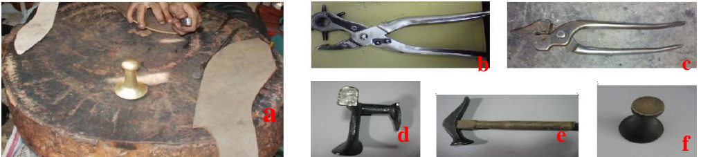
Fotoğraf No:4 Mest yapımında kullanılan araçlar (a: tezgâh, b: Çarklı zimba, c: tanalıya, d: örs, e: çekiç, f: muşta)

Muşta: Sayayı düzeltmek, yemeninin tabanını dövmek, dikiş yerlerini düzeltmek için kullanılır. Deri dövmede kullanılır dört tanedir(Acar 2006:174) (Fotoğraf 4f).