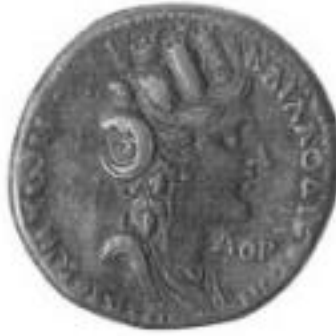
Res. 3. Laodikeia (MS 124/125) (Butcher, 2003: 238).