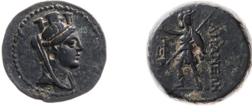
Res.2. Apameia (MÖ 150/149) (Hoover, 2018).