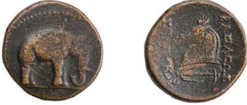
Res.1. Apameia (MÖ 300-281) (BMC Seleucids, II.7).