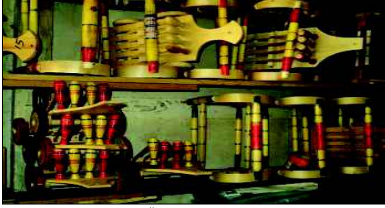
Fotoğraf No 4: Üretilen oyuncaklardan görünüm.

Üretimde kullanılan hammadde yöreden sağlanmakta olup, ceviz ve çam başta olmak üzere her çeşit ağaç kullanılmaktadır (Fotoğraf No.5). Atölyenin arka kısmında, kesim, şekillendirme ve renklendirmeden oluşan üretim gerçekleştirilmekte olup, ön kısımda ürünlerin teşhiri ve satışı yapılmaktadır.