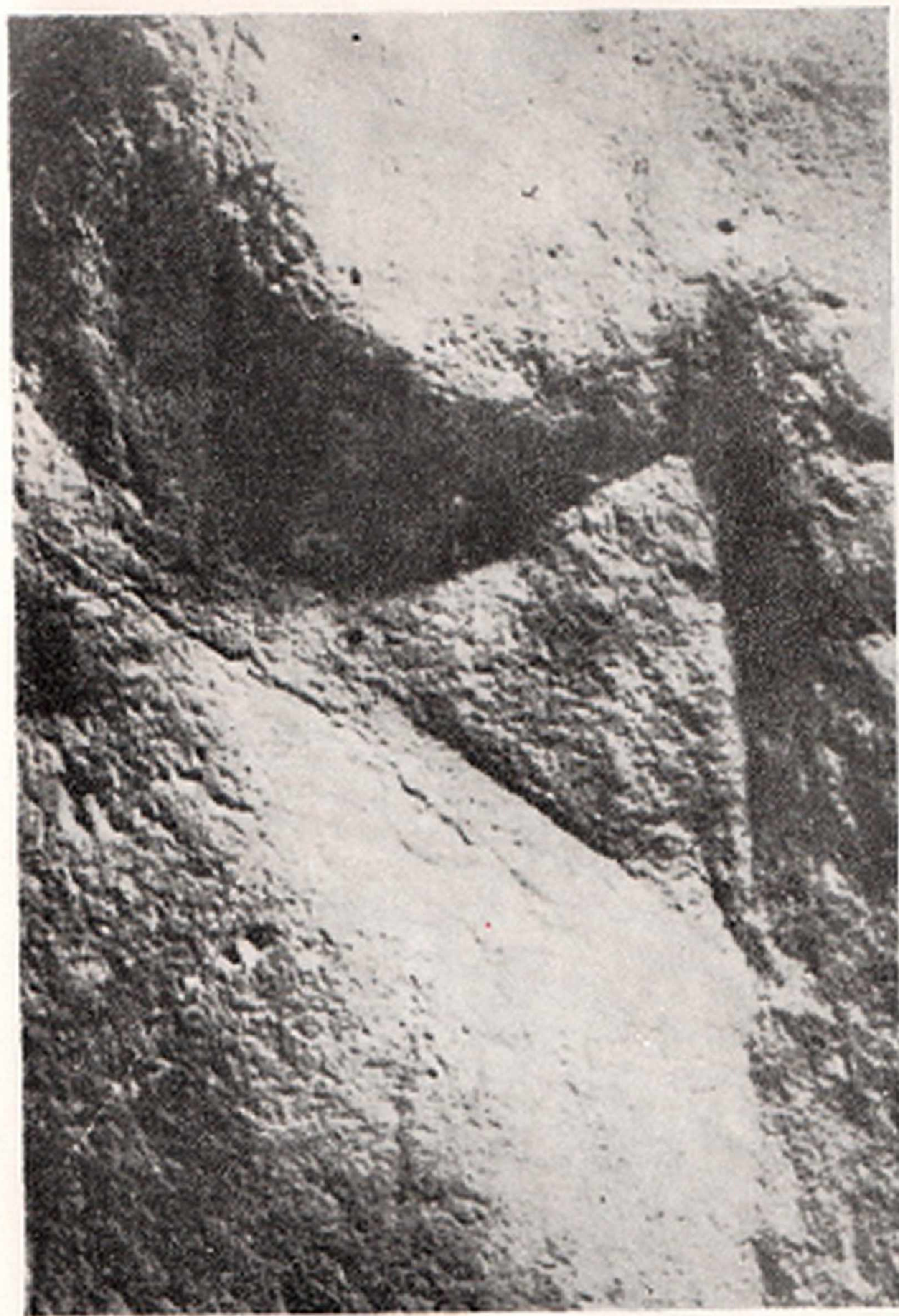
Res. 12- Kadın gravürü. La Madeleine (Fransa)