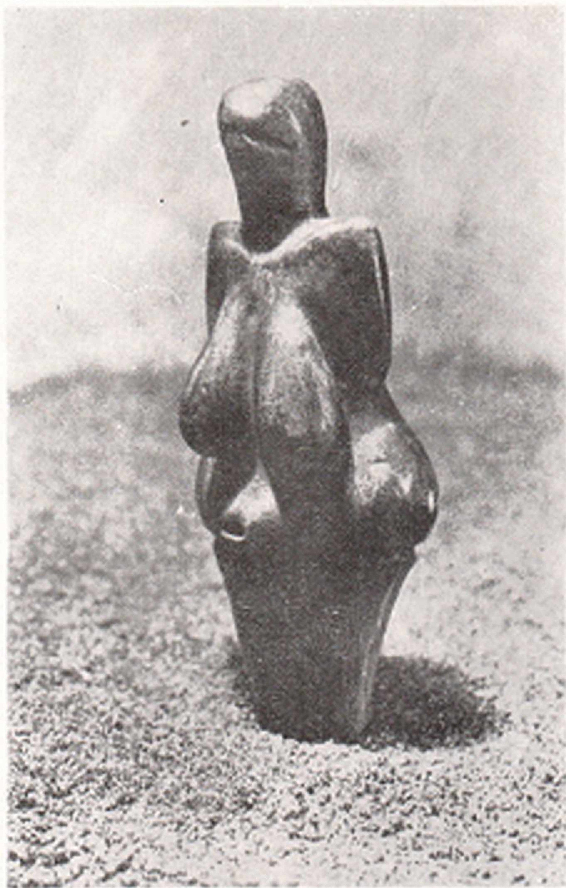
Res. 9. Orinyaiyen kadın heykeliği Dolni Vestonice (Moravya - Çekoslavakya)