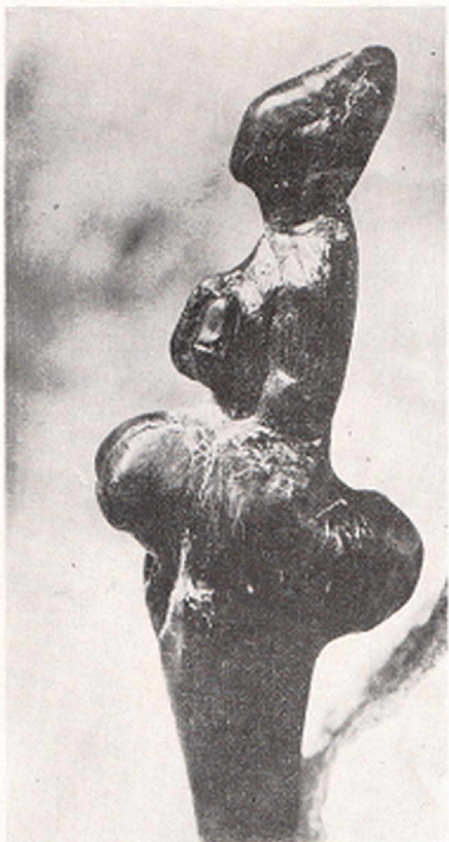
Res. 10- Orinyasiyen kadın beykeciği (taştan). "Le Polichinelle" Boy. 62 mm. Brassé-Roussé (Grimaldi, Ligurie, İtalya)