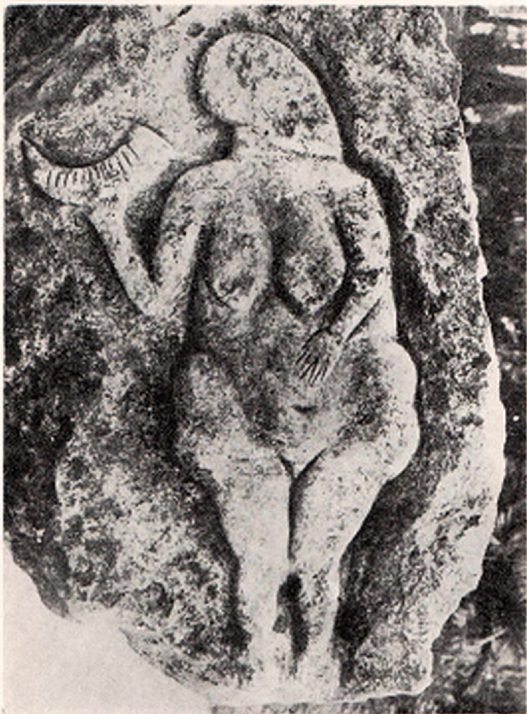
Res. 1- "Elli Boyunda Kadın" alçak kabartması. Lauscel (Lardev, Fransa) kayıuşması