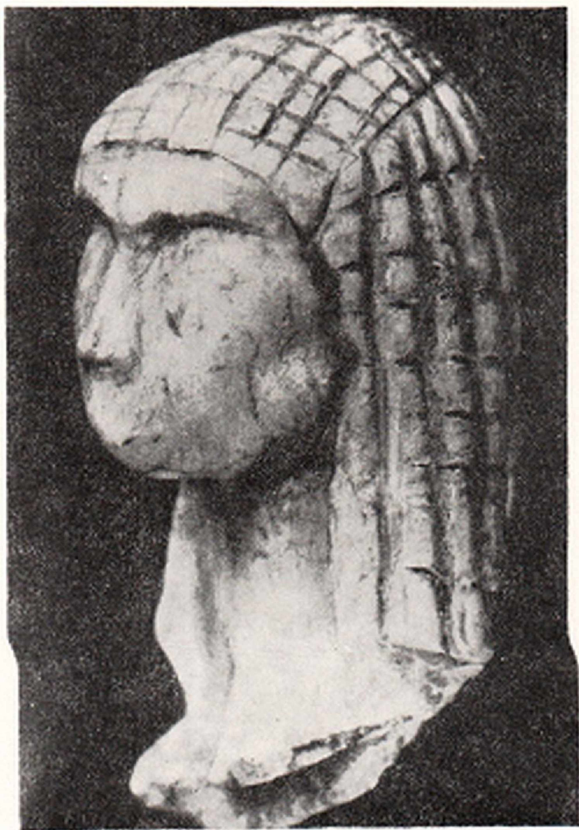
Res. 4- Braxempoury kadın başı heykeliği Braxempoury (Landes, Fransa)