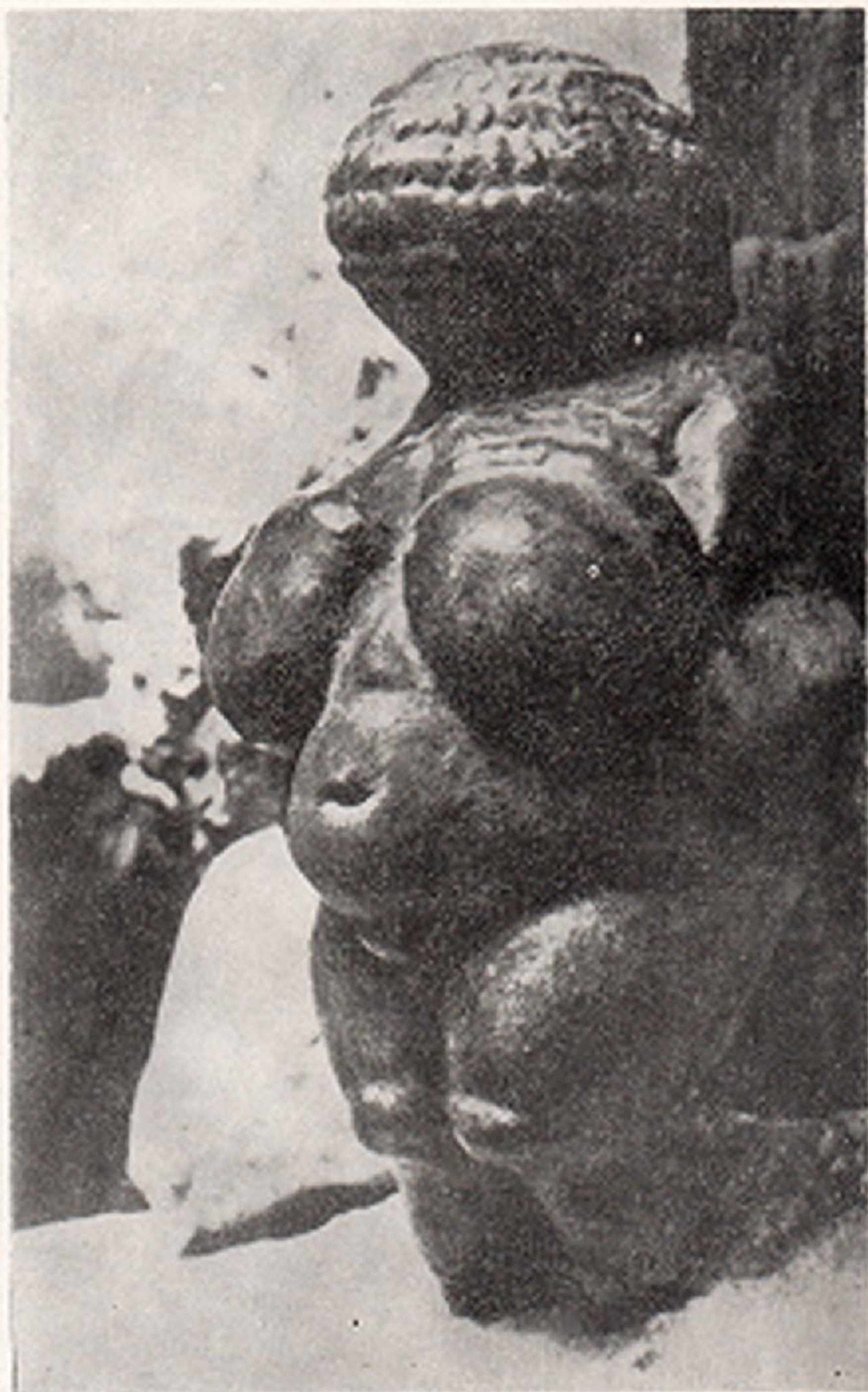
Res.2- Willendorf Venüsü (Aşağı Avusturya)