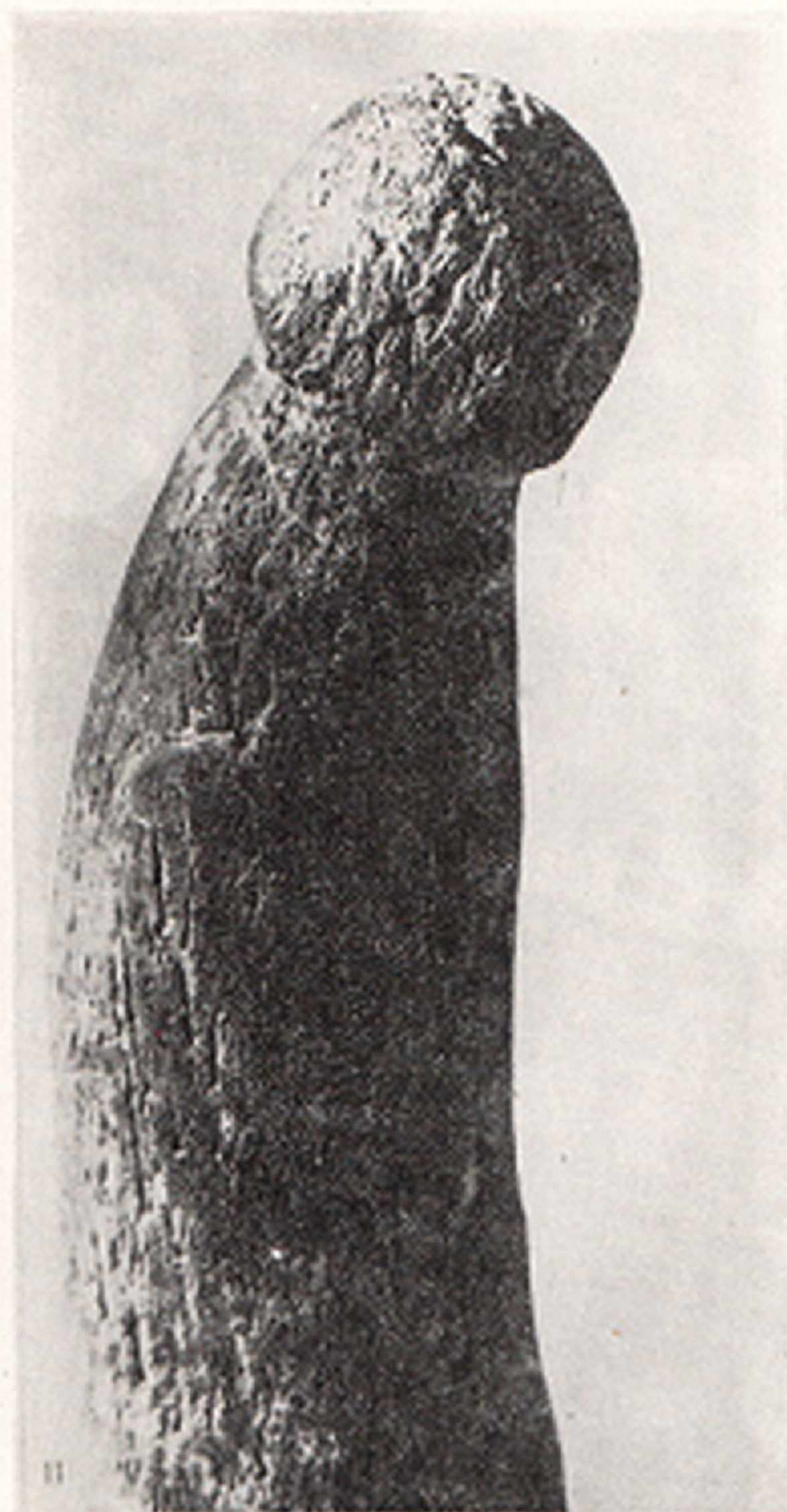
Res. 5- Bizca boynuzundan sülize insan figürünü (Sergiac, Dordogne, Fransa)