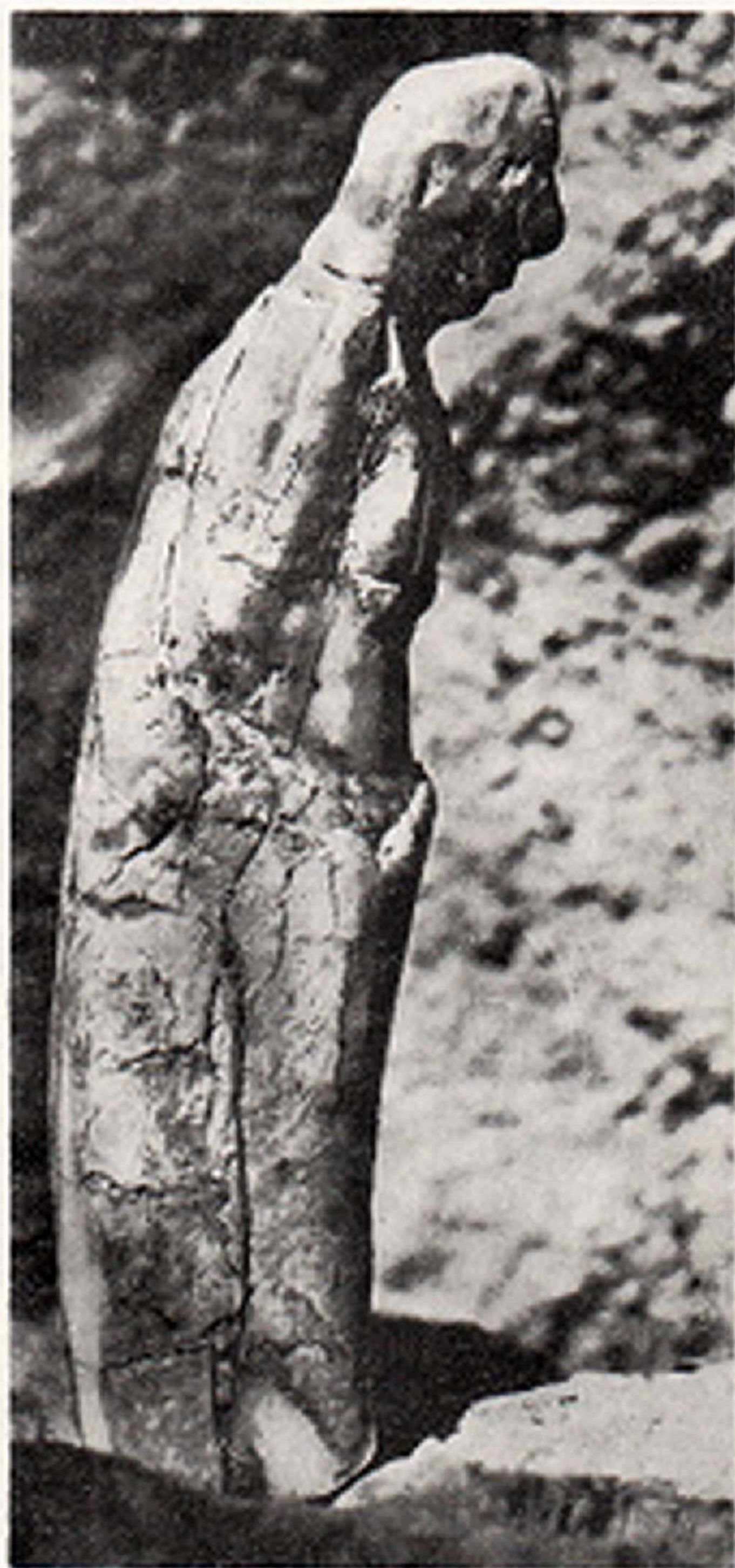
Res. 6- Kadın heykeliği. Atdişite oyulmuş. Boy 55 mm. Magdaleniyen Mas d' Azil (Ariège) Fransa