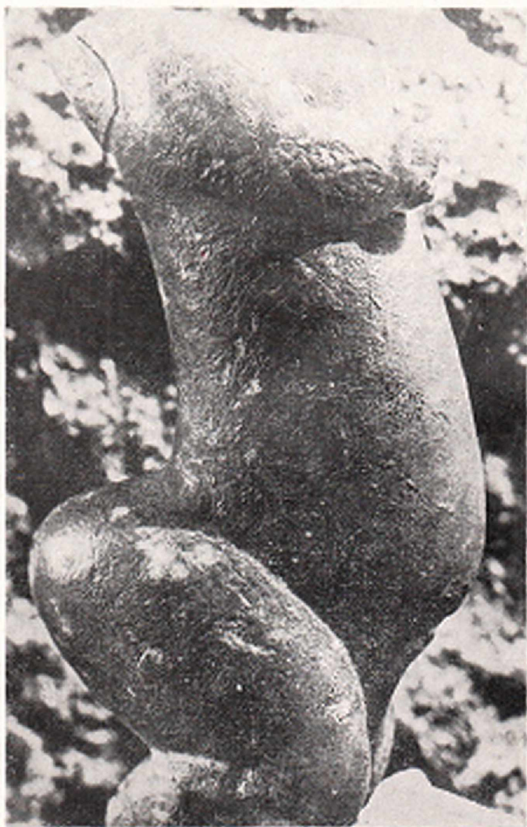
Res. 11- Kalitren Sireuil Venüsü Goulet de Cazelle. (Sireuil, Dordogne Fransa)