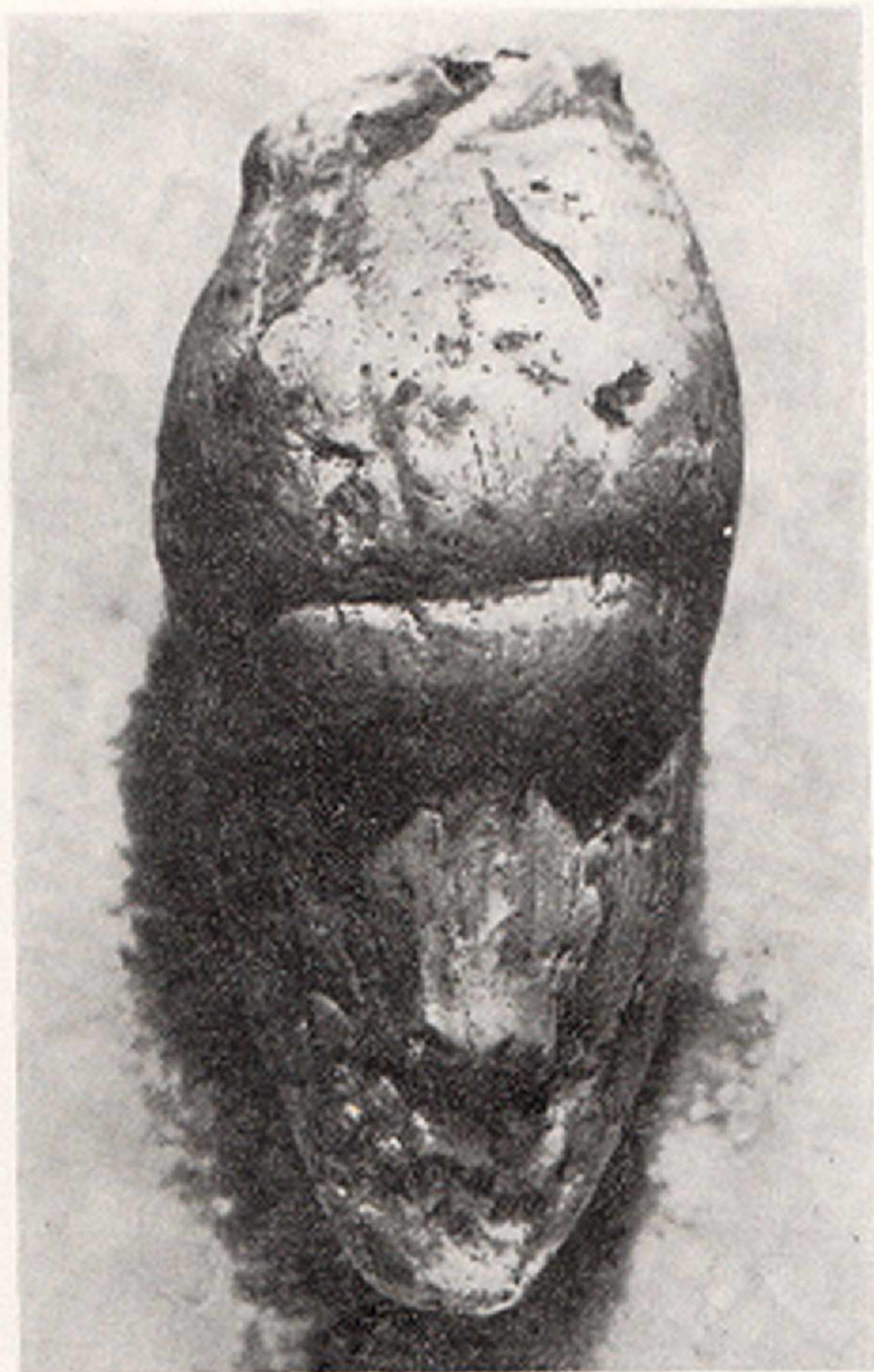
Res. 3- Fildişi kadın başı figürünü Dolní Věstonice (Moravya - Çekoslovakya)