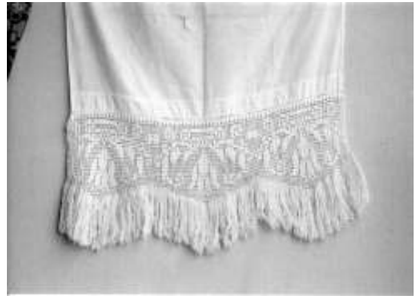
Resim 16. Bağlantılı düzgün sıralamalı kompozisyon düzeninde perde kenarı danteli (Uçları püsküllerle temizlenmiş)