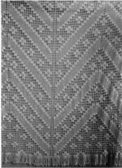
Resim 3. Yörede “Kâtip Defteri” adı verilen geometrik bezemeli dantel perde (Geometrik bezeme: Düz çizgi, V şekilleri, kare)