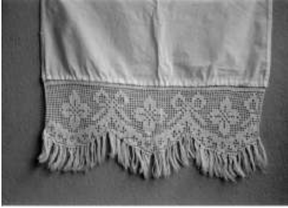
Resim 9. Bitkisel, geometrik ve nesneli bezemeli perde kenarı danteli (Bitkisel bezeme: Çiçek, Geometrik bezeme: Düz çizgi, yarım daire, Nesneli bezeme: Fiyonk)