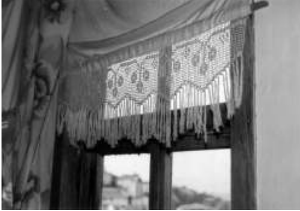
Resim 1. Yörede “Kirazlı” adı verilen geometrik ve bitkisel bezemeli perde kenarı danteli (Geometrik bezeme: Düz çizgi, zigzag, Bitkisel bezeme: Dal, yaprak, kiraz)

Bunlardan bazıları, “Yaver Kordonu”, “Gönül Kilidi”, “Hanım Gerdanı”, “Kirazlı”, “Yağmur”, “Kâtip Defteri”dir.