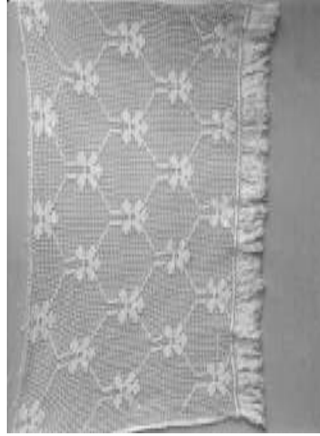
Resim 14. Atlamalı kompozisyon düzeninde dantel perde (Uçları püsküllerle temizlenmiş)