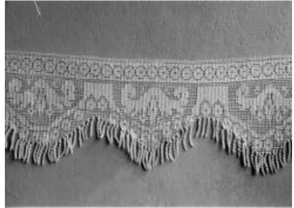
Resim 8. Yörede "Hanım Gerdanı" adı verilen geometrik ve bitkisel bezemeli perde kenarı danteli (Geometrik bezeme: Düz çizgi, kare, dikdörtgen, Bitkisel bezeme: Yaprak)