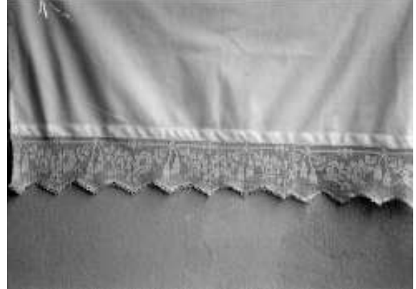
Resim 2. Yörede “Yaver Kordonu” adı verilen bitkisel, geometrik ve nesneli bezemeli perde kenarı danteli (Bitkisel bezeme: Çiçek, yaprak ve dallar, Geometrik bezeme: Düz çizgi, zigzag, Nesneli bezeme: Püskül)