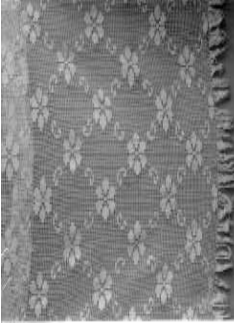
Resim 13. Atlamalı kompozisyon düzeninde dantel perde (Uçları püsküllerle temizlenmiş)