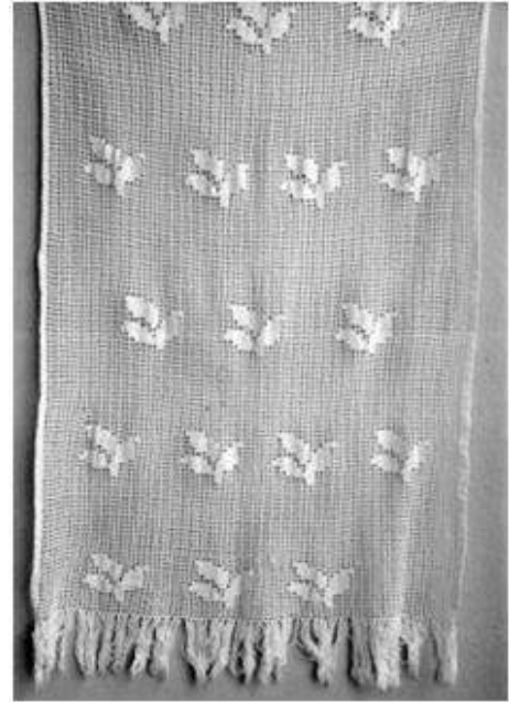
Resim 4. Bitkisel bezemeli dantel perde (Bitkisel bezeme: Yaprak)