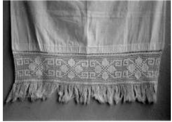
Resim 12. Yörede "Gönül Kilidi" adı verilen geometrik ve bitkisel bezemeli perde kenarı danteli (Geometrik bezeme: Düz çizgi, kare, Bitkisel bezeme: Çiçek)