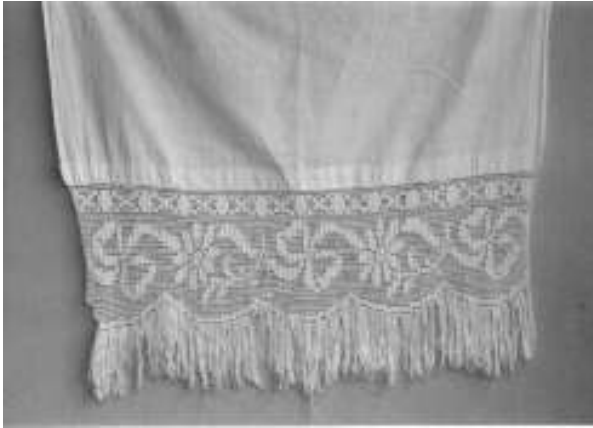
Resim 7. Bitkisel, geometrik ve nesneli bezemeli perde kenarı danteli (Bitkisel bezeme: Çiçek, yaprak ve dallar, Geometrik bezeme: Düz çizgi, yarım daire, Nesneli bezeme: Fiyonk)