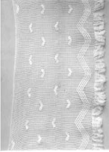
Resim 5. Geometrik ve nesneli bezemeli dantel perde (Geometrik bezeme: Düz çizgi, zigzag, Nesneli bezeme: Kalp)