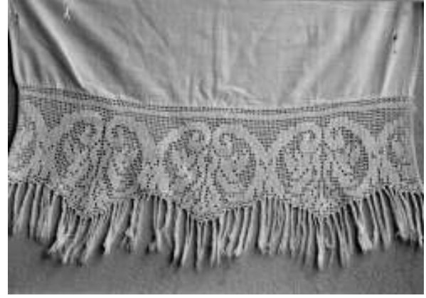
Resim 10. Bitkisel ve geometrik bezemeli perde kenarı danteli (Bitkisel bezeme: Çiçek, kıvrık dallar, yaprak, Geometrik bezeme: Düz çizgi)