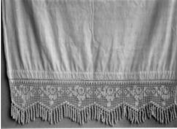
Resim 15. Bağlantısız düzgün sıralamalı kompozisyon düzeninde perde kenarı danteli (Uçları kurt adı verilen britlerle temizlenmiş)